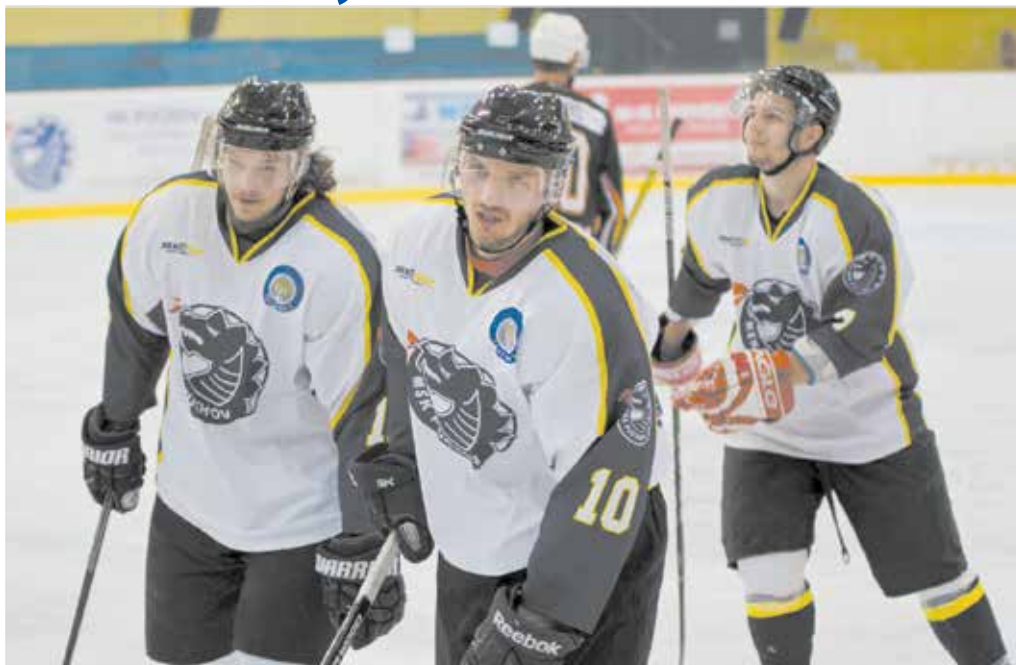
Druholigoví muži MŠK Púchov sa v úvodnom kole play-off stretnú s hokejistami Iskry Partizánske. Prvý zápas je na programe už v sobotu.