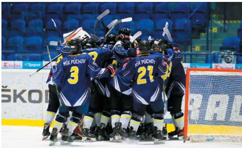
Takto sa dorastenci MŠK Púchov tešili v tejto sezóne po víťazstvách už 23-krát.