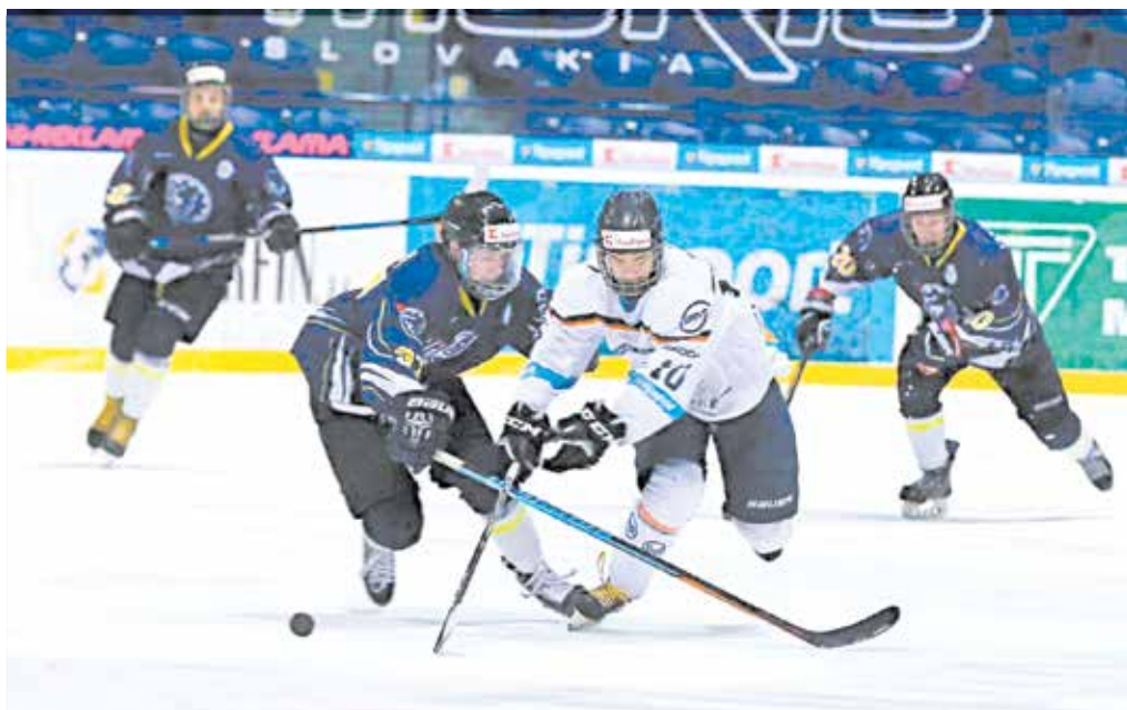
Extraligoví dorastenci MŠK Púchov vstúpili víťazne do nového roka. Na domácom ľade si dvakrát hladko poradili so Žilinou a poskočili na šiestu priečku tabuľky.