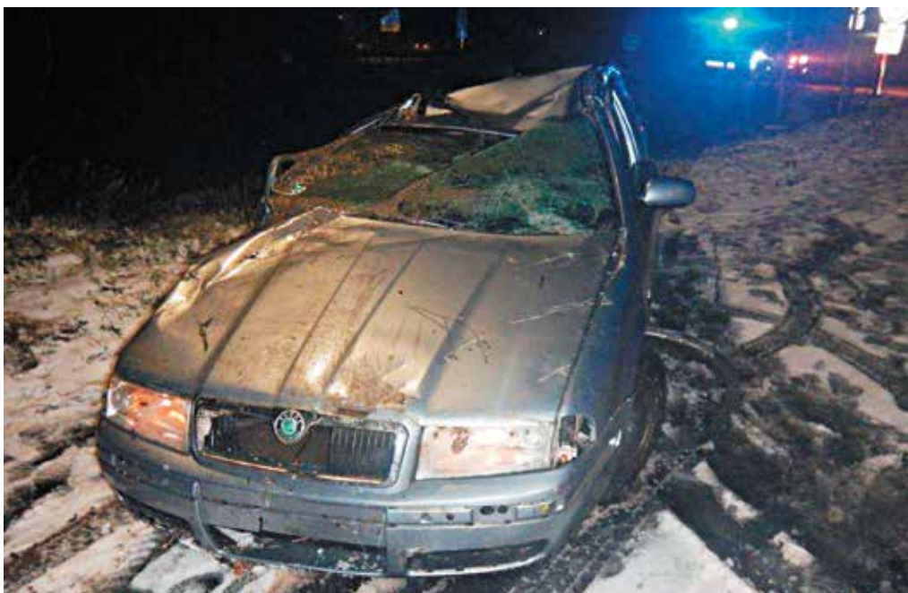
Od utopenia sa v automobile, ktoré spadlo do potoka, zachránili mladú ženu púčovskí policajti.

Priemerná evidovaná miera nezamestnanosti klesla na Slovensku v novembri na úroveň 5,09 percenta. Najvyššia nezamestnanosť na Slovensku bola v novembri v okrese Rimavská Sobota, kde dosiahla úroveň 16,31 percenta. (r)