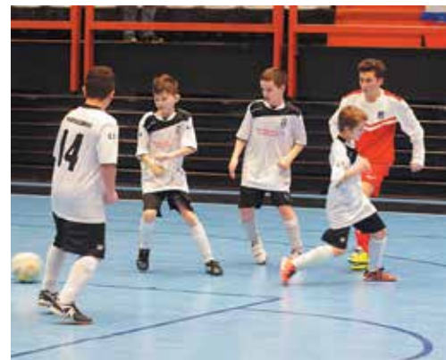
Obetaví Streženičania neraz až štyria bránili jedného hráča Domaniže. Nestačilo...