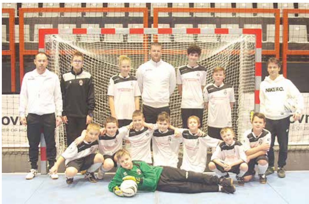
Mladší žiaci Streženíc si na turnaji v Považskej Bystrici vybojovali striebro.