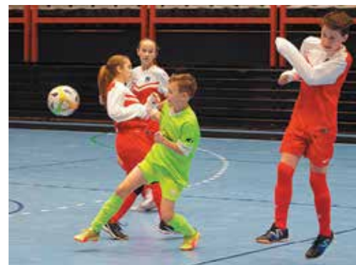
V stretnutí s Ladcami zvíťazili Púchovčania (v zelenom) najtesnejším rozdielom.