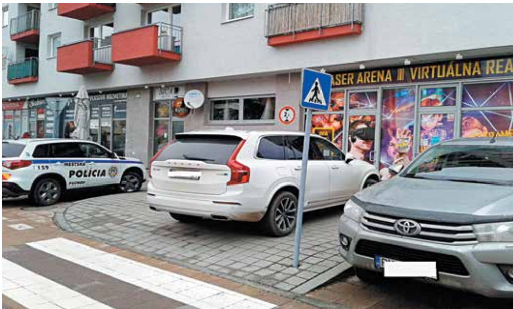
Aj takto dokážu zaparkovať niektorí vodiči v Púchove...

Púchovskí mestskí policajti zasahovali na základe telefonického oznámenia v Horných Kočkovciach na Kukučínovej ulici, kde sa voľne pohyboval írsky seter hnedej farby. Hliadka psa odchytila a previezla ho do kotercov za Podnikom technických služieb mesta Púchov, kde mu načítali čip, ktorý však nebol aktívny na portáli Komory veterinárnych lekárov. Psa nakrmili, napojili, priestupok je v riešení.