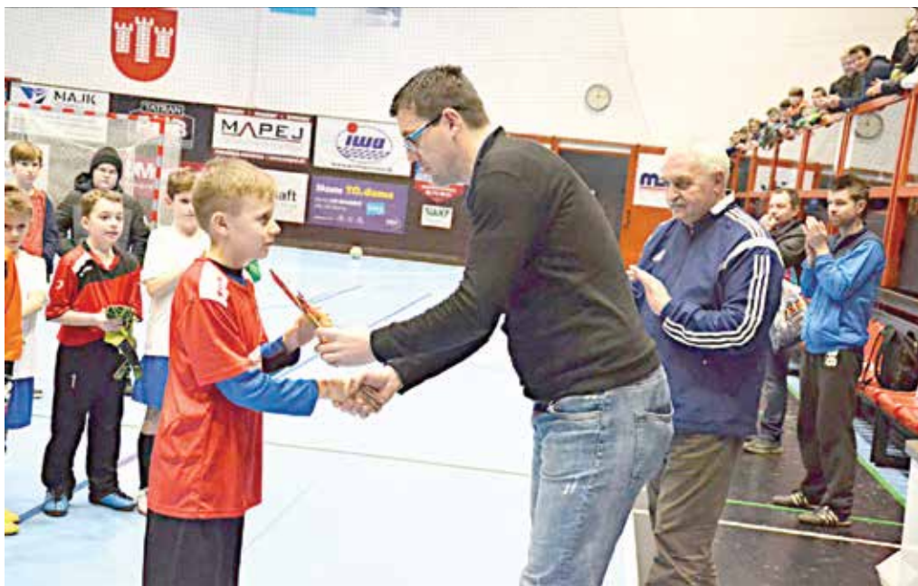
Kapitán púchovských prípravkárov preberá z rúk predstaviteľov Oblastného futbalového zväzu cenu za tretie miesto.