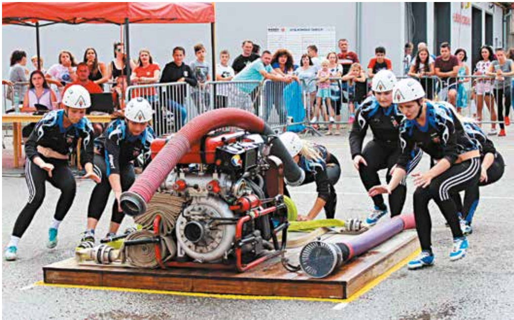
Žabky z Nosíc dokázali v desiatom kole Slovensko-moravskej hasičskej ligy vo Francovej Lhote zvíťaziť a upevnili si vedenie v čele seriálu.