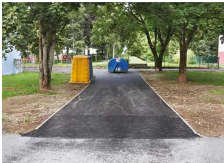
Asfaltovanie chodníku na Ulici obrancov mieru.