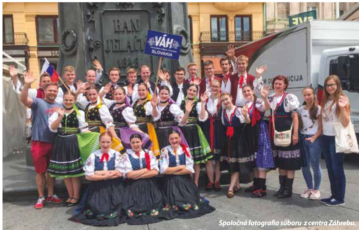
Spoločná fotografia súboru z centra Záhrebu.

Príchod leta a horúcich mesiacov možno u mnohých evokuje čas odpočinku, voľna a dovoleníek. Pre folklóristov však obdobie od júna do konca septembra znamená vyvrcholenie celoročných príprav na sezónu festivalov, jar-mokov, slávností a vystúpení.