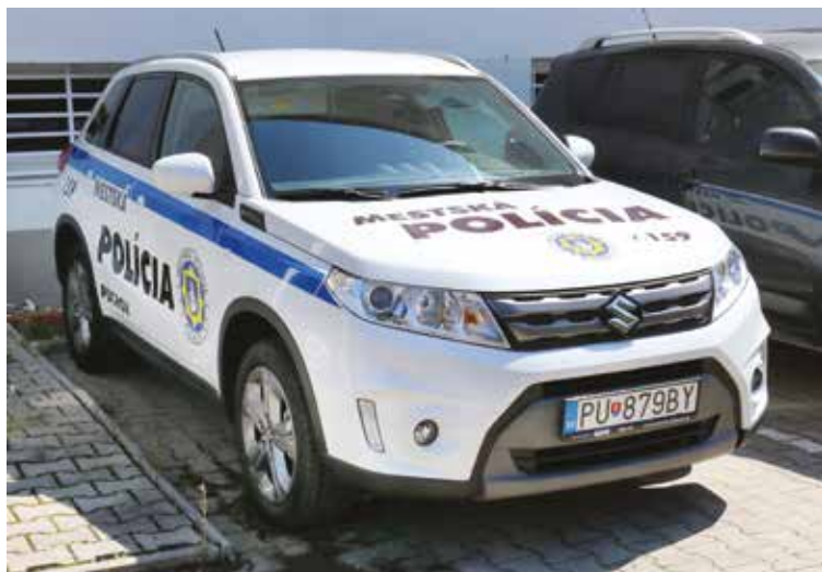
Nový služobný automobil Mestskej polície Púchov značky Suzuki.