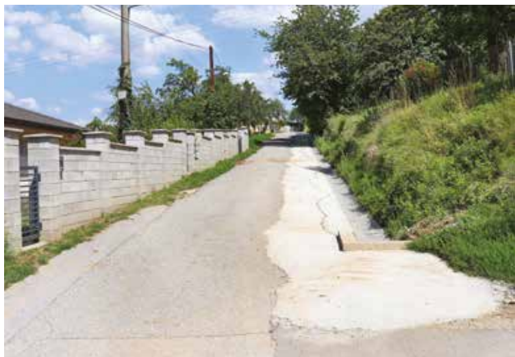
Oprava cesty na Vršku po nedávnych záplavách.