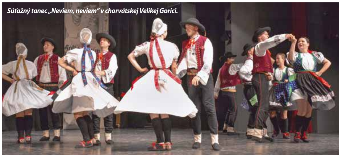
Súťažný tanec „Neviem, neviem” v chorvátskej Velikej Gorici.

Všetko to, čo robíme, by sme nedokázali bez podpory, preto sa touto cestou chceme poďakovať OZ Folklórne srdce Púchov, Divadlu Púchov - Púčovskej kultúre, s. r. o. a Trenčianskemu samosprávnemu kraju. Vďaka patrí aj rodičom malých i veľkých folklóristov, vedeniu detských súborov a skupín mesta Púchov a okolia, z ktorých sa mnoho členov rozhodlo pre účinkovanie vo FS Váh. Ak nás chcete podporiť alebo sa dozvedieť viac o FS Váh, tak nás sledujte na Instagrame @fsvah-puchov alebo na našej facebookovej stránke facebook.com/fsvahpuchov.