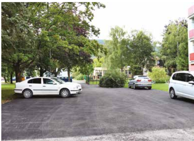
Rekonštrukcia parkoviska na Ulici obrancov mieru.