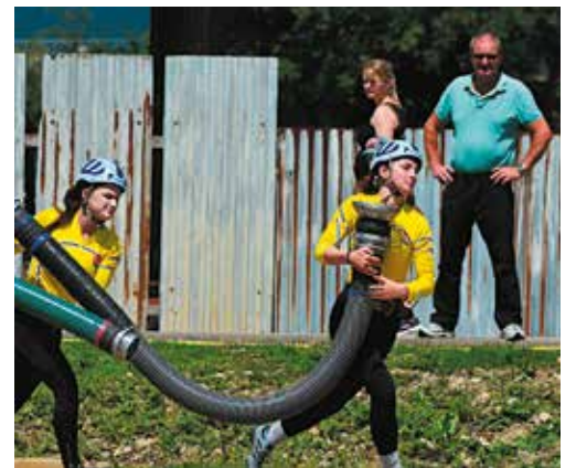
Kvašovčanky sú príjemným prekvapením tohto ročníka SMHL. Po desiatom kole sú tretie len s dvojbodovou stratou na druhú priečku.