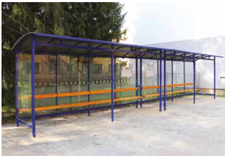
Prvá z dvoch nových zastávok MHD už stojí na Ulici 1. mája.