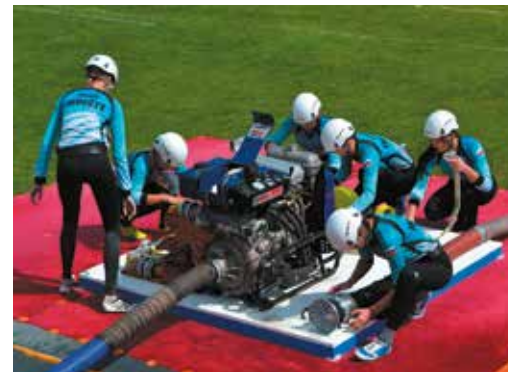
Ihrištanky sú po desiatom kole štvrté, boj o medailové priečky však nevzdali.