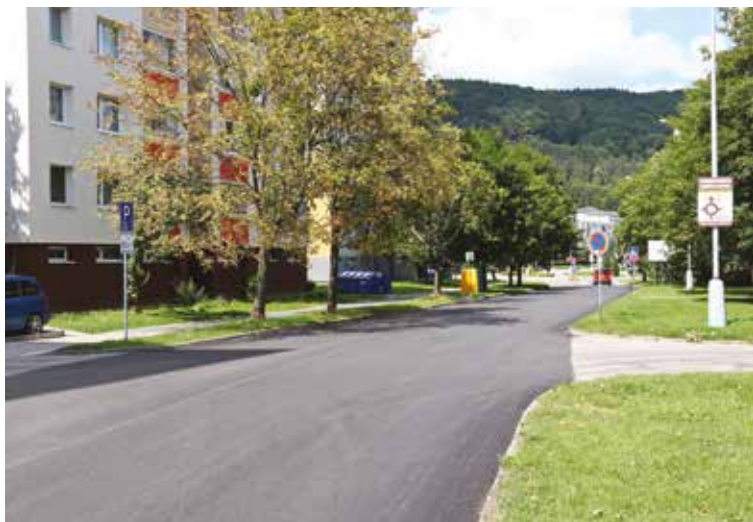
Rekonštrukcia cesty na Námestí slobody.

Mesto pokračuje s investičnými akciami aj počas leta. Ide o rekonštrukcie ciest a chodníkov, na Ulici 1. mája zrekonštruuje dve autobusové zastávky a zakúpilo nové auto mestskej polícii. Tohtoročnou novinkou sú brány s vodnou hmlou inštalované na pešej zóne (foto na titulke) a v Marczibányiho záhrade, ktoré slúžia na osvieženie okoloidúcich počas horúcich letných dní.