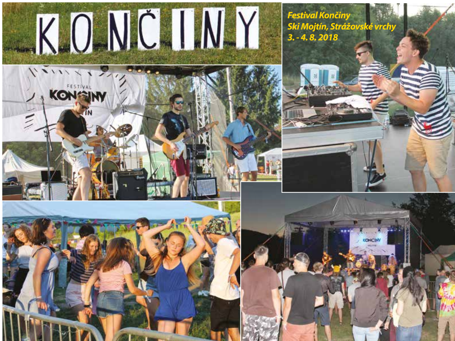
Festival Končiny Ski Mojtiň, Strážovské vrchy 3. - 4. 8. 2018