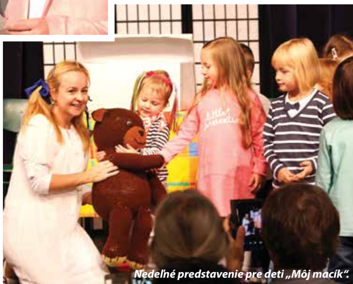
Nedelné predstavenie pre deti „Môj macík“.