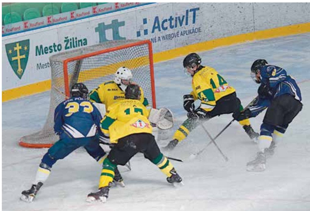
Dorastenci MŠK Púchov (v modrom) si počínajú v extralige nad očakávanie. Naplno bodovali aj minulý týždeň v dvojzápase v Žiline.