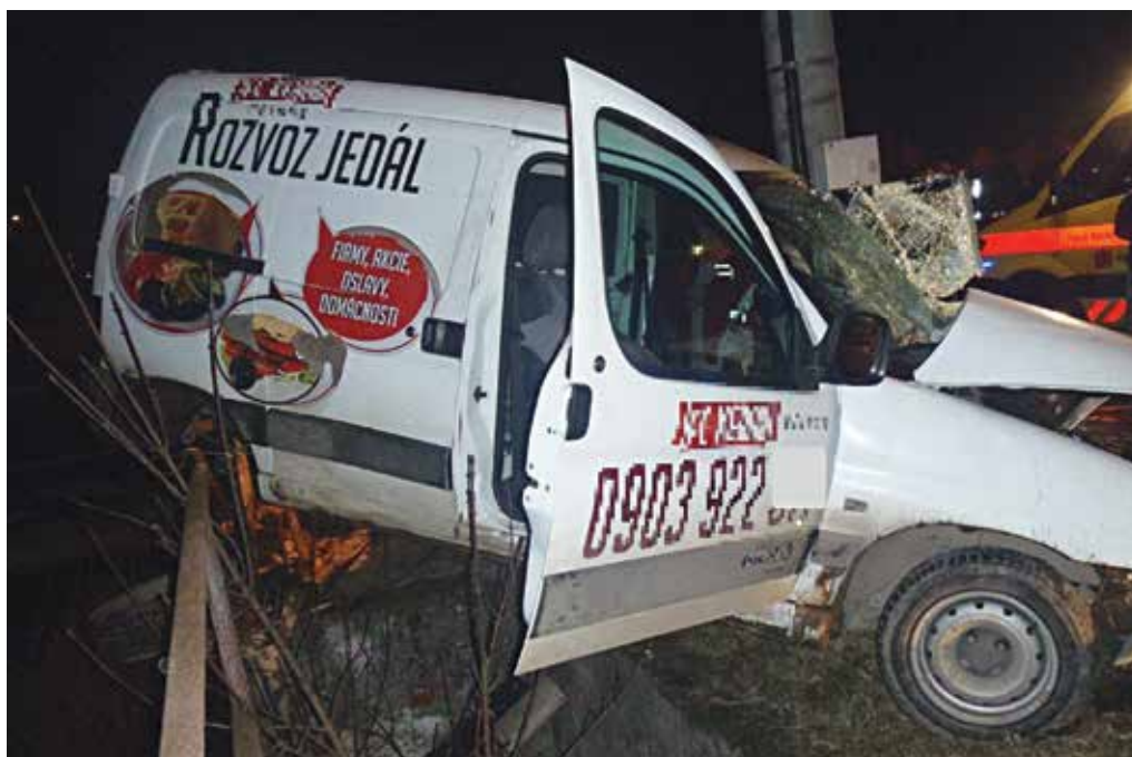
Nechýbalo veľa a automobil v Beluši by skončil v miestnom potoku.

Chorobnosť na akútne respiračné ochorenia sa v minulom týždni v okrese Púchov zvýšila na úroveň 1749 ochorení na 100.000 obyvateľov. Bola piata najvyššia v Trenčianskom kraji. V celokrajskom meradle klesla chorobnosť na akútne respiračné ochorenia na úroveň 1615 ochorení na 100.000, čo je takmer šesťpercentný pokles. Chrípková chorobnosť v Trenčianskom kraji sa v minulom týždni znížila o 19 percent. Najvyššia chorobnosť na respiračné ochorenia bola v Trenčianskom kraji v okrese Trenčín, najnižšia v okrese Považská Bystrica.