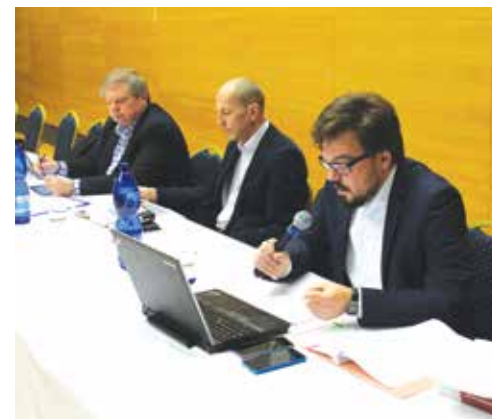
Návrh na vyhlásenie voľby hlavného kontrolóra predkladal vedúci organizačno-práv. oddelenia MsÚ Púchov R. Machan.

Písomnú prihlášku s požadovanými dokladmi je potrebné doručiť najneskôr 14 dní pred dňom konania voľby, t. j. do 10. 04. 2017 do 15:00 hod. (prihláška musí byť v danej lehote fyzicky doručená na Mestský úrad Púchov). Obálka musí byť zalepená a zreteľne označená textom „Voľba hlavného kontrolóra – Neotvárať“. Na prihlášky doručené po tomto termíne sa nebude prihliadať.