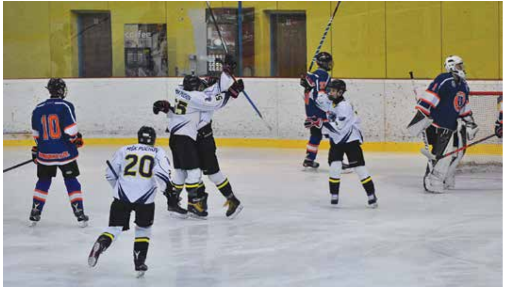
Dorastenci MŠK Púchov nevstúpili do finálovej série s Dubnicou šťastne. V prvom stretnutí doma tesne podľahli, v druhom však už nedali súperovi šancu.