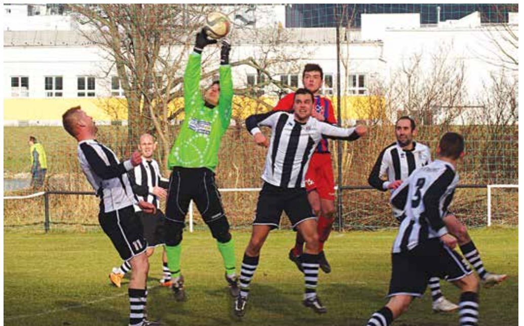
Najlepším hráčom Streženíc v okresnom derby piatej ligy s Horovcami bol brankár Hrišo (v zelenom drese). Ani on však nedokázal odvrátiť ďalšiu prehru.