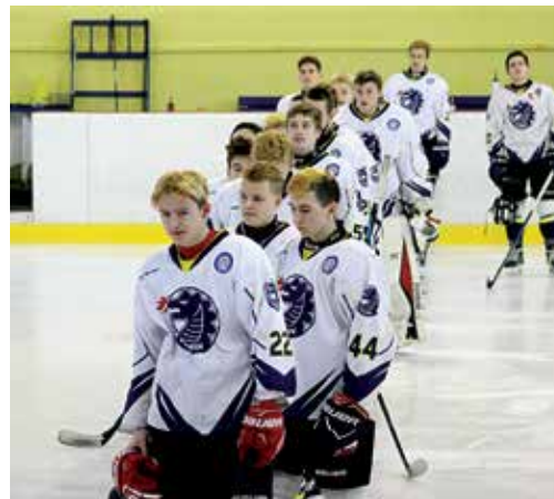
Po 20 rokoch prepisovali dorastenci MŠK Púchov históriu – vybojovali si postup do extraligy.