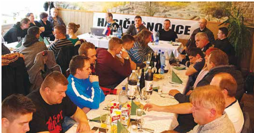
Delegáti jarného snemu SMHL rokovali v sobotu v Nosiciach.