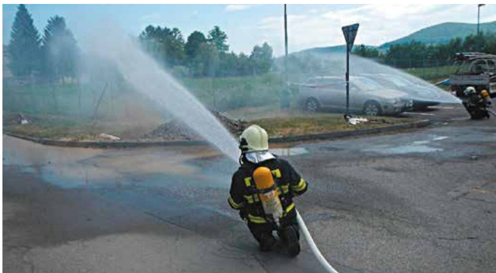
Ilustračná snímka KR HaZZ Trenčín

Na oddelenie MsP prijali telefonické oznámenie od muža, ktorý informoval, že zostal zavretý v železničnom vagóne na stanici v Púchove a nemôže sa dostať von. Mestskí policajti vzápätí telefonovali na železničnú stanicu. Tam ich informovali, že problém už vyriešili.