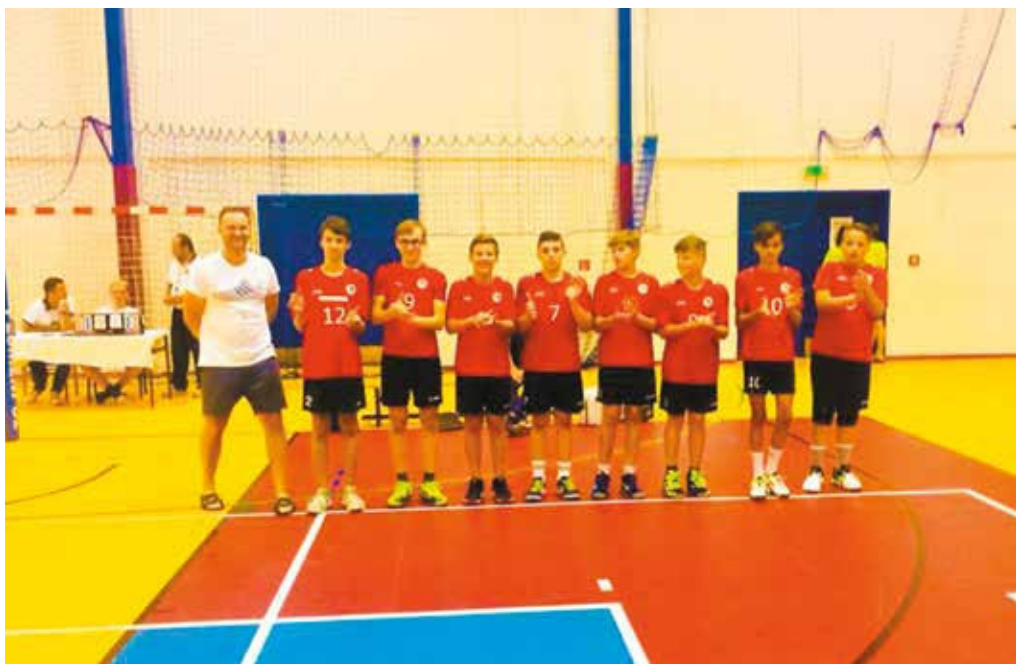
O skvelý výsledok sa postarali mladší žiaci U14 volejbalového klubu 1970 MŠK Púchov. Z majstrovstiev Slovenska priviezli strieborné medaily, keď siahali i na majstrovský titul.

V druhý hrací deň sme začali prvé semifinálové stretnutie s VK Junior 2012 Poprad, ktorý vyhral skupinu B. Len víťaz tohto zápasu mohol postúpiť do finále. Nezačali sme najlepšie a za stavu 6:4 pre VK Junior 2012 Poprad si tréner R. Pagáč zbral oddy-