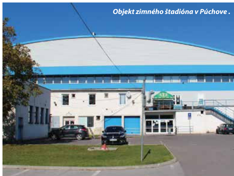
Objekt zimného štadióna v Púchove.

Pretože spor môže ešte pokračovať v rámci odvolacieho konania, nebudem teraz uvádzať podrobnosti mojej prípadnej argumentácie v konaní, ale z výsledku sporu je zrejme, že som vyvrátil všetky tvrdenia žalobcu a že moje argumenty za žalovanú stranu boli odborné, presvedčujúce a vedúce k úspechu v tomto náročnom konaní. Uvediem iba to, že som preukázal, že odstúpenie od podnájmovej zmluvy bolo zo strany HK Púchov neplatné, preukázal som, že