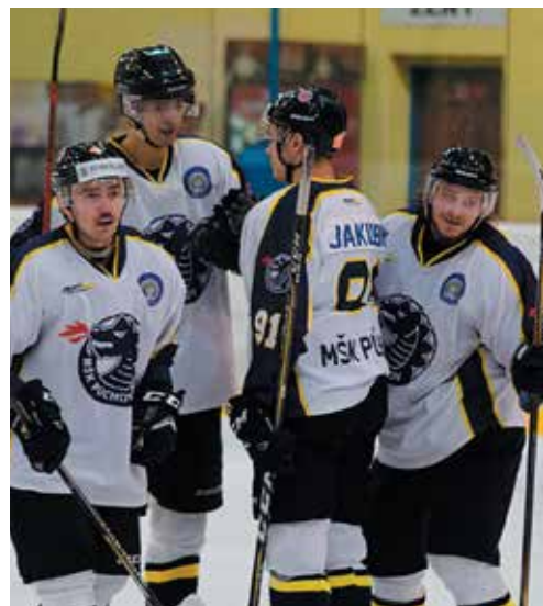
Takto sa Púčovčania z gólu tešili celkom sedemkrát.