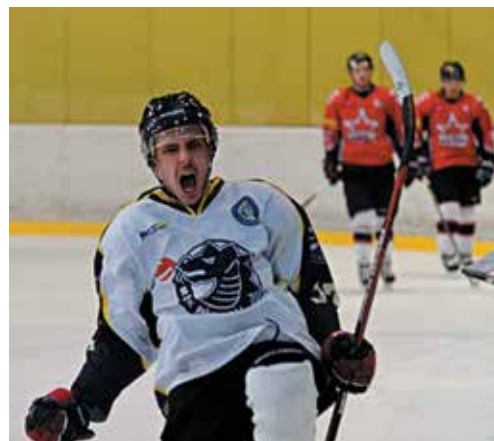
Zemkova radosť z gólu...