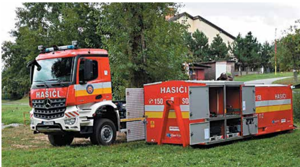
Nevyhnutnou súčasťou práce hasičov sú aj súčinnostné cvičenia a previerkové cvičenia. Len v októbri ich absolvovali v celom kraji devätnásť.

Na oddelenie mestskej polície sa telefonicky obrátila žena s tým, že na Spojovej ulici našla túlavého psa. Následne hliadke odovzdala hnedo-biele šteňa teriéra malého veku. Psík nemal obojok, bol bez vonkajších poranení a kontrola čipovania bola negatívna. Mestskí policajti umiestnili psa do koterca v areáli Podniku technických služieb mesta Púchov, priestupok proti všeobecne záväznému nariadeniu mesta je v riešení.