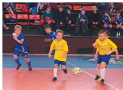
Futbalové talenty Lednických Rovní (v žltom) síce skončili na poslednej desiatej priečke, na ihrisku však nechali dušu, podobne, ako všetci ostatní.