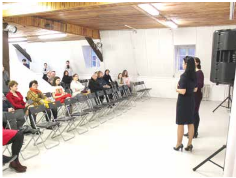
Primátorka na diskusnom fóre „Nastavme si spolu moderné mesto pre mladých.“