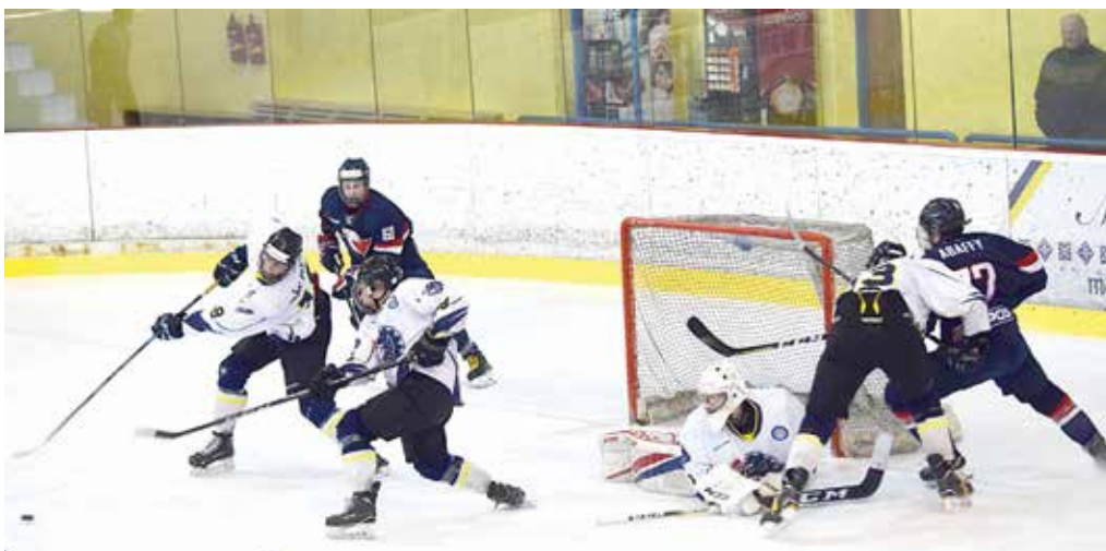
Dorastenci MŠK Púchov nenadviazali v dôležitom domácom súboji s Trenčínom na výkon v Bratislave pred týždňom (na snímke). Dve prehry ich zosunuli na piatu priečku.