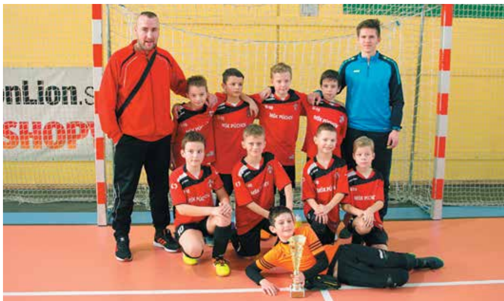
Prípravka MŠK Púchov B si vybojovala celkové prvenstvo na halovom futbalovom turnaji v Púchove. Na snímke mladí Púčovčania s trénerom, vedúcim mužstva a prestížnou trofejou.