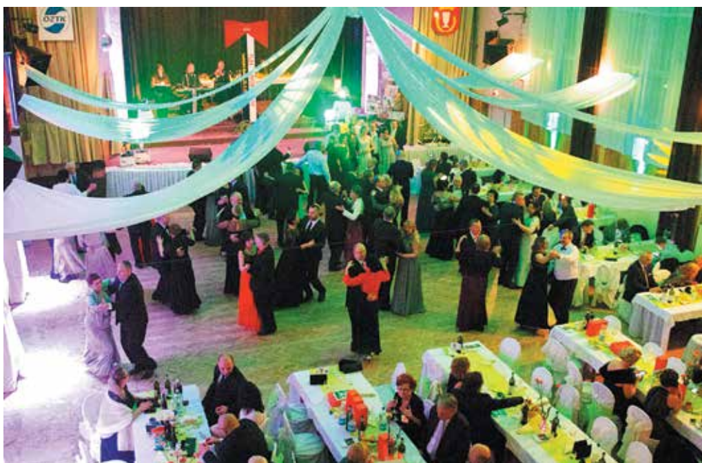
Ples športovcov spojený s vyhodnotením najúspešnejších športovcov oblasti privítalo už tradične kultúrne zariadenie spoločnosti RONA v Lednických Rovniach.