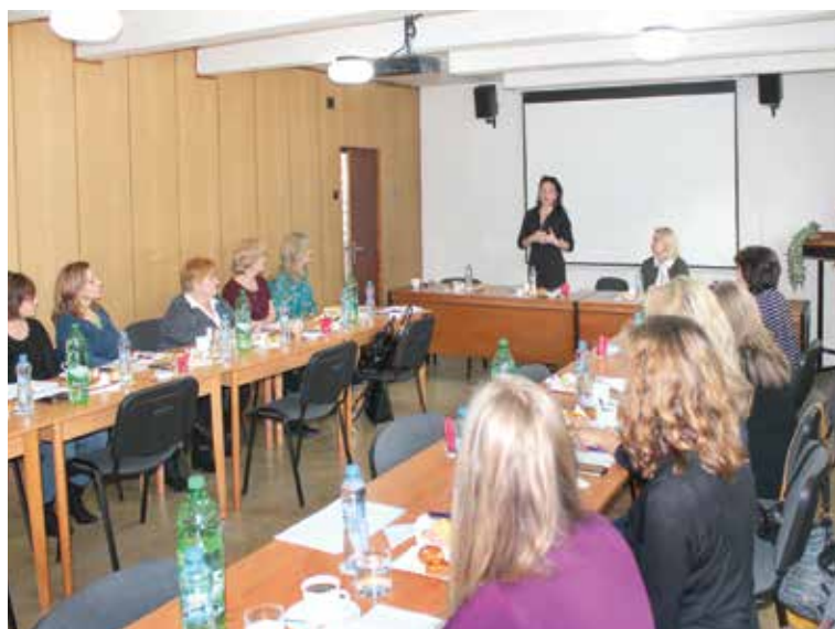
V Púchove rokovala Slovenská rada Združenia matrikárov a matrikárov Slovenskej republiky.