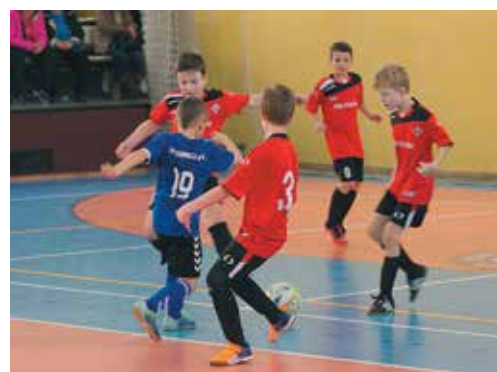
Finále prinieslo zaujímavý futbal so šťastnou koncovkou pre Púčovčanov.