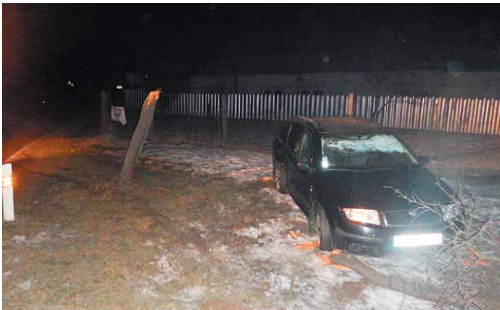
Vodička v Streženicach nezvládla riadenie a vyletela mimo cesty. Auto zlomilo strom.