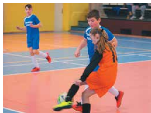
Belušania (v modrom) si napokon vybojovali piatu priečku.