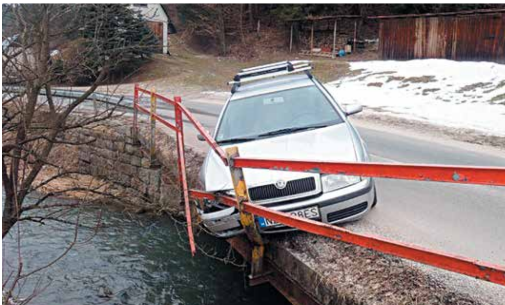
Len zábradlie delilo v Lazoch pod Makytou Octaviu od „vykúpania“ sa v potoku...

Chrípková chorobnosť v Trenčianskom kraji klesla o 25,15 percenta. V okrese Púchov nemuseli prerušiť školské vyučovanie. Zákaz návštev platí v nemocniciach v Ilave, Bojniciach, Handlovej a Partizánskom. (r)