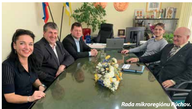
Rada mikroregiónu Púchov.

ských, kultúrnych a športových aktivít počas celého roka, bola som veľmi milo prekvapená, ako aktívne sa seniori na zaslúženom odpočinku snažia tráviť svoj voľný čas. Mesto Púchov ich aktivity podporovalo aj v minulosti a verím, že táto podpora a vzájomná spolupráca bude pokračovať naďalej, nechala sa počuť primátorka.