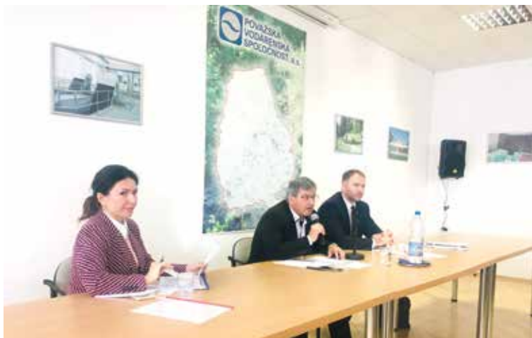
Valné zhromaždenie Považskej vodárenskej spoločnosti.