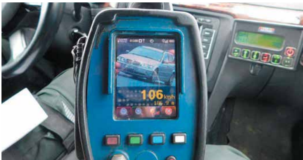
Cez Lysu pod Makytou sa mladý vodič rútil 106-kilometrovou rýchlosťou. Zaplatí 800 eur.