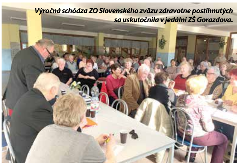
Výročná schôdza ZO Slovenského zväzu zdravotne postihnutých sa uskutočnila v jedálni ZŠ Gorazdova.