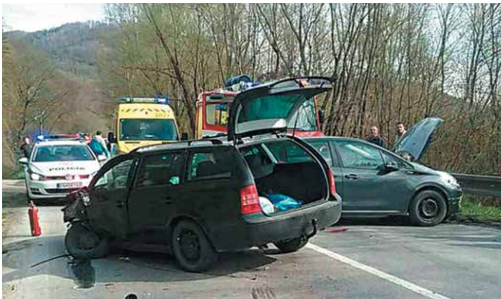
Dopravná nehoda, ktorá sa stala v nedeľu popoludní medzi Púchovom a Považskou Bystricou, si vyžiadala tri zranené osoby.

Z celkového počtu ochorení bolo 377 ochorení na chrípku. Chrípková chorobnosť v porovnaní s predchádzajúcim týždňom klesla o 23 percent. Chrípka v minulom týždni trápila v kraji najmä deti od šesť do 14 rokov. Pre chrípku nemuseli prerušiť školskú dochádzku v žiadnej škole a školskom zariadení v Púchovskom okrese, ani v celom Trenčianskom kraji. (r)