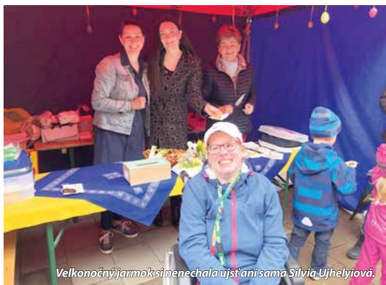
Veľkonočný jarmok si nenechala ujsť ani sama Silvia Ujhelyiová.