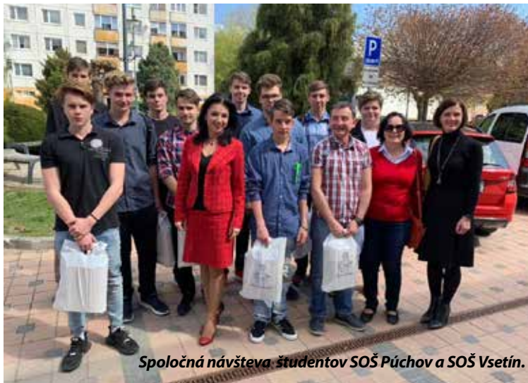
Spoločná návšteva študentov SOŠ Púchov a SOŠ Vsetín.