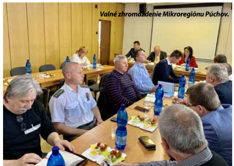
Valné zhromaždenie Mikroregiónu Púchov.