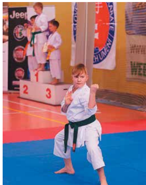
V nedeľu v Púchove nevychladlo ani tatami, ani stupeň víťazov....