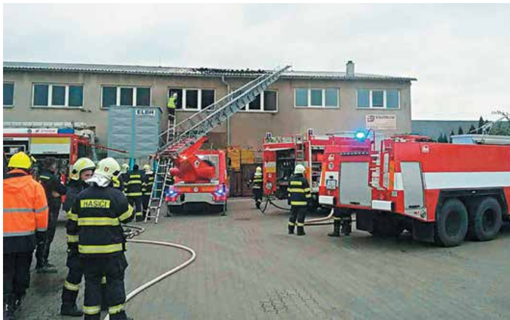
Požiar v objekte drevovýroby v Horovciach si vyžiadal nasadenie takmer 30 profesionálnych a dobrovoľných hasičov.

Z celkového počtu ochorení bolo 296 na chrípku. Chrípková chorobnosť v TSK klesla v porovnaní s minulým týždňom o 2,99 percenta. Pre chrípku museli prerušiť školskú dochádzku v jednej základnej škole v Trenčianskom okrese, v Púčovskom okrese si chrípka nevyžiadala žiadne opatrenia. (r)