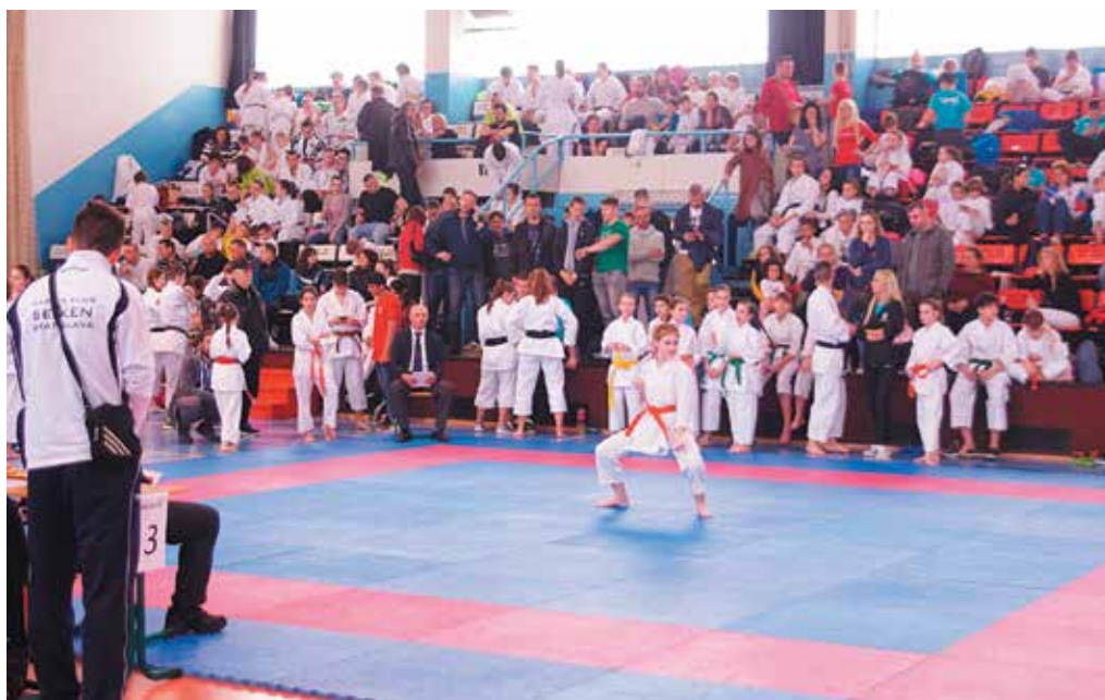
Púchovská volejbalová hala MŠK zažila v nedeľu zaťažkovú skúšku. Zaplnilo ju viac ako 550 karatistov všetkých vekových kategórií z celého Slovenska.