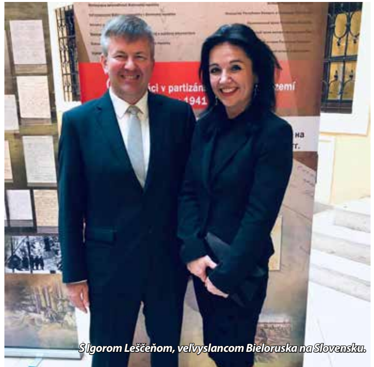
S Igorom Leščeňom, veľvyslancom Bieloruska na Slovensku.