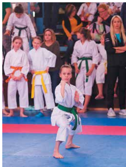
Pred porotou rozhodovali aj tie najmenšie maličkosti.

Keďže v Púchove sa v nedeľu súťažilo v niekoľkých desiatkach disciplín a vo všetkých vekových kategóriách, oficiálne výsledky boli známe až po uzávierke tohto čísla Púchovských novín. (pok)