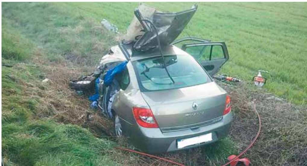
Ilustračná snímka: Prezídium HaZZ

Z celkového počtu ochorení nahlásili lekári v Trenčianskom kraji 133 ochorení na chrípku. Chrípková chorobnosť klesla v porovnaní s predchádzajúcim týždňom o 43,58 percenta. Pre chrípku nemuseli v Púchovskom okrese, ani v celom Trenčianskom kraji prerušiť vyučovanie v žiadnej škole a školskom zariadení. RÚVZ Trenčín