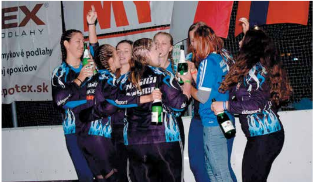
Žabky z Nosíc vlani skončili síce „až“ tretie, no aj z bronzu mali radosť.