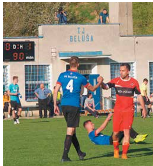
I keď išlo o veľa, šláger sa hral vzácné v duchu fair play. Po zápase nechýbali takéto momenty.