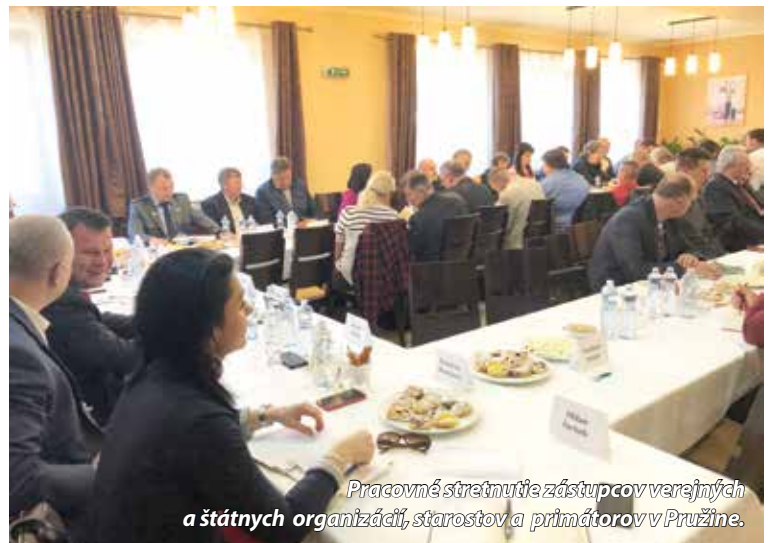
Pracovné stretnutie zástupcov verejných a štátnych organizácií, starostov a primátorov v Pružine.