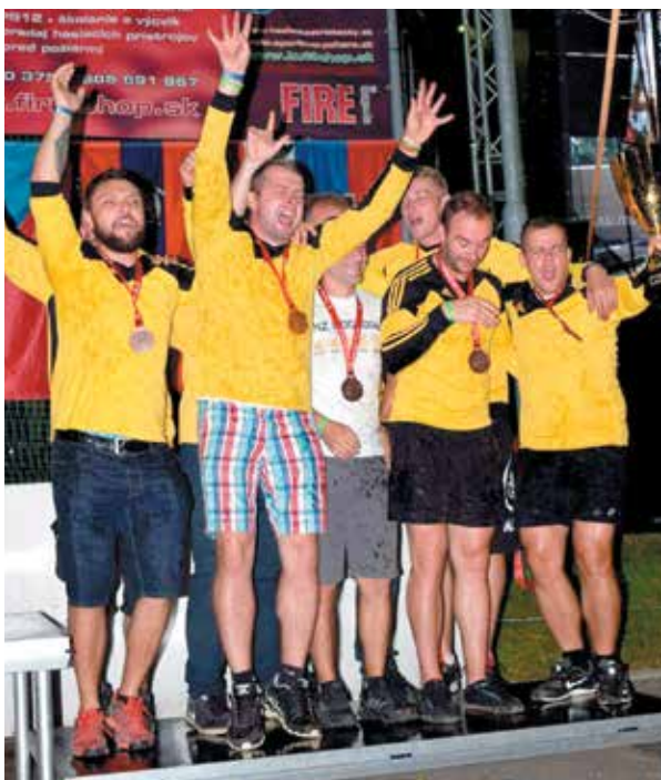
Podhorania budú chcieť tento rok útočiť na prvenstvo.

Schválený kalendár Slovensko-moravskej ligy má