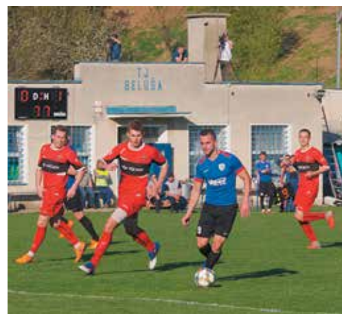
Najmä v druhom polčase museli Púčovčania čeliť domácejmu tlaku. Poradili si s ním však bezchybne.

MŠK Púchov – FC Nitra B (28. 4. o 16.00), Šaľa – Beluša, Nové Zámky – Galanta, Trnava B – V. Ludince, L. Rovne – P. Bystrica, Malženice – Nové Mesto, Zlaté Moravce B – Gabčíkovo, Kalná má voľno. (pok)