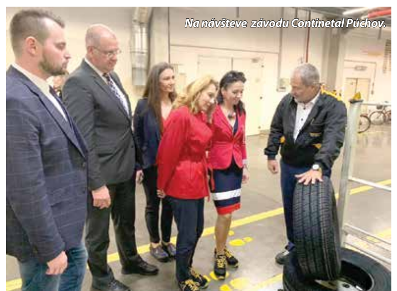
Na návšteve závodu Continental Púchov.