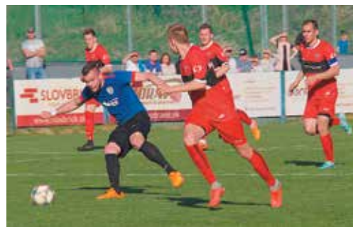
Sporadické úniky likvidovala púčovská obrana ešte pred pokutovým územím.