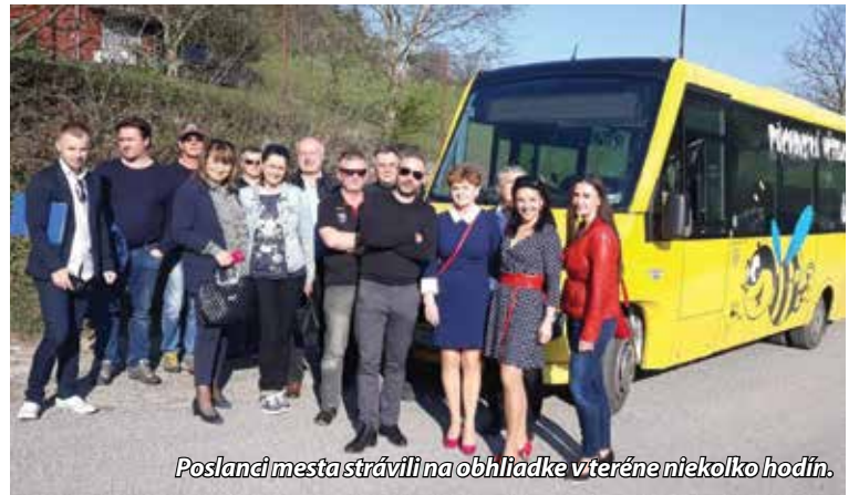
Poslanci mesta strávili na obhliadke víťeréne niekoľko hodín.