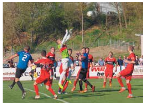
Belušania sa pokúšali prekonať spoľahlivú obranu Púčovčanov (v červenom) najmä centrami po štandardných situáciách. V pokutovom území však vládol brankár MŠK Pilný.