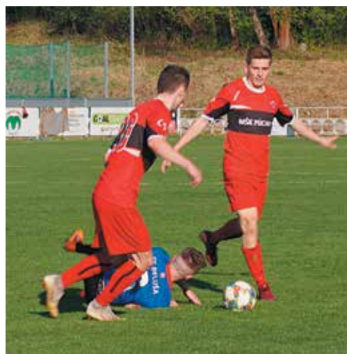
Obrana i stredová formácia Púchova bola dôrazná. Zátky však neprekročili hranicu fair play.

Gól: 58. Krčula, ŽK: Janček (Beluša), rozhodovali: Santa, Krivošík, Fodor, 700 divákov Šláger, derby i zápas jari – aj také prívlastky niesol treťoligový duel medzi lídrom z Beluše a druhým Púchovom. Po opatrnom začiatku sa pred peknou návštevou na oboch stranách zrodilo niekoľko príležitostí, bolo však poznať, že obe mužstvá chcú v prvom rade neinkasovať. Úvod druhého polčasu priniesol trochu viac oživenia a v 58. minúte Púčovčania jasný gól Krčulu. Po góle sa Púčovčania stiahli pred svoje pokutové územie a bez väčších problémov zachtávali útoky Belušanov. Tí to skúšali napopávanými loptami do pokutového územia, Pilný v bránke Púchova však malé vápno ovládal dokonale. Hostia v druhom polčase dokázali zachtávať lopty už za poliacou čiarou a podnikali nebezpečné kontry do otvorenej domácej obrany. Dve – tri sľubné príležitosti však zneškodnil domáci brankár Vangel. V závere nedovolil hostujúci tréner vygradovanie