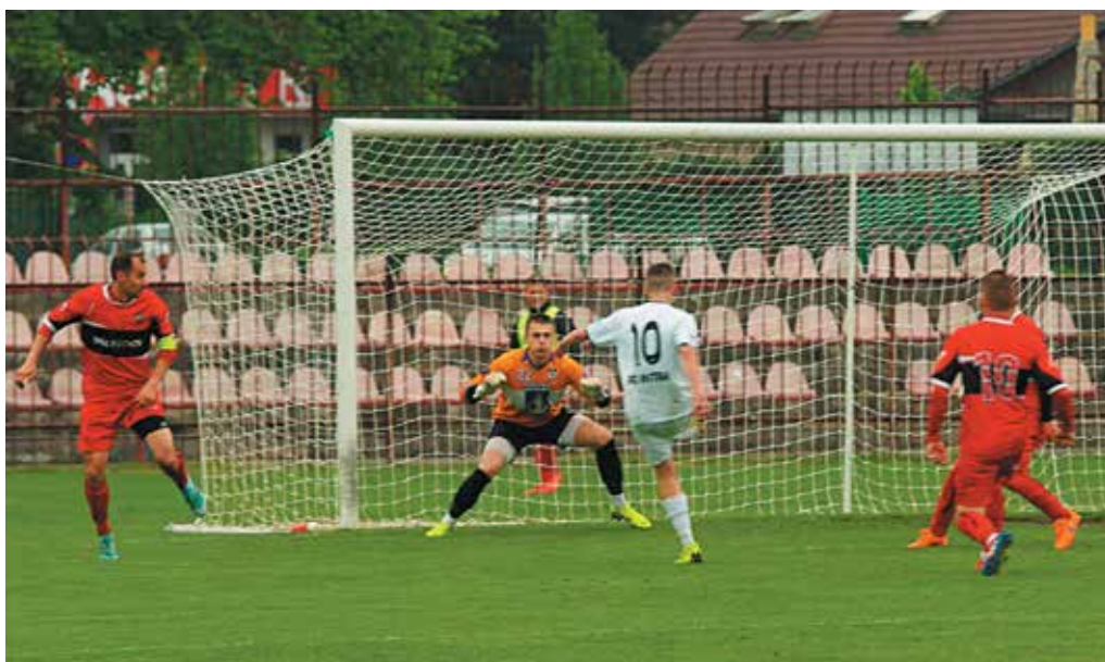
Púchovský brankár Pilný v tomto prípade ešte strelu Vrábľa vyrazil, proti dorážke Fabiša bol však bezmocný. Rezerva Nitry vyrovnala na 1:1.