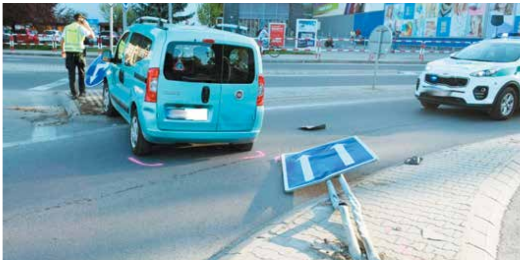
Ilustračná snímka: KR PZ Trenčín

Z celkového počtu ochorení nahlásili lekári 149 ochorení na chrípku, chorobnosť v porovnaní s predchádzajúcim týždňom klesla o 2,90 percenta. Pre chrípku nemuseli tento týždeň prerušiť školskú dochádzku v žiadnej škole a školskom zariadení v okrese Púchov, ani v celom Trenčianskom kraji. (r)