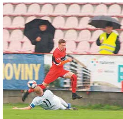
Futbalisti nitrianskej juniorky dávali Púchovčanom minimum času na rozohratie a aktívnym napádaním získali mnoho lôpt už na polovici súpera.