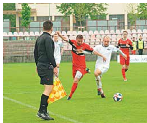
Za stáleho mrholenia bol súboj s rezervou Nitry bojom o každú piad' hracej plochy...