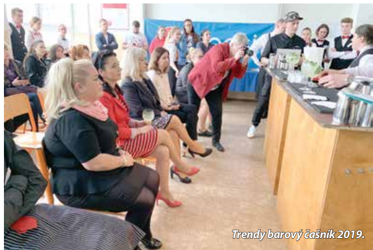
Trendy barový čašník 2019.

OTVORENÁ RADNICA: každá streda od 15.00 do 17.00 vyčlenená na osobné stretnutia primátorky Púchova s občanmi. Tel. 0918 864 519, asistent@puchov.sk