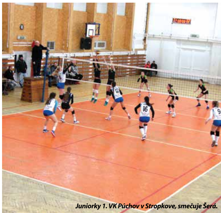
Juniorky 1. VK Púchov v Stropkove, smečujú Šerá.