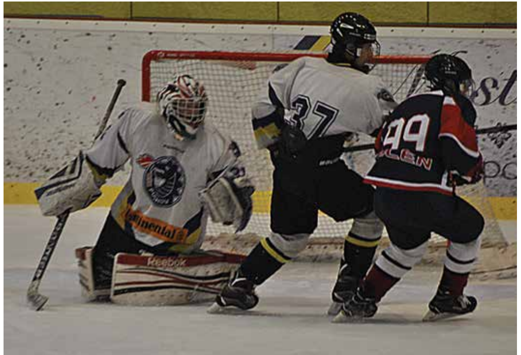
Kadeti MŠK Púchov (v bielych dresoch) v šlágrí nadstavby play out dvakrát zvíťazili v Nitre a vyhupli sa do čela tabuľky.

Góly MŠK: 21. Moravanský (Huba), 36. L. Halušková