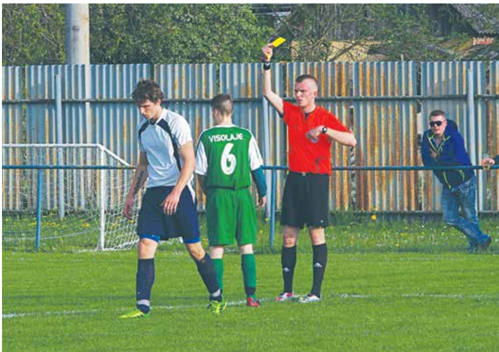
Zimná prestávka býva tradične prípravou nielen pre futbalové mužstvá, ale aj pre rozhodcov oblastných futbalových súťaží. Okrem seminára ich ešte pred jarňou výkopom čakajú skúšky.