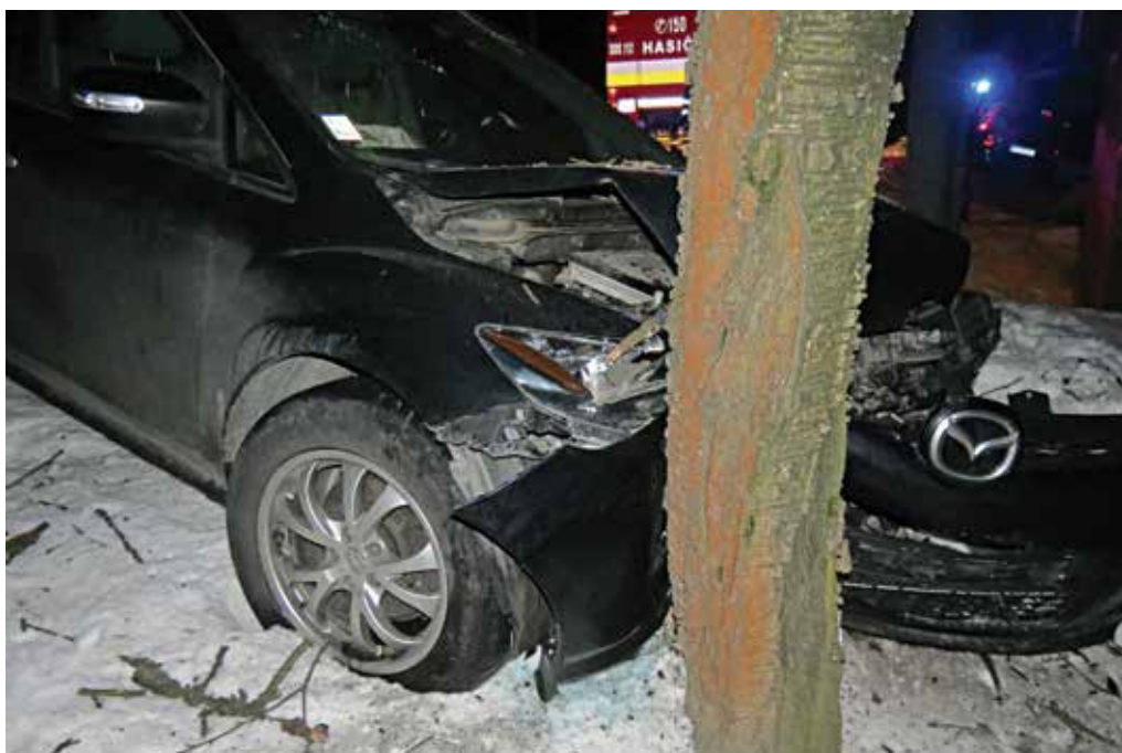
Nepozornosť vodiča bola príčinou dopravnej nehody vo Vieske-Bezdedove.