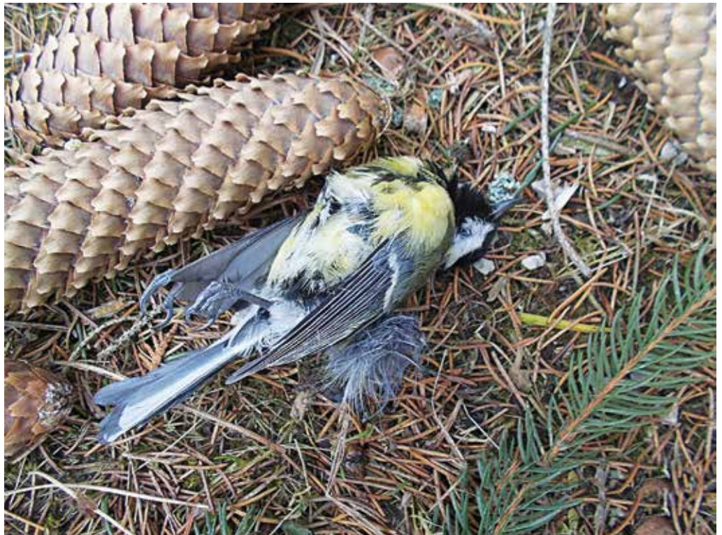
Nález uhybnutej sýkorky vyvolal u Púchovčanky obavu, že by mohla byť nakazená vtáčou chrípkou. Sýkorku odovzdala mestským policajtom, tí ju následne odovzdali veterinárovi.

Púchovčanka sa obrátila na mestskú políciu s tým, že jej sused vyložil v blízkosti jej rodinného domu hnoj, čo ju obťažuje. Informovala tiež, že sa obrátila na odbor životného prostredia, kde ju odporučili na mestskú políciu. Hliadka zistila, že sused vyložil jeden fúrik hnoja na svojom pozemku, ktorý bol od pozemku sťažovateľky oddelený plotom. Sťažovateľke prekázalo, že je to v blízkosti jej domu. Sused choval hospodárske zvieratá a hnoj používal na hnojenie svojej záhrady. Mestskí policajti nezistili žiadne protiprávne konanie, z miesta na žiadosť sťažovateľky urobili fotodokumentáciu a žene odporučili, aby sa obrátila na Odbor životného prostredia okresného úradu.