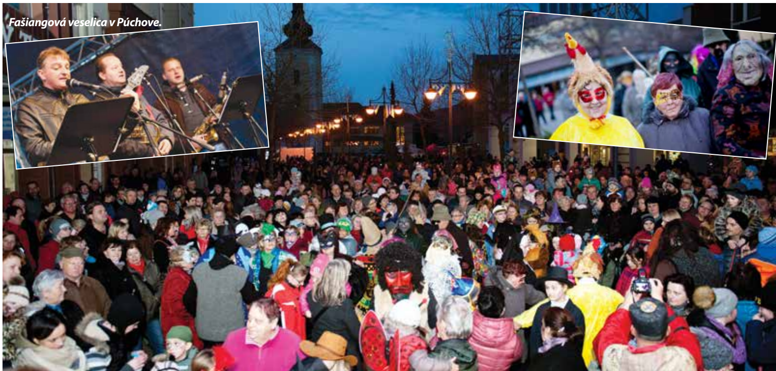
Fašiangová veselica v Púchove.