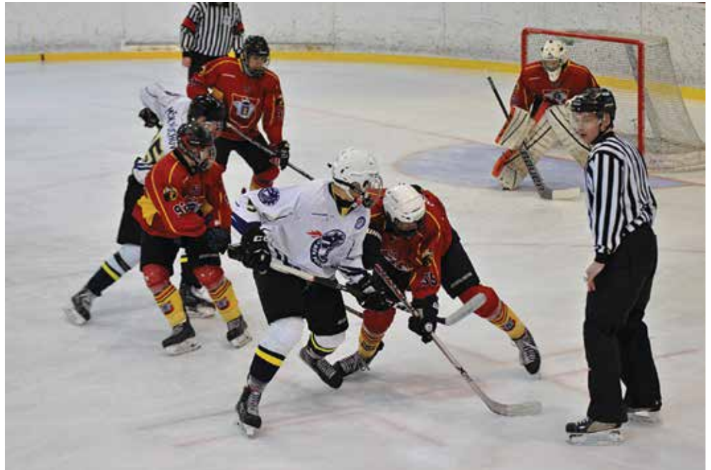
Dorastenci MŠK Púchov (v bielom) si v semifinálovej play-off poradili s Topoľčanmi v troch zápasoch. Po víťazstve v sérii 3:0 ich čaká vo finále play-off Dubnica nad Váhom.