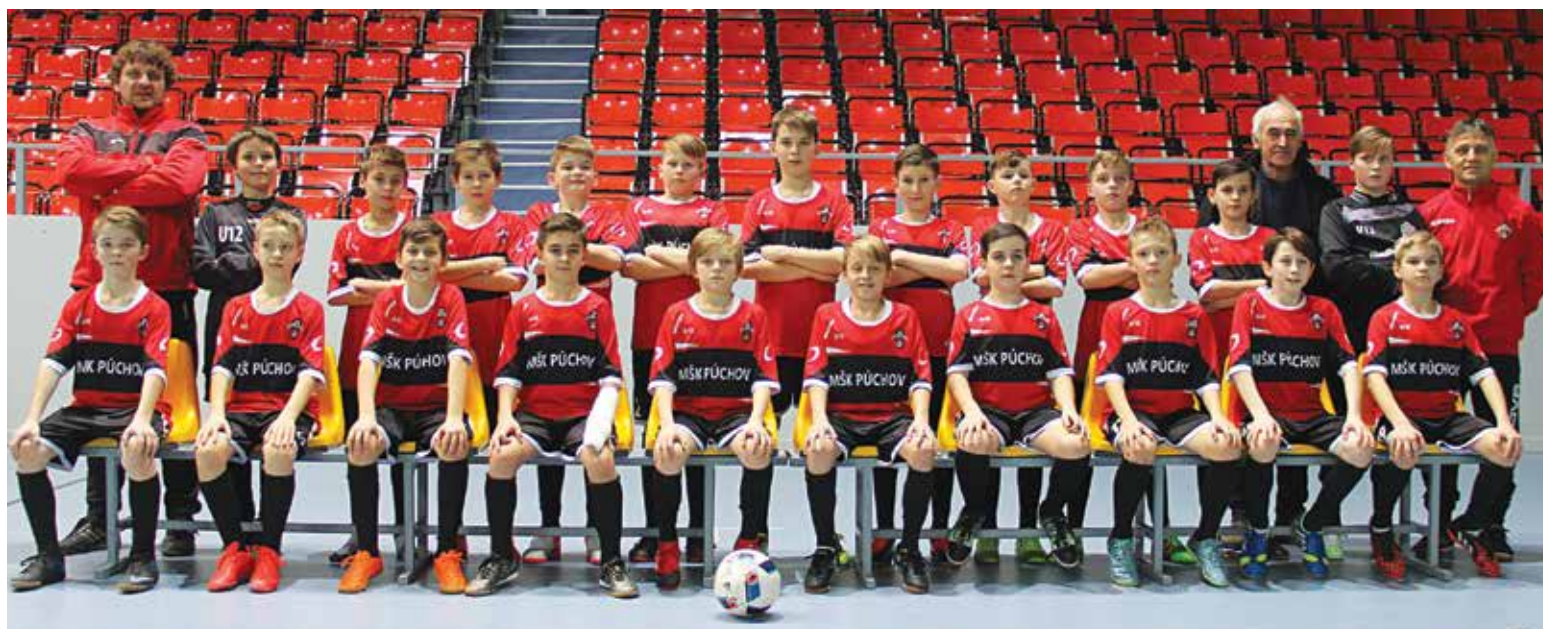
Mladší žiaci MŠK Púchov U12 spolu s realizačným tímom.