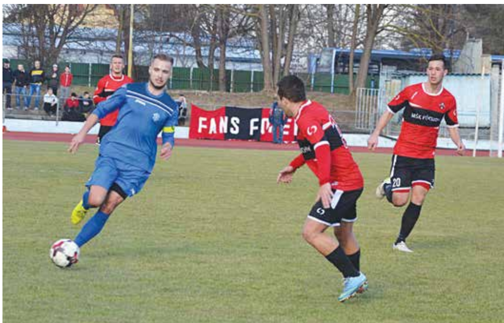
V oblastnom tretíligovom derby si Púchovčania (v červených dresoch) priviezli z Dubnice nad Váhom iba bod.

Zostava Dubnice: Digaňa – Zahranýčnyj, Janco