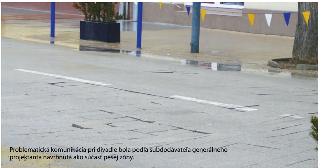
Problematická komunikácia pri divadle bola podľa subdodávateľa generálneho projektanta navrhnutá ako súčasť pešej zóny.