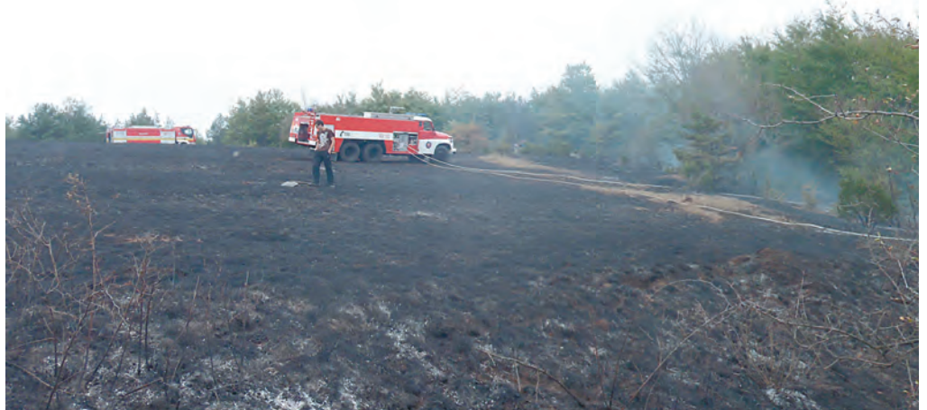
Aj takéto dôsledky môže mať plošné vypaľovanie tráv a porastov.

Na oddelenie MsP priniesol muž z Nitry fenu čivavy, ktorú našiel na Štefánikovej ulici. Pes mal popruhu a samonavíjacie vodítko. Asi o hodinu prišla na oddelenie MsP žena z Púchova, ktorá podľa vlastných slov mala problémy s bankomatovou kartou a v strese psa zabudla pri bankomate.