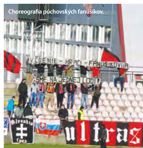
Choreografia púchovských fanúšikov.