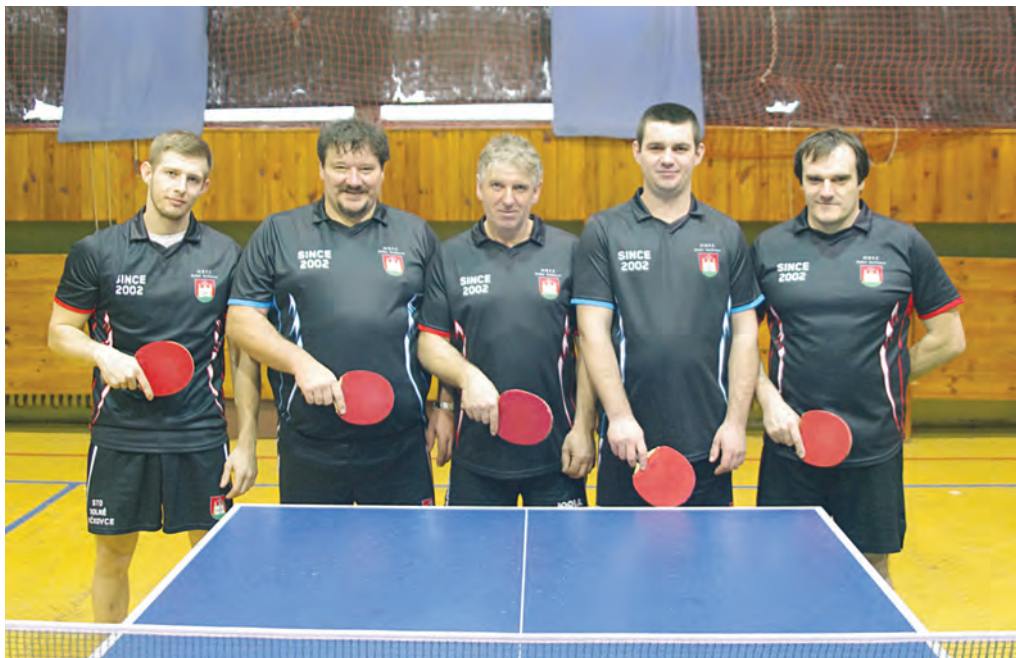
Senzačné ťaženie nováčika 4. stolnotenisovej ligy završili stolní tenisti Slovana Dolné Kočkovce historickým postupom do 3. ligy. V sobotu im k tomu stačilo zvíťaziť za stolmi poslednej Nitrice. Ani prípadná prehra v záverečnom kole v Trenčíne ich už o víťazstvo v súťaži pripraviť nemôže.