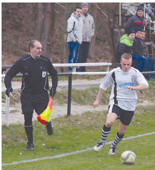
Streženičanom bojovnosť uprieť nemožno. Na body to však v nedeľu nestačilo...