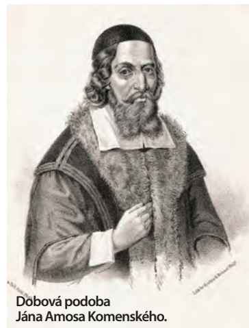
Dobová podoba Jána Amosa Komenského.

vo t ných p r o b l é - m o c h v s p o l o c n o s t i s v o j e j t r e t e j z e n y J a n y ( p r v é d v e z o m r e l i ), s y n a D a n i e l a , p r i a t e l a , l e k á r a M i k u l á š a T u l p a d ň a 1 5 . n o v e m b r a 1 6 7 0 . B o l p o c h o v a n ý v k o s t o l i k u