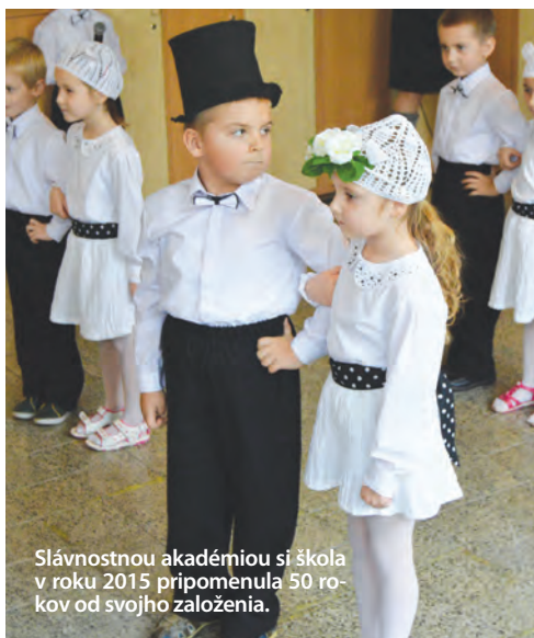
Slávnostnou akadémiou si škola v roku 2015 pripomenula 50 rokov od svojho založenia.

Učiteľom umožňujeme naďalej, aby sa po odbornej aj profesionálnej stránke vzdelávali, aby dosiahli vyššiu odbornosť hlavne v oblasti IKT, ktorú využijú vo vyučovacom procese. Skvalitňujeme spoluprácu s rodičmi, s inštitúciami, ktoré podporujú vzdelávanie, s ostatnými školami v regióne.