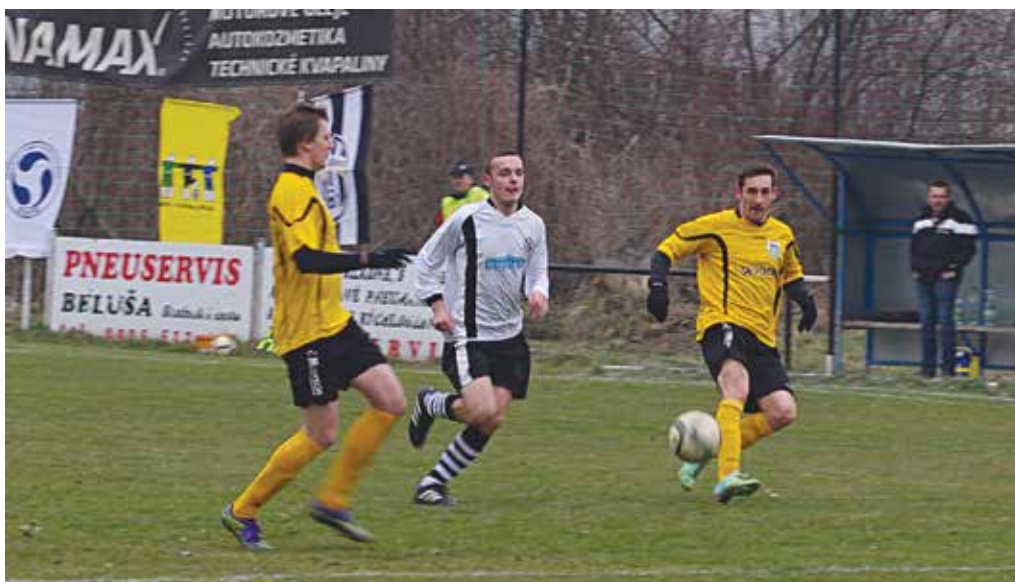
Streženičania (v bielom) dokázali v dohrávke doma poraziť rozdielom triedy Zemianske Kostolany a vyhrali aj v Malej Hradnej. V tabuľke sa posunuli už na siedme miesto.

Kolačín odstúpil zo súťaže a jeho výsledky boli anulované