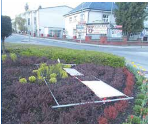
Provizórne kovové oplotenie si našlo svoje miesto v okrasnej zeleni.

Hliadka mestskej polície pristihla predpoludním na Moravskej ulici ženu zo Serede, ktorá sa dopustila priestupku nepovoleným vykonávaním zárobkovej činnosti. Mestskí policajti ju najskôr vyriešili napomínaním. Žena sa nepoučila a napriek napomínaniu pokračovala v pokútnom predaji. Hliadka ju prichytila aj popoludní po tom, ako na ženu upozornili telefonicky obyvatelia Púchova. Predviedli ju na oddelenie mestskej polície, kde jej po vysvetlení uložili pokutu vo výške 30 eur.