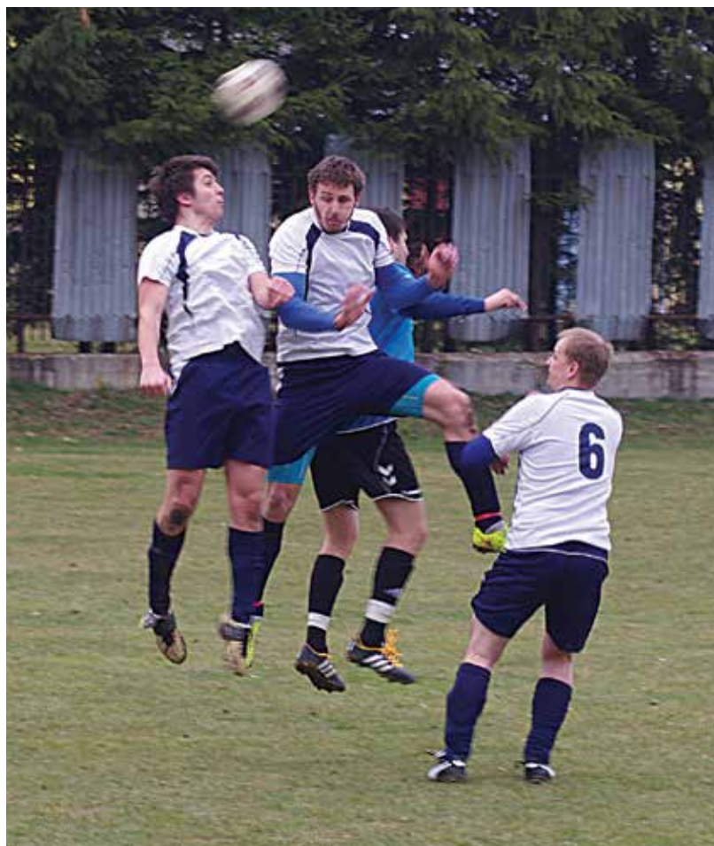
Futbalisti Lysej pod Makytou (v bielom) si na domacom trávniku zaknihovali cenné víťazstvo nad predposlednou Jasenicou. Poriadne sa naň však natrápili...