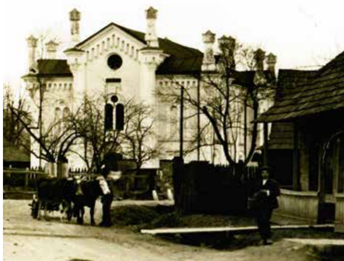
Nemci pri ústupe zničili i synagógu v Lúkach.

(pokračovanie v ďalšom čísle Púchovských novín)