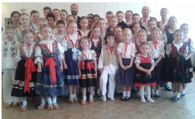
Na krajskú prehliadku programov Zborov pre občianske záležitosti postúpili oba súťažné - z Dohňan aj Lysej pod Makytou.