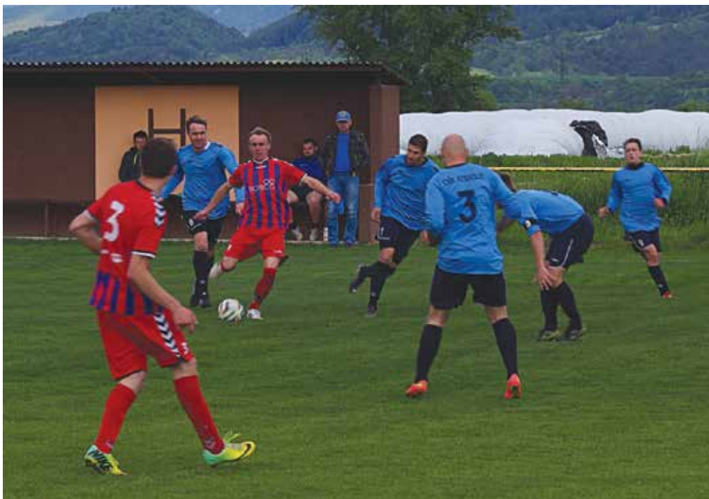
Futbalisti Podolia (v modrých dresoch) „zabetónovali“ priestor pred svojim pokutovým územím a domáci Horovčania nedokázali skórovať. Horovce tak doma prehrali 0:1.