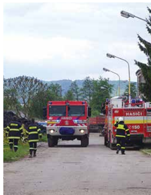
V Hloží v nedeľu zasahovalo takmer 60 hasičov s 27 kusmi hasičskej techniky.

ring ovzdušia s tým, že počas monitoringu neboli namerané žiadne hodnoty, ktoré by prekročovali povolené limity. Pri udalosti nebol nikto zranený, požiar