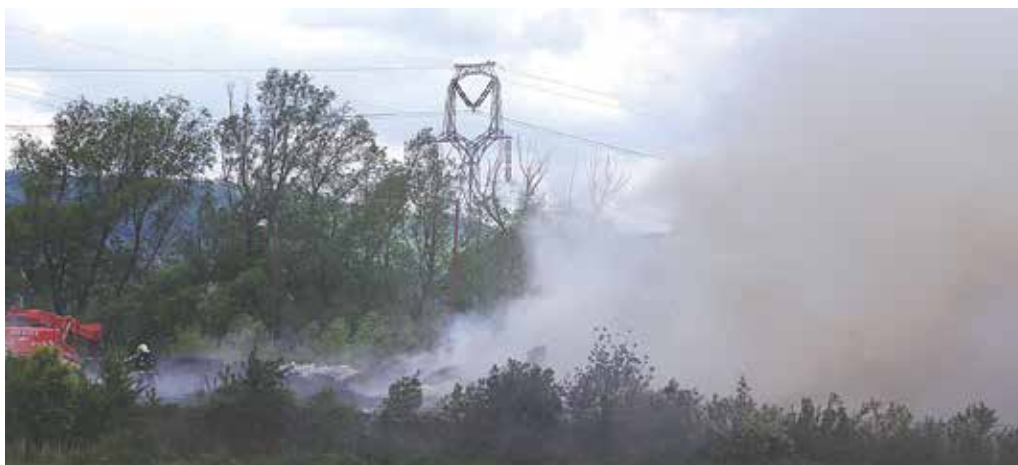
Požiar starých pneumatík v Hloží poriadne vystrašil Belušianov. Dym našťastie obyvateľov neohrozil.

„Pracovníci Kontrolného chemického laboratória zo Slovenskej Ľupče vykonávali na mieste monito-