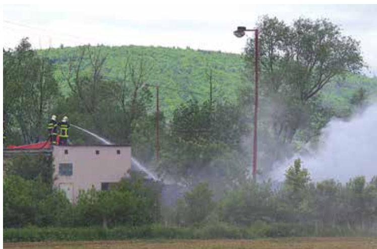
Po lokalizácii požiaru hasiči ešte dlhé hodiny rozhrňali pomocou špeciálnej techniky penuamtky a doháľali taviacu sa gumovú hmotu.

ring ovzdušia s tým, že počas monitoringu neboli namerané žiadne hodnoty, ktoré by prekročovali povolené limity. Pri udalosti nebol nikto zranený, požiar