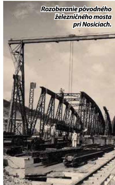
Rozoberanie pôvodného železničného mosta pri Nosiciach.

ženiu celého úseku Považskej železnice medzi PU a PB. Uvažovalo sa nad tromi alternatívami vedenia vlakovej dopravy. Z ekonomických a technických dôvodov sa nakoniec pristúpilo k preloženiu železničnej trate tak, aby obchádzala vzdutú hladinu vodného diela, čím sa trať predĺžila o cca 2 km. Pôvodné mosty cez rieku boli demontované. Kvôli rôznym problémom, ako bol napr. nedostatok pracovných síl, zrážka mechanizmov na trati a podobne, sa železničnú trať podarilo sprevádzkovať medzi PU a PB až v januári 1958. Plánovaná rekonštrukcia železničnej trate v úseku PU - Považská Teplá sa má v blízkej budúcnosti priblížiť pôvodnej trase Považskej železnice. V jej úseku sú naprojektované dva nové tunely. -pam-