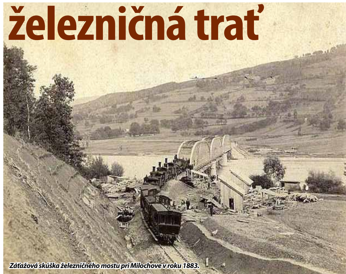
Zátážová skúška železničného mostu pri Milochove v roku 1883.

Úsek TT – Nové Mesto nad Váhom (NM) bol daný do prevádzky 2. júna 1876. Výstavba úseku medzi NM a TN s dĺžkou 22,4 km bola uvedená do prevádzky po Zlatovce už 1. mája 1878. Posledný úsek trate medzi TN a ZA dostala postaviť firma Hügel, Sager a spol. so sídlom v TN. Plán bol vypracovaný od roku 1880. Stavba sa kvalifikovala ako stredne ťažká, jej celková dĺžka bola 80,776 km, pričom viac ako 55 km viedlo v stúpaní, 2,76 km v klesaní a 22,5 km po rovine. Maximálne stúpanie dosahovalo 6,66 promile. Okrem priepustov a menších stavieb ležali na trati aj 3 mosty cez Váh. Pri Nosiciach a Milochove to boli mosty o svetlosti 3 x 60 m. Celkovo sa v tomto úseku položilo 20 890 koľajníc