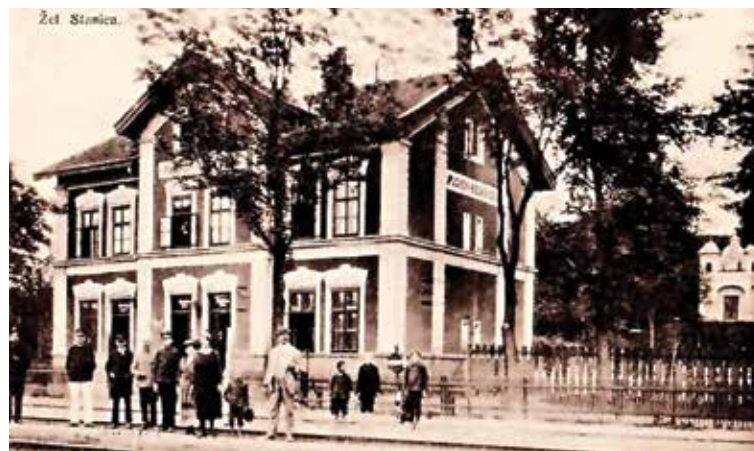
Pôvodná budova železničnej stanice v Púchove z roku 1883, ktorá nedávno ustúpila rekonštrukcii železničnej trate.