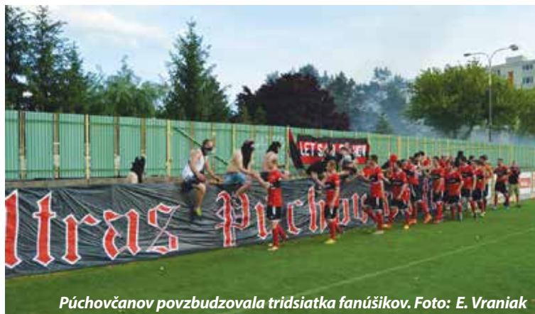
Púchovčanov povzbudzovala tridsiatka fanúšikov.

FC Baník HN Prievidza&Handlová – MŠK Púchov 1:2 (0:0)