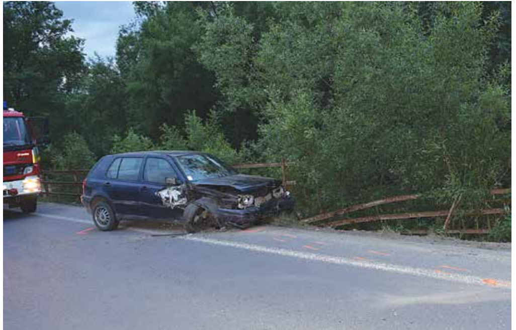
Pádu automobilu do Bielej vody zabránilo zábradlie. Vodičovi namerali 1,6 promile.

Hliadka mestskej polície preverovala telefonické oznámenie, podľa ktorého na Royovej ulici v dôsledku demolačných prác dochádza k zvýšenej prašnosti. Podľa oznámenia tam robotníci zhadzovali stavebný odpad na nákladný automobil bez toho, aby používali opatrenia na zníženie prašnosti. Hliadka na mieste nadmerné prašenie nezistila, traja robotníci, ktorí sa podieľali na demolačných prácach žiadnu suť nezhadzovali. Podľa vlastných slov čakali na vodára, ktorý mal polievať stavebný odpad za účelom zníženia prašnosti.