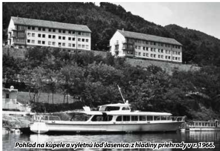
Pohľad na kúpele a výletnú loď Jasenica z hladiny priehrady v r. 1966.