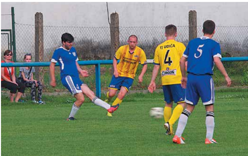
Kým v minulom týždni si futbalisti Dolných Kočkoviec (v modrom) vybojovali doma bezproblémové víťazstvo, v nedeľu v derby doťahovali na konečnú remízu v Lysej.