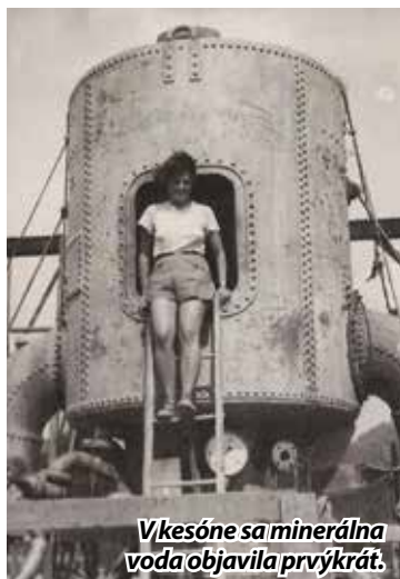
V kesóne sa minerálna voda objavila prvýkrát.