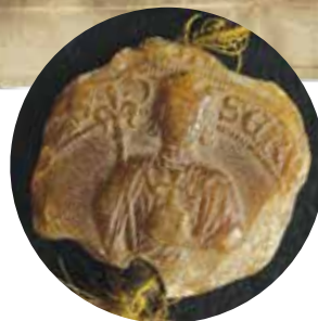
Podoba uhorského kráľa Bela IV. na pečatí k listine, ktorú vydal a kde je prvýkrát písomne spomínaný Púchov.