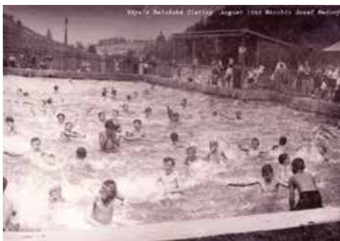
Radosť detí v kúpeľnom bazéne v roku 1946.

MOŽNOSŤ ODBERU PÚCHOVSKÝCH NOVÍN: Okrem poštových schránok domácností nájdete pravidelne Púchovské noviny na týchto verejne dostupných distribučných miestach, kde sú voľne k odberu: