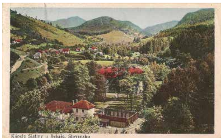
Celkový pohľad na Kúpele Belušké Slatiny v roku 1924.

Počas vojny, v r. 1916, tu Vojenská správa zriadila vo veľkej kúpeľnej budove vojenskú nemocnicu pre 100 ranených a chorých vojakov, no dovtedy najväčší vojenský konflikt v