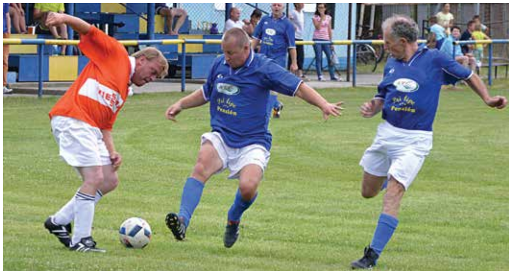
V súboji o tretie miesto si Lysá poradila s domácimi Dohňami 4:0.

Ženy: 1. Nosice-žabky – 34 bodov, 2. Ihrište – 32 bodov, 3. Dežerice – 29 bodov, 4. Ladce – 24 bodov, 5. Dohňany – 22 bodov, 6. Svinná – 16 bodov. (pok)