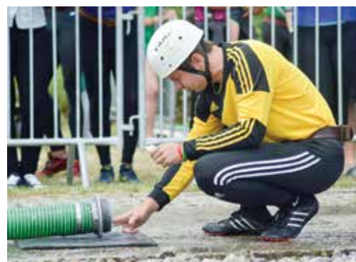
Pred útokom treba dotiahnuť každý detail. Podhorania nenechali v Lednických Rovniach nič na náhodu a skvelým časom zvíťazili. Po druhom mieste v Zbore si udržali post lídra aj po piatom kole Slovensko-moravskej hasičskej ligy.

Celkové poradie: 1. Oswiecim, 2. Streženice, 3. Lysá pod Makytou, 4. Dohňany. (r)