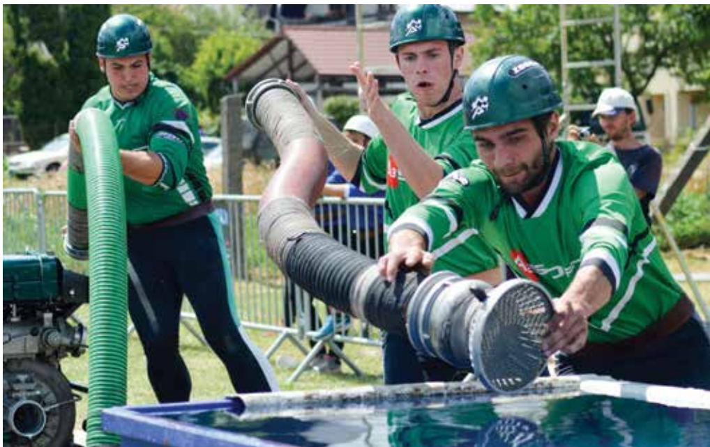
Favorizovaní Zborania v Horenickej Hôrke vyhoreli a útok nedokončili. Aspoň čiastočne sa rehabilitovali tretím miestom v sobotňajších domácich pretekoch.

Muži: 1. Podhorie (13,72 s), 2. Brumov B (13,78), 3.