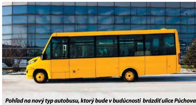
Pohľad na nový typ autobusu, ktorý bude v budúcnosti brázditiť ulice Púchova.

Z hľadiska preferencie MHD je čas spoja významným ukazovateľom, pretože jeho súčasťou sú aj časy, ktoré vozidlo „stratí“ čakaním na križovatkách, ktorými prechádza. Ide o tie križovatky, do ktorých vozidlá vchádzajú z vedľajšej komunikácie alebo križovatkou prechádzajú odbočením vľavo. Tieto miesta teda predstavujú potenciálne miesta zdržania vozidiel MHD. Zavedením preferencie dochádza k eliminácii zdržaní v týchto miestach, čo sa prejavuje skrátením cestovného času. Počet cestujúcich za hotovosť za mesiac január 2016 bol 9 032 cestujúcich (čo je 32,43 %) z celkového počtu 27 850 cestujúcich. Jednou z možností