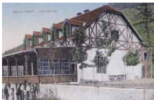
Hotel Fojtík s reštauráciou v roku 1912.