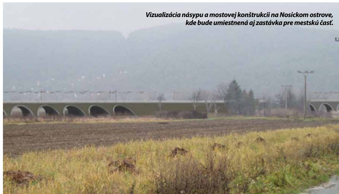
Vizualizácia násypu a mostovej konštrukcie na Nosickom ostrove, kde bude umiestnená aj zastávka pre mestskú časť.

Celý projekt modernizácie železničnej trate medzi Púchovom a Považskou Bystricou obsahuje veľké množstvo umelých stavieb, z ktorých niektoré zatiaľ nemajú