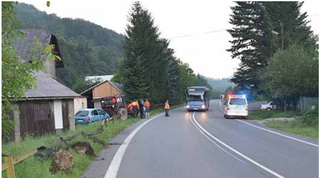
Mikrospánok vodiča bol príčinou dopravnej nehody, ktorá sa stala v sobotu v obci Lúky. Auto skončilo po náraze do zábradlia na streche. Našťastie si to odniesli iba plechy a zábradlie.

Hliadku mestskej polície požiadali z operačného strediska Okresného riaditeľstva Policajného zboru v Považskej Bystrici o predbežné zabezpečenie miesta v herni na Nábřeží slobody. Zákazník herne tam mal poškodiť výherný herný automat. Na mieste našli mestská policajti muža z Púchova, ktorý v herni rozbil displej na rulete. Po príchode hliadky z Obvodného oddelenia Policajného zboru z Púchova si previnilca prevzal štátni policajti, prípad je v riešení.