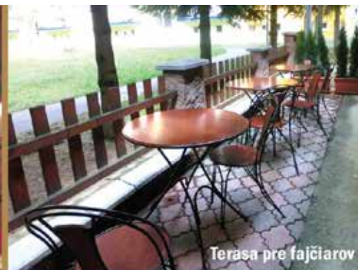
Terasa pre fajčiarov