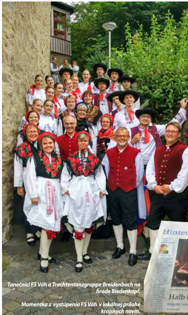
Tanečníci FS Váh a Trachtentanzgruppe Breidenbach na hrade Biedenkopf.

V sobotu pred vystúpením sme si vyšli na miestnu rozhľadňu a prezreli sme si celé okolie ako na dlani. Nasledovala cesta do Kirchhain, kde sme mali pódium pripravené na his-