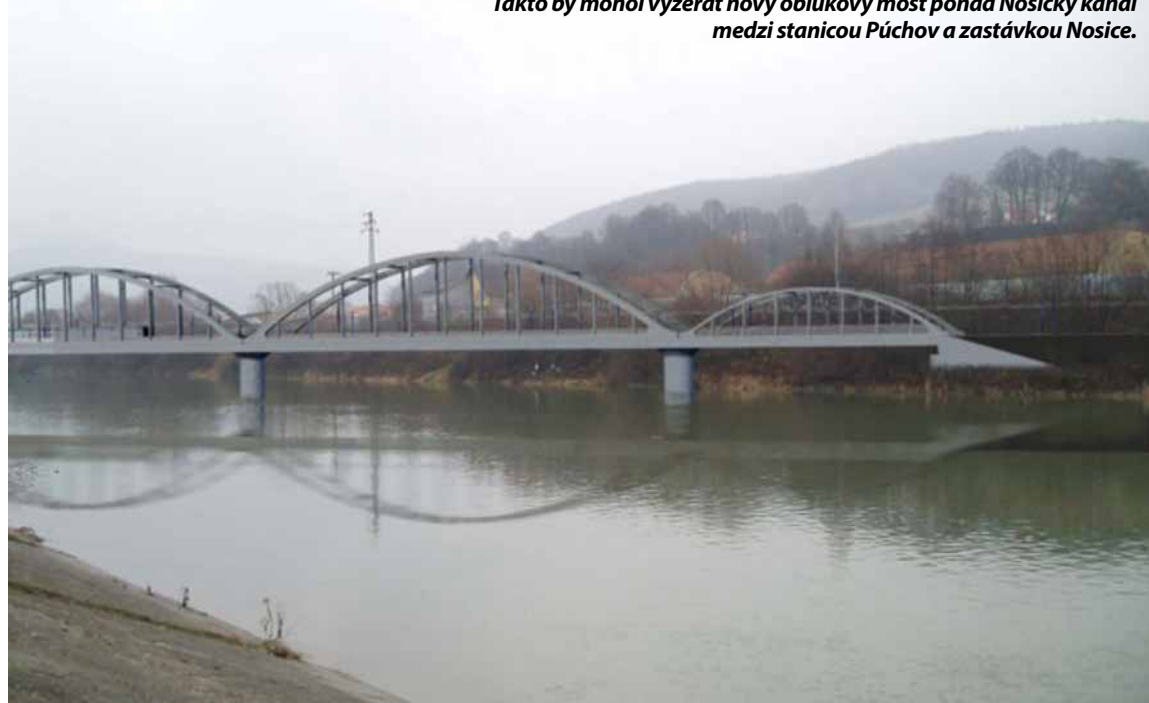
Takto by mohol vyzerat' nový oblúkový most ponad Nosický kanál medzi stanicou Púchov a zastávkou Nosice.

S modernizáciou železničnej trate v úseku Bratislava – Žilina sa začalo už v roku 2000 medzi Cíferom a Trnavou. Len pred nedávnom bola dokončená časť Beluša – Púchov, do ktorej bola zahrnutá i rekonštrukcia železničnej stanice v okresnom meste, a už sa rozbieha stavba úseku Púchov – Trenčianska Teplá. Rozsahom stavebných prác a technických riešení nemá v našom regióne toto dielo obdobu od 50-tych rokov minulého storočia, kedy bola postavená Priehrada mládeže.