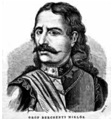
Mikuláš Bercsényi, veliteľ kuruckého vojska, ktorý dal v r. 1707 zapáliť Púchov.