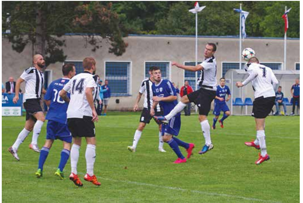
Cesta zarúbaná bola v Beluši ku bránke Komárna. Domáci (v modrom) sa proti výborne pozične hrajúcemu súperovi nedokázali presadiť. Napokon Belušania vydolovali remízu.

Domáci začali aktívne, a keďže Púchovčania kontrovali rovnakou mincou, diváci videli zaujímavé a kvalitné stretnutie. Hostia ohrozovali domácu bránu