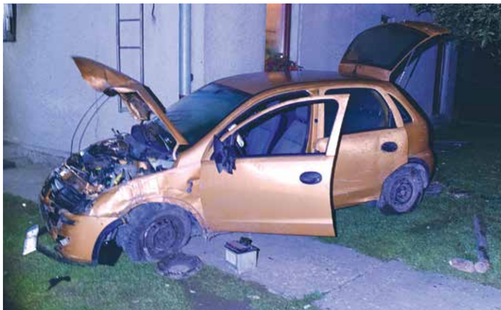
Len niekoľko minút si mladík z Púčovského okresu užil vodičský preukaz. Krátko po dovŕšení 18 rokov pod vplyvom alkoholu prerazil plot a narazil do rodinného domu v Lúkach.

Priemerná miera nezamestnanosti klesla v júli na Slovensku medzimesačne o 0,01 % na úroveň 9,44 %. Najvyššia nezamestnanosť bola minulý mesiac v okrese Rimavská Sobota (25,36 %), najnižšia v okrese Galanta (3,84 %). (r)