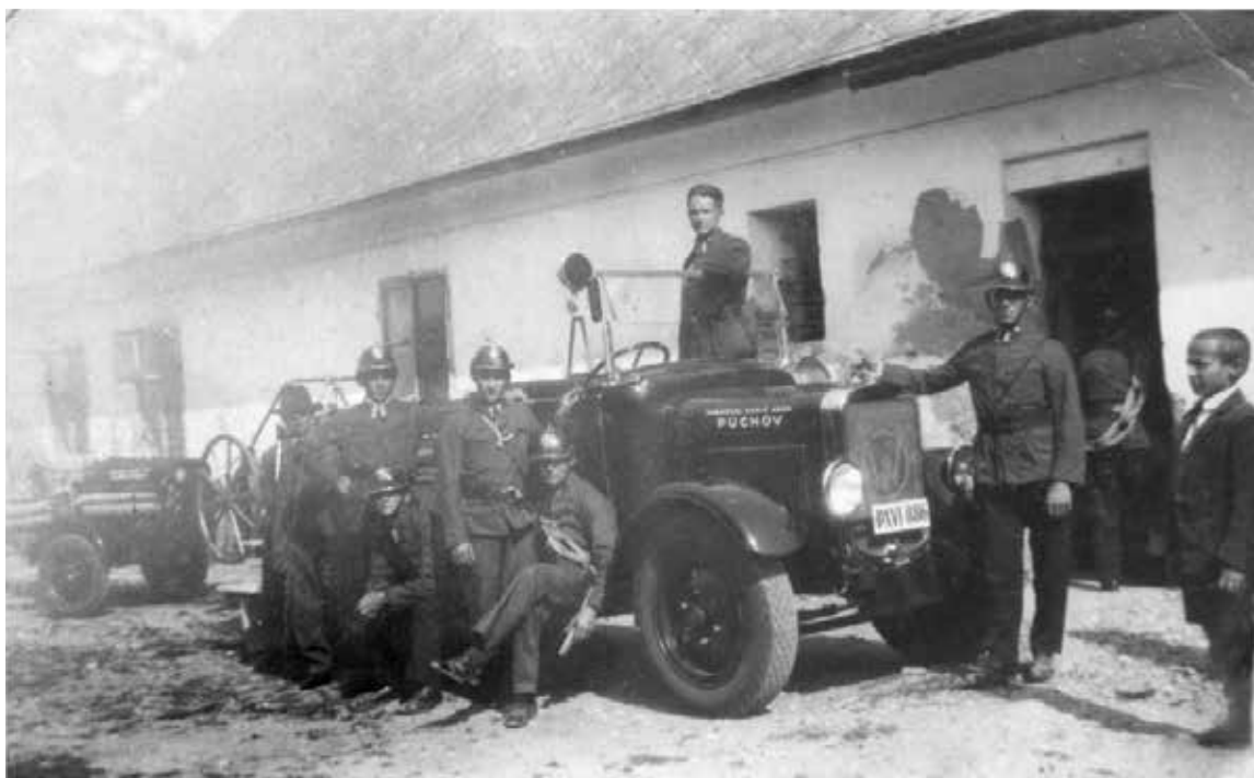
Púchovskí hasiči zakúpili v roku 1932 striekačku Walter a jej funkčnosťou sa môžu pýšiť i dnes.