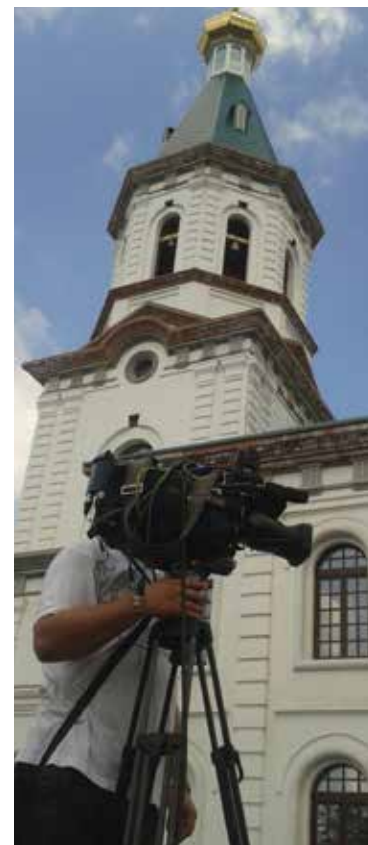
Zmluva o partnerstve a spolupráci bola s Omskom podpísaná v roku 1996.