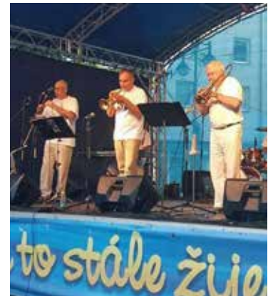
Jazzové melódie Dixieland bandu zo Sereďe odštartovali druhú polovicu púchovského kultúrneho leta.