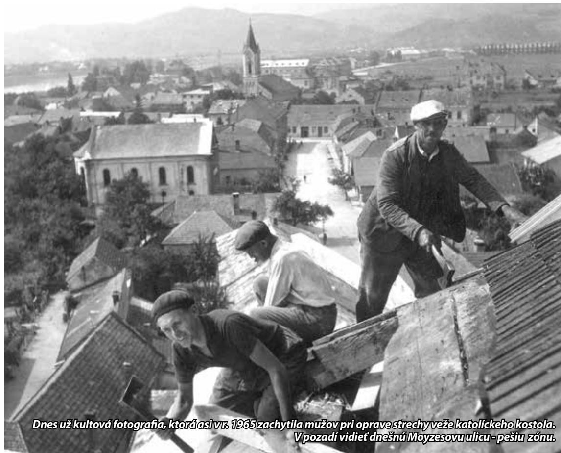
Dnes už kultová fotografia, ktorá asi v r. 1965 zachytila mužov pri oprave strechy veže katolíckeho kostola. V pozadí vidieť dnešnú Moyzesovu ulicu - pešiu zónu.