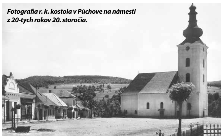
Fotografia r. k. kostola v Púchove na námestí z 20-tych rokov 20. storočia.