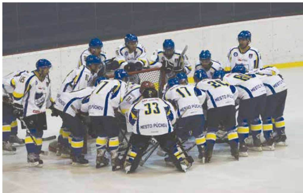
Tradičný predzápasový rituál pomohol Púchovčanom aj tentokrát.