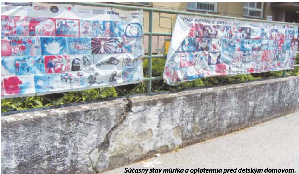
Súčasný stav múrika a oplotenia pred detským domovom.