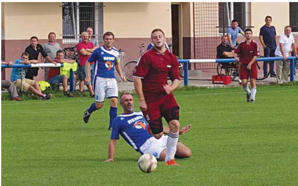
Len málokedy sa futbalistom Dolných Kočkoviec podarilo dostať za chrbát obrany Podmanína tak, ako v tomto prípade Glórikovi (s loptou). I preto napokon domáci prišli doma o dva body.

Lysá súboj s nevýrazným Dulovom nezvládla a prišla o všetky body. Hostia sa ujali vedenia už v deviatej minúte gólom Ježa – 0:1. Po polhodine zvýšil Bujnoch na 0:2 a keď pridali Mikšík hneď v úvode druhého polčasu tretí gól, bolo rozhodnuté. Domáci Panáček síce v 70. minúte znížil, no o štvrtú hodinu odpovedal Pagáč – 1:4. Tri minúty prikrášlil výsledok opäť Panáček,