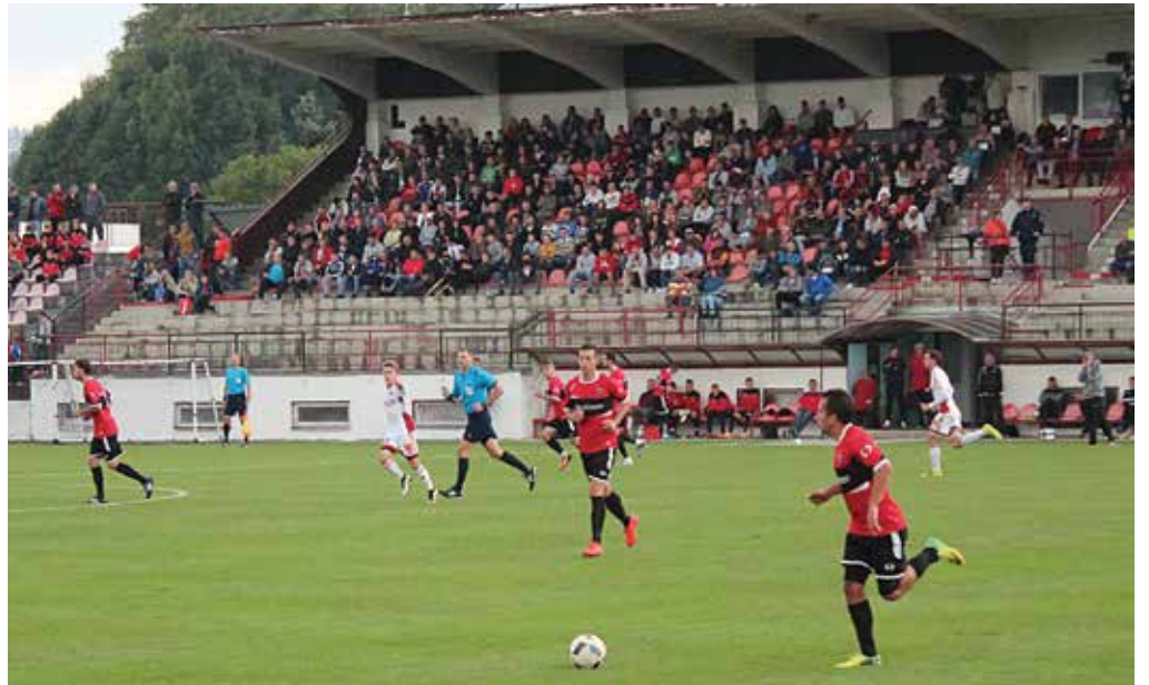
Utešená návšteva, statočný výkon a napokon prehra rozdielom triedy s majstrom. Aj takú podobu malo stretnutie tretieho kola Slovenského pohára MŠK Púchov – AS Trenčín.