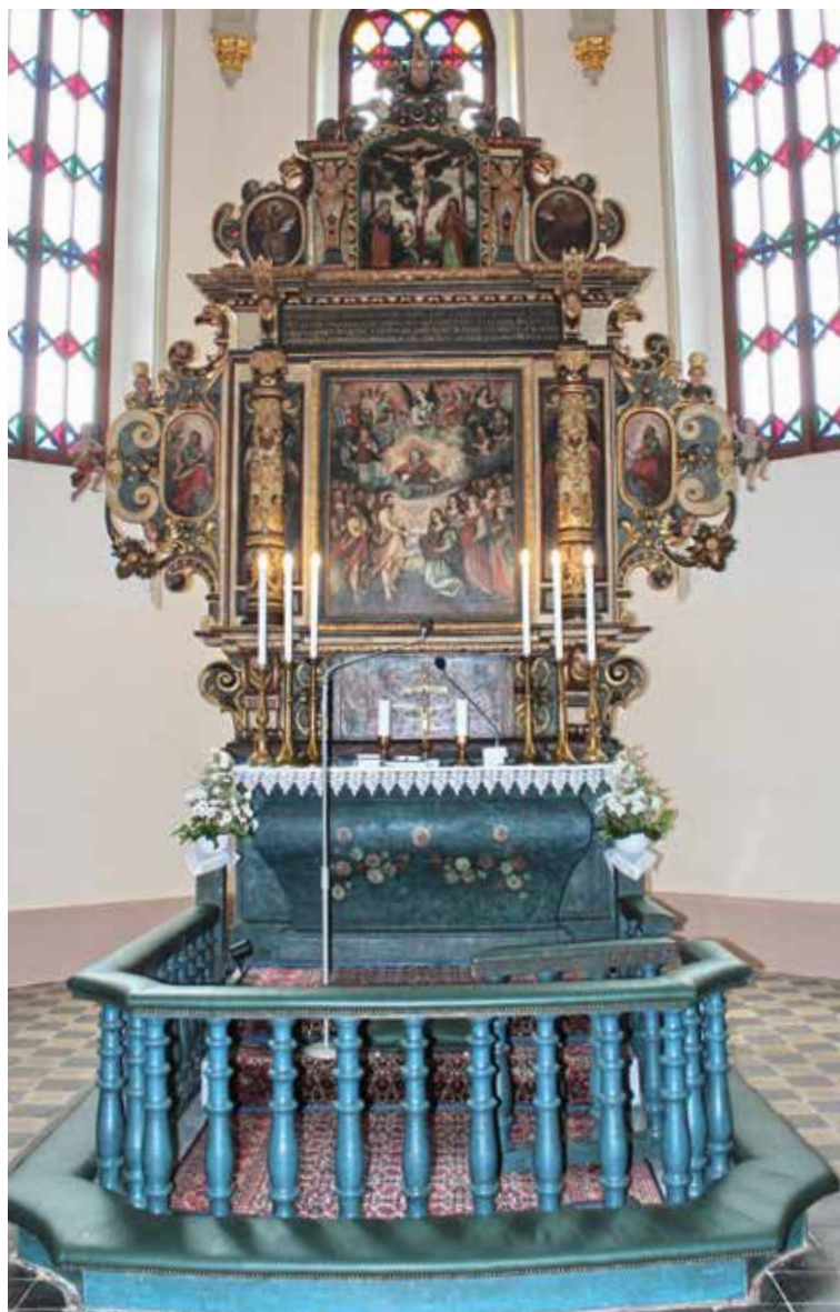
Renesančný vyrezávaný oltár pochádza z roku 1643. Patril medzi pôvodný inventár dnes už neexistujúcej Marcibányiho kaplnky.

pohon vežových hodín, cimbalo- elektromagnetické odbíjanie, ovláda- nie troch zvonov. Sú programovateľ- né až na jeden rok dopredu na každý deň. Tiež bol namontovaný elektrický pohon zvonov lineárnymi elektro-