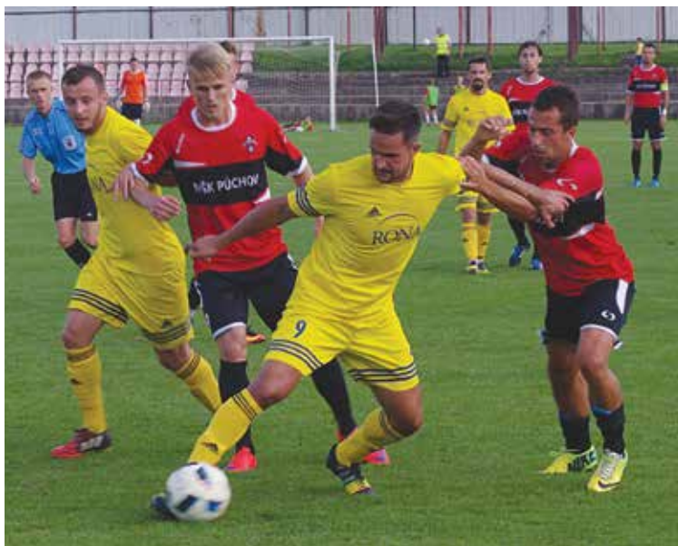
V minulom domácom ligovom zápase sa Púchovčania (v červených dresoch) v derby len ťažko presadzovali proti sklárom z Lednických Rovní. V sobotu si však so Šuranmi pripísali hladkú výhru.

Futbalisti MŠK Púchov sa pred domácimi priaznivcami chceli rehabilitovať za prehru s Lednickými Rovňami v derby na domácom trávniku. I keď začali aktívne, dlho si nevedeli poradiť s koncentrovanou