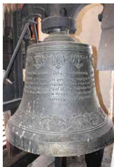
Tri zvony evanjelického kostola sú poháňané elektromotormi.

Kostolu obnovili omietku v rokoch 1930, 1962, 1967, 1980, 1989, 2004, 2008, 2009 bez zmien v pôvodnej stavbe. Vymalovaný bol v roku 2010.