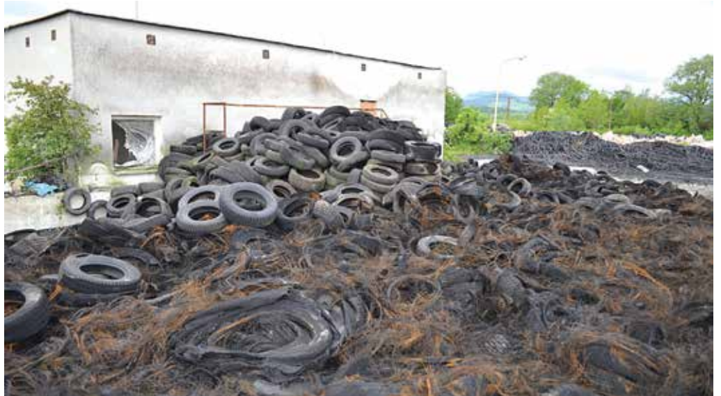
Požiar ojazdených pneumatík v areáli súkromnej spoločnosti v Hloží bol v minulom roku v rámci Trenčianskeho kraja viacnásobným „rekordérom“.