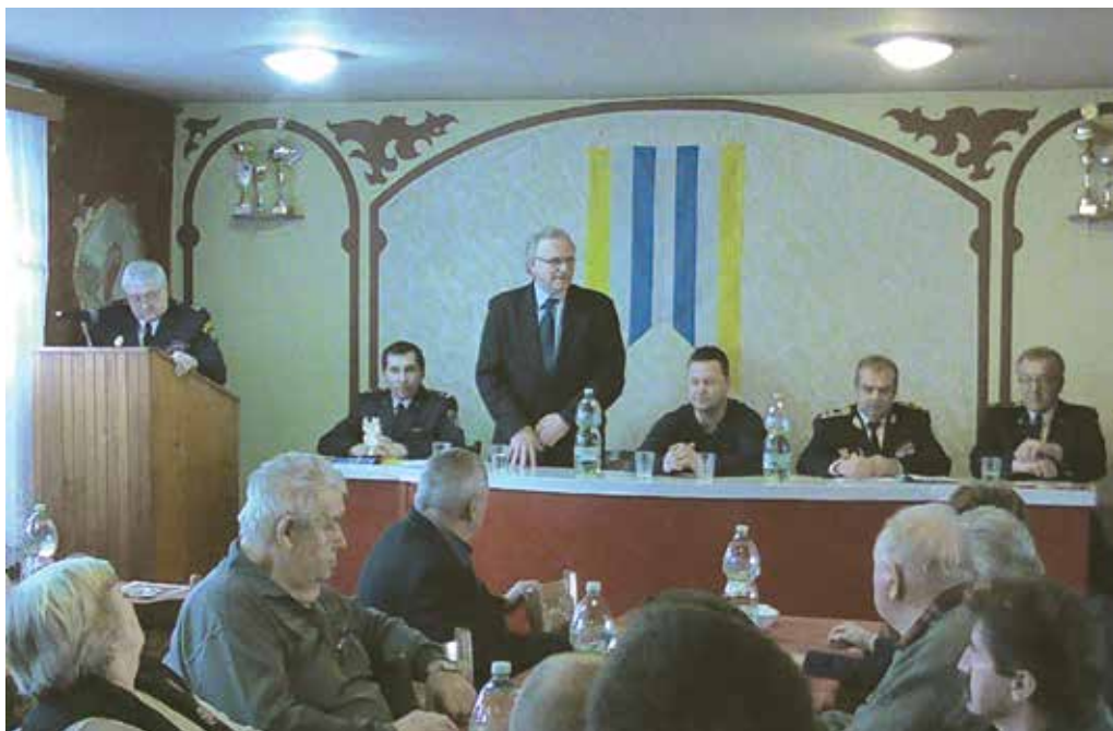
Rokovanie delegátov výročnej členskej schôdze dobrovoľného hasičského zboru v Púchove sa nieslo v konštruktívnom duchu.