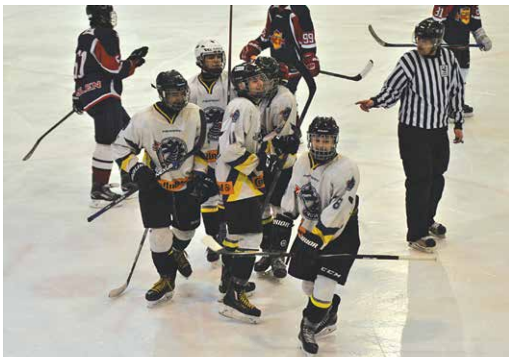
Kadeti MŠK Púchov (v bielych dresoch) vstúpili výborne do nadstavbovej časti súťaže o postup medzi slovenskú elitu v tejto vekovej kategórii. V úvodnom dvojkoľe si na domacom ľade dvakrát poradili so Zvolenom.