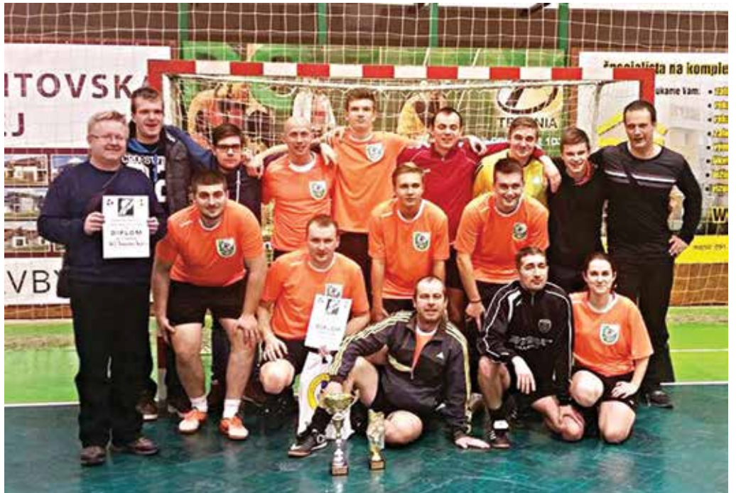
Rozhodcovia a delegáti Oblastného futbalového zväzu okresov Považská Bystrica, Púchov a Ilava si napravili reputáciu na tradičnom halovom futbalovom turnaji v Nových Zámkoch. Z juhu Slovenska si priviezli bronz.

Levice – Trnava 1:1, Hegedüs – Polakovič, p. k. 2:4.