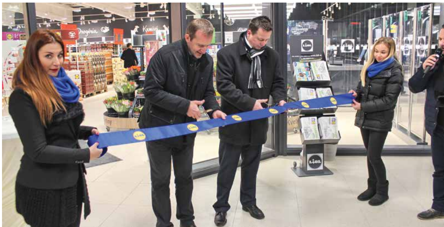
LIDL otvoril predajňu po šiestich mesiacoch od zbúrania starej.