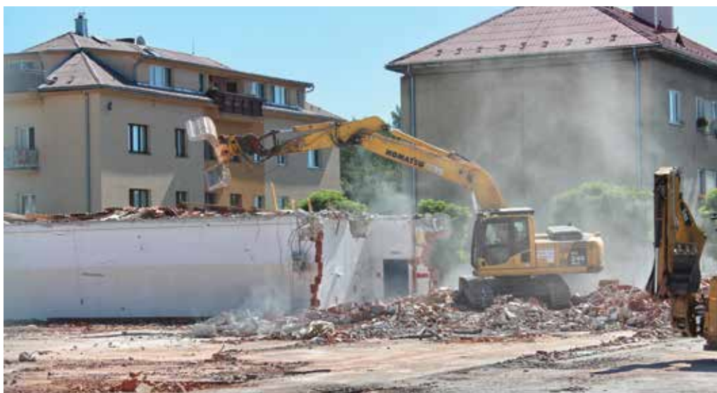
Búracie práce starej predajne v blízkosti kruhového objazdu pri Makyte začali uprostred leta 2016.