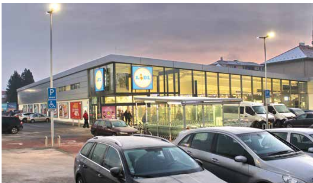
Krátko po otvorení v skorých ranných hodinách...