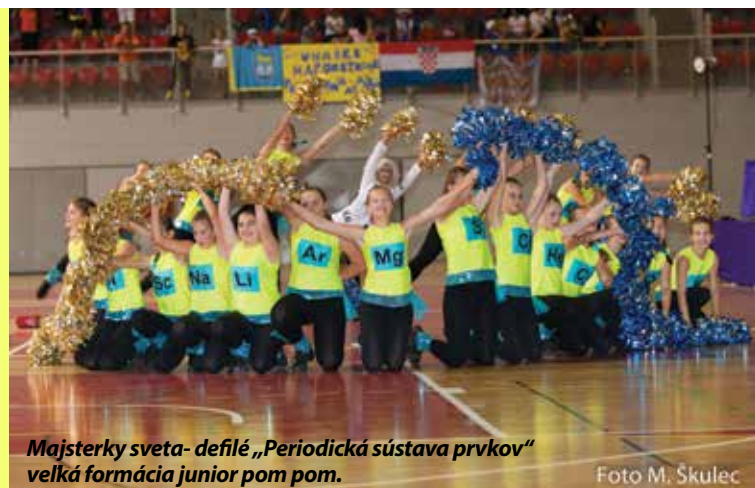
Majsterky sveta - defilé „Periodická sústava prvkov“ veľká formácia junior pom pom.

Celému súboru prajem veľa síl, energie, nových nápadov, choreografií a úspechov v ďalšom súťažnom roku.