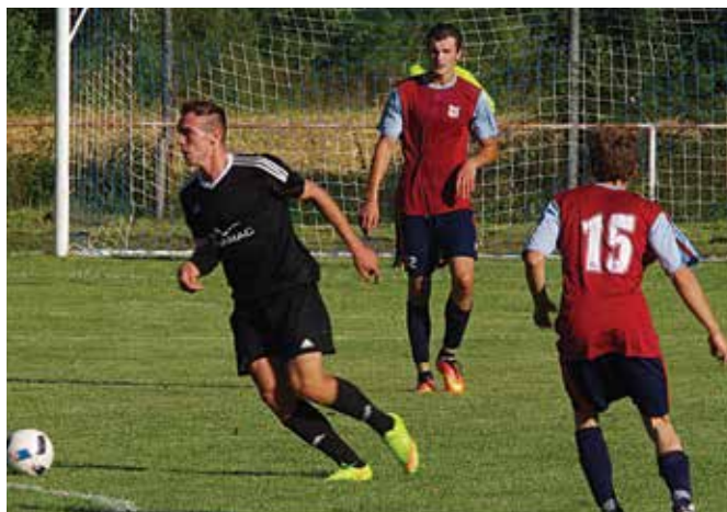
Futbalisti Lysej (v čiernom) vyšli doma s Košecou naprázdno.