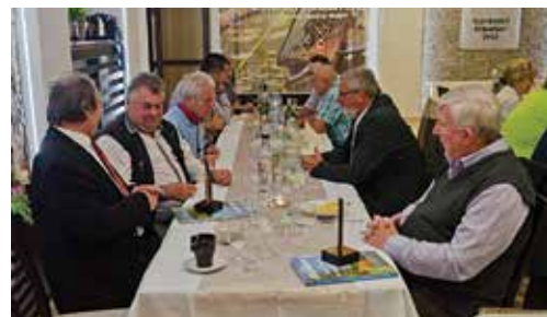
Ku gratulantom sa pridali aj predsedovia rybárskych organizácií v Trenčianskom kraji.