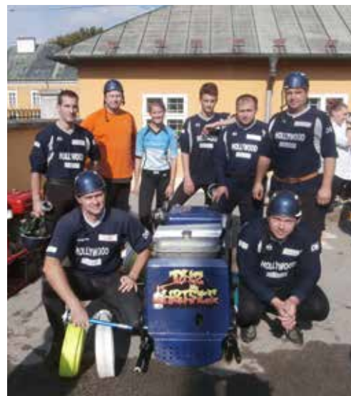
Dobrovoľný hasičský zbor Ihršťa (Púchov) získal na premiérovom ročníku hasičskej súťaže starostov pekné 2. miesto. Predbehli ho len hasiči z Horenickej Hôrky.