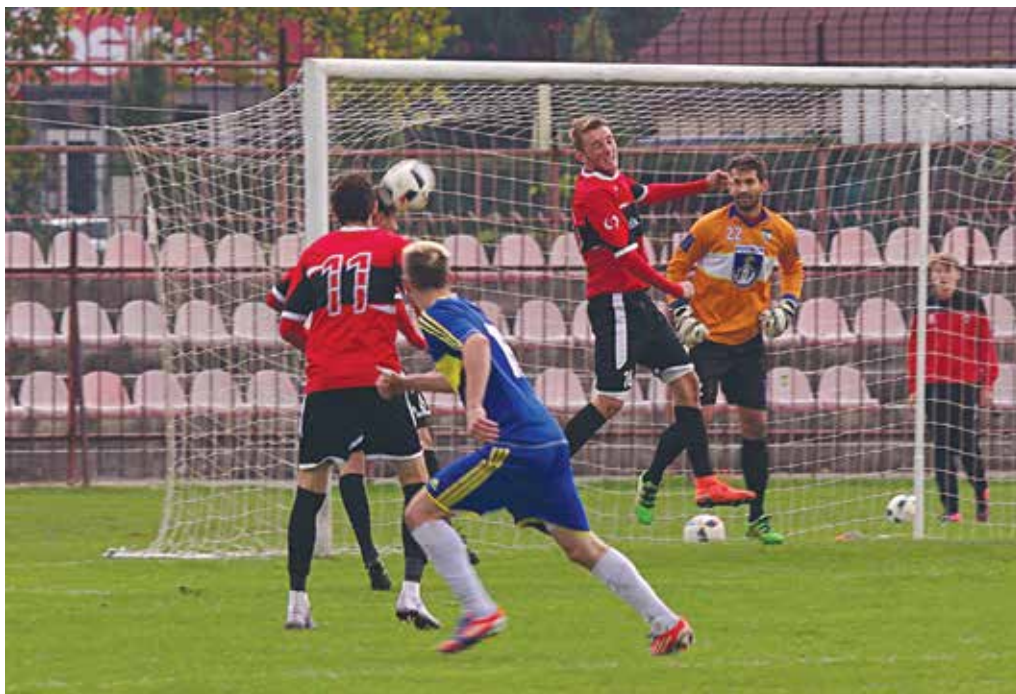
Púchovskej obrane (v červenom) sa na trávniku FC Horses nepodarilo udržať čisté konto tak, ako v domacom stretnutí pred týždňom s rezervou Zlatých Moraviec.

Výsledky 11. kola: Šaľa – Neded 4:3, V. Meder – Gabčíkovo 1:1, Horná Nitra – Dubnica 3:0, N. Zámky – L. Rovne 1:2 (Pokorný, Čiernik), Šurany – Topoľčany 0:0,