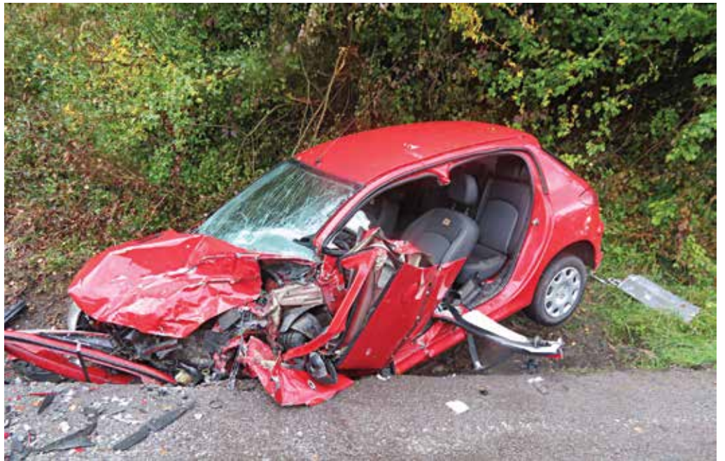
Na ceste medzi Udičou a Púchovom sa v pondelok 3. októbra stali v krátkom čase dve dopravné nehody. Neobišli sa bez zranenia.