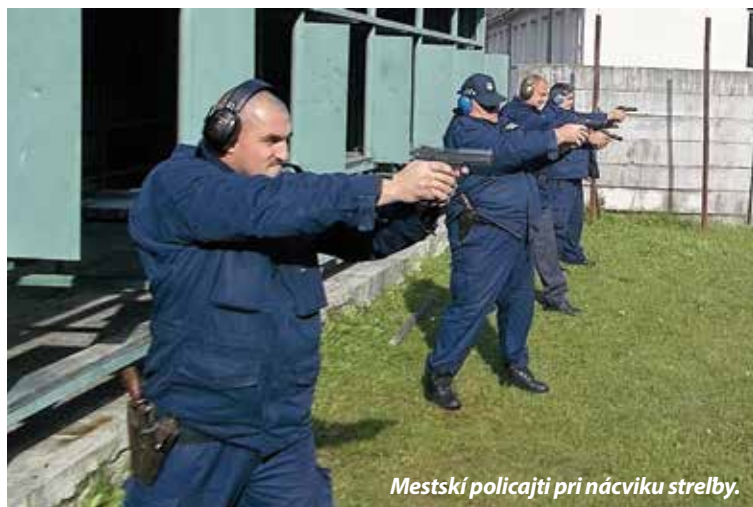
Mestskí policajti pri náviku strelby.

Niekedy sa na nás občania obracajú s absurdnými požiadavkami. Napríklad zavolajú v noci, že im nejde elektrina. Naši policajti musia vedieť trpezlivo vysvetľovať občanom, v čom im môžu pomôcť a v čom nie. Ľudia veľmi citlivo reagujú na činnosť mestských policajtov, lebo vedia, že na mestskú políciu idú nemalé finančné prostriedky. Prajem si, aby MsP Púchov svojou prácou pomáhala občanom mesta cítiť sa bezpečnejšie. Príslušníci mestskej polície poradia a pomôžu každému, kto ich o to požiada. Sme tu pre občanov. Dúfam, že aj občania nám svojou spolupracou pomôžu a pri každom podozrení z porušenia zákona zavolajú na bezplatnú linku 159 alebo priamo hliadke na číslo 0903/132 333.