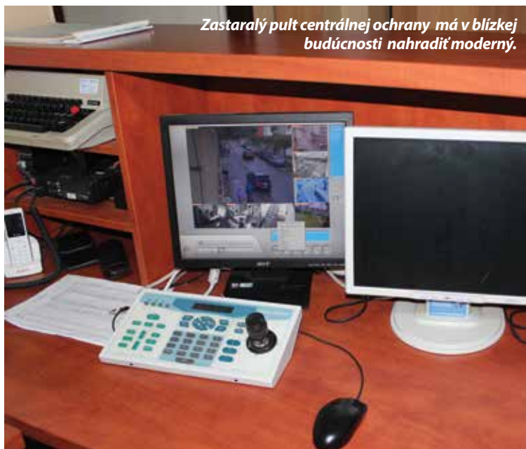
Zastaralý pult centrálnej ochrany má v blízkej budúcnosti nahradiť moderný.