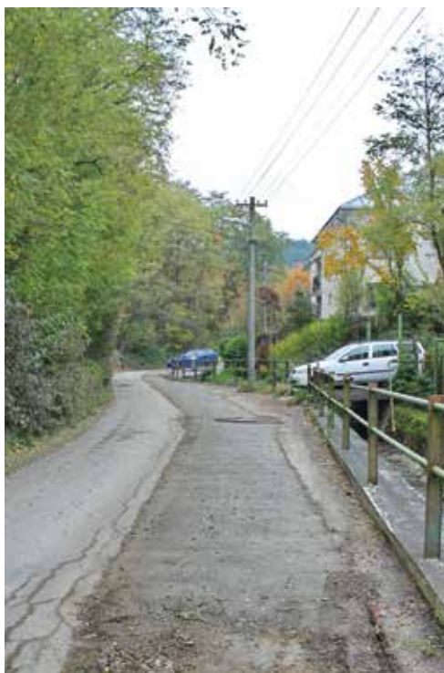
Záskanie – cesta je pripravená na asfaltový „koberec“.