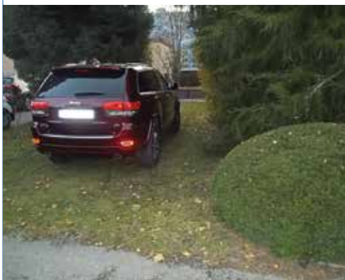
Keď si niekto zmýli park s parkoviskom...

Tridsaťeuróvú pokutu musela zaplatiť čašníčka v jednom z nočných podnikov na Moravskej ulici. Po štvrtej hodine nadráno sa z prevádzky, ktorá bola inak uzavretá, ozývali hlasy viacerých osôb. Na búchanie čašníčka otvorila, v prevádzke bolo asi osem osôb. Za nedodržanie otváracie doby dostala čašníčka pokutu, po jej zaplatení vyzvala hliadka osoby, aby prevádzku opustili.