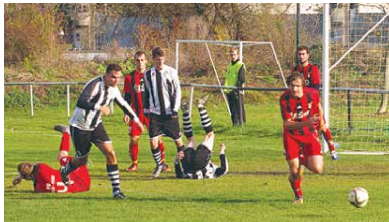
Streženičania (v čierno-bielych dresoch) si z Uhrovca priniesli štvorgólovú nádielku a majú už len dve šance pripísať si na jeseň prvé víťazstvo.