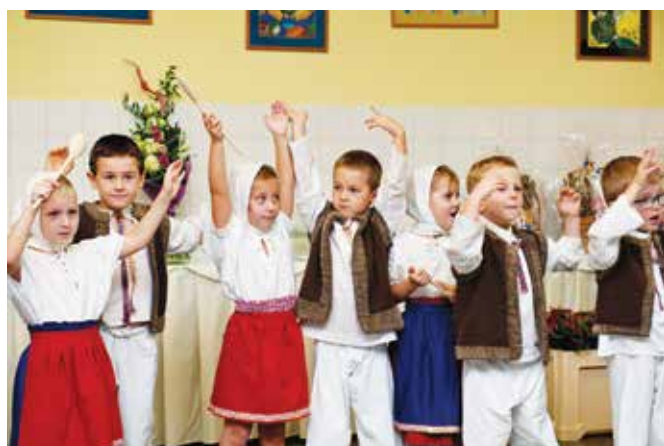
Foto vľavo: Kultúrny program k 30. výročiu založenia CSS Chmelinec si pripravili aj predškoláci z MŠ Mládežnícka.