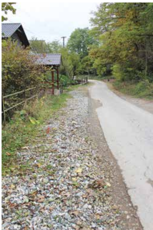
Záskanie – rozkopaná cesta pred rekonštrukciou.