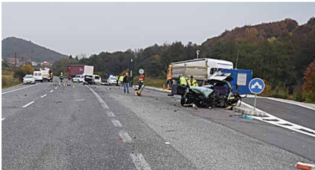
Miesto tragickej dopravnej nehody v katastri obce Mníchova Lehota. Vyhasol pri nej život nevinné ženy, vodička z Púchovského okresu skončila s vážnym zranením v nemocnici.

Z celkového počtu ochorení bolo 489 ochorení na chrípku. Chorobnosť oproti predchádzajúcemu týždňu klesla o 24,8 percenta. Pre chrípku museli prerušiť školskú dochádzku v jednej škole v okrese Bánovce. Informoval Regionálny úrad verejného zdravotníctva v Trenčíne. (P)