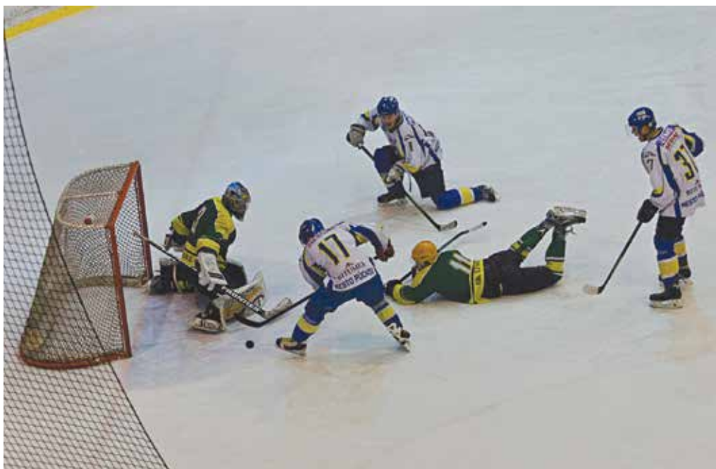
Ani z tejto šance nedokázal Bajtala prekonať brankára Levíc. Púchovčania natiahli šnúru prehiev a v tabuľke druhej ligy sú predposlední.