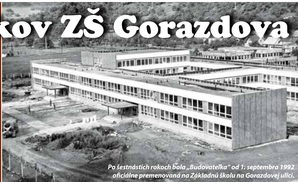
Po šesťnástich rokoch bola „Budovateľka“ od 1. septembra 1992 oficiálne premenovaná na Základnú školu na Gorazdovej ulici.

Pred štyridsiatimi rokmi, presnejšie 24. septembra 1976, bola v Púchove slávnostne otvorená Základná škola na Ulici budovateľov. Jej priestory hneď zaplnilo 762 žiakov s 37 pedagogickými, 13 nepedagogickými zamestnancami a ešte stále sa tu pohybujúci stavbármí.