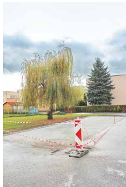
Rozšírenie odstavných plôch pri MŠ Mládežnícka.