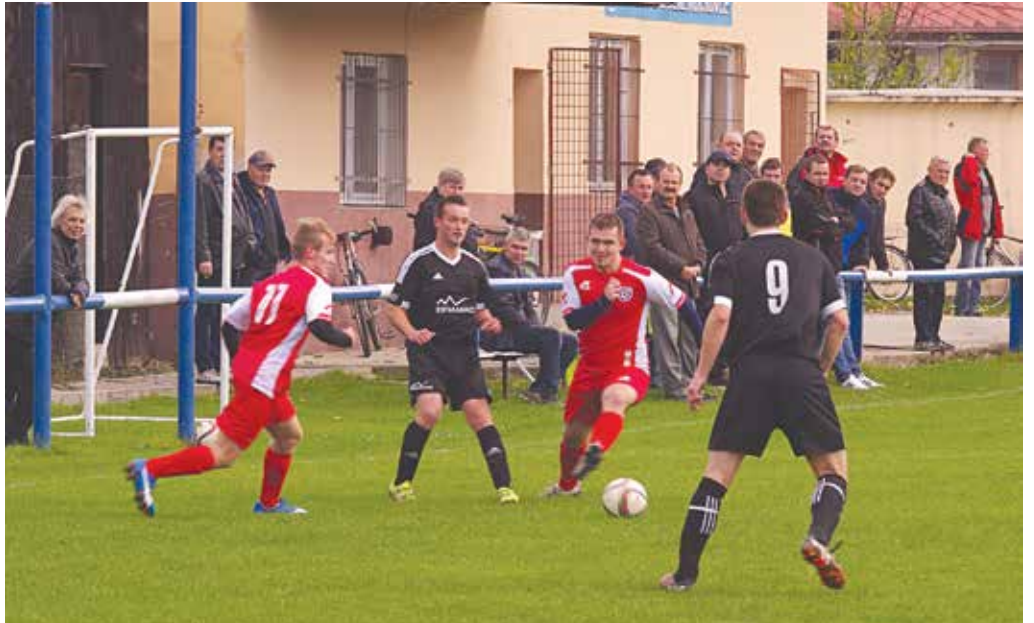
Zástupcovia Púchovského okresu v šiestej lige budú mať úplne odlišnú zimu. Kým Lysania (v čiernych dresoch) budú rozmýšľať, ako sa dostať z dna tabuľky, Dolnokočkovania (v červenom) si môžu užívať výborné štvrté miesto v tabuľke po jeseni. Tak vysoko ešte v najvyššej oblastnej súťaži nezimovali.

Domáci začali aktívne a už po štyroch minútach mohli ísť do vedenia. Opat však bravúrne zneškodnil tutovku Lokšíka. Hneď z nasledujúcej akcie mohol skórovať hosťujúci Pšenák, ale Hromadík v bránke Papradna bol proti. Ďalšiu stopercentnú šancu mal Fujaček a Mišíkovu strelu zneškodnil domáci gólmán. Aktívnejší hostia sa ujali vedenia v 16. minúte, kedy loptu dorazil do siete Frnka – 0:1. Papradno kontrovalo už o dve minúty, pokutový kop po faule v šestnástke premenil J. Galko – 1:1. Po vyrovnávajúcom góle ovládli hru hostia a Hromadík v domácej bránke čaroval po príležitostiach Mišíka, Frnku a Pšenáka, ktorý nepremenil ani samostatný nájazd na brankára Papradna. Ďalšia jeho strela sa otrela o žrd. V druhom polčase pokračoval tlak Dolných Kočkoviec. Fujaček mieril mimo, Bajza mieril do brvna, no v 59.