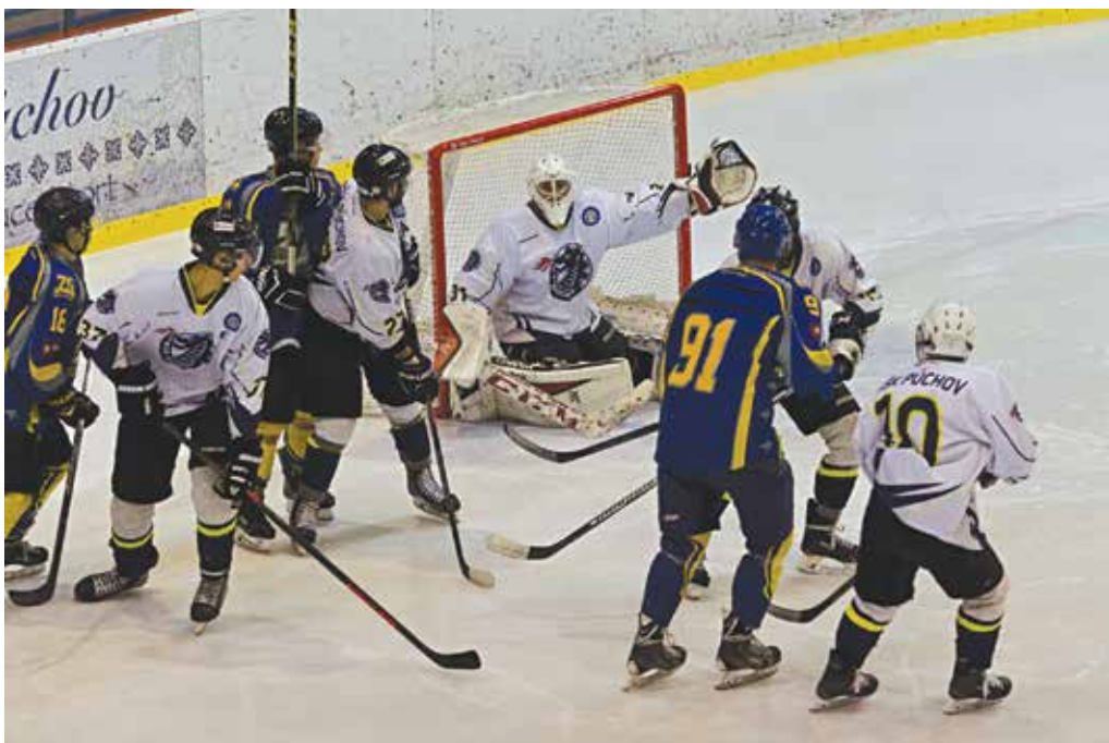
Junióri MŠK Púchov (v bielych dresoch) si v prviligovom stretnutí s poslednými Piešťanmi schuti zastrieli a štiperovi nadellili desiatku.

Topoľčany – Považská Bystrica 4:0, Partizánske malo voľno