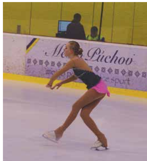
Pred pozorným zrakom poroty predvedli niektoré dievčatá obdivuhodné výkony.