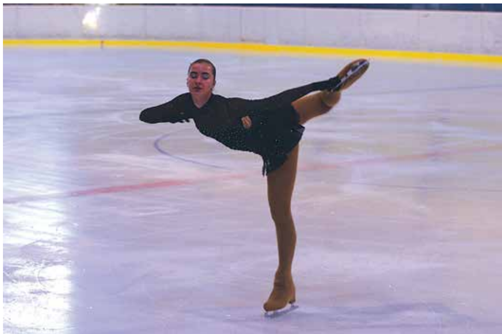
Viac ako 150 krasokorčuľiarok a krasokorčuľiarov ovládlo počas víkendú zimný štadión v Púchove na 4. Velkej cene Púchova v krasokorčuľovaní.