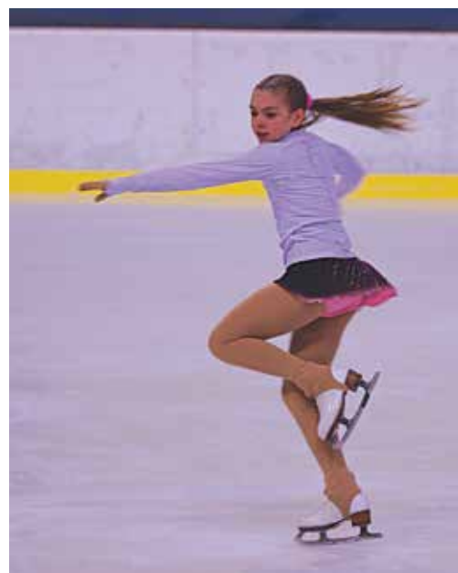
Možno sme i na púchovskom ľade videli budúce olympioničky...