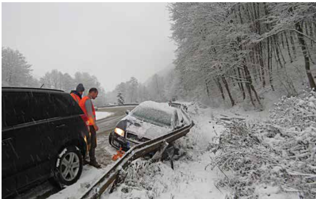
Najmä menej skúsení vodiči v zimnom období na zasnežených cestách neraz takto zničia svoje vozidlo.

Zasahujúci hasiči ihneď po príchode poskytli zranenej osobe predlekársku prvú pomoc. Následne po príchode posádky zdravotnej záchranky si zranenú osobu prevzali zdravotníci, ktorí zraneného vodiča ošetrili a odviezli na ďalšie vyšetrenie do nemocnice. Púčovskí hasiči na vozidle vykonali protipožiarne opatrenia, prostredníctvom sorbčnej látky zachytili vytečené prevádzkové kvapaliny a po príchode odťahovej služby asistovali pri naložení automobilu na vozidlo odťahovej služby. KR HaZZ Trenčín