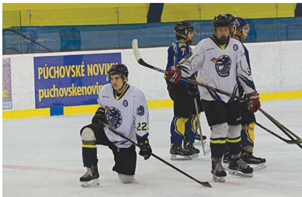
Junióri MŠK na kolenách... V 21. kole nestačili Púchovčania na lídra z Martina, ktorému na jeho ľade podľahli 2:7.