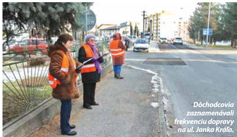
Dôchodcovia zaznamenávali frekvenciu dopravy na ul. Janka Kráľa.

Ide o pilotný projekt, ktorý sme ako poslanci za tento obvod iniciovali vzhľadom na sťažnosti občanov súvisiace s neúnosnou situáciou v statickej aj dynamickej doprave v našom volebnom obvode. Nezávislý pohľad odborníkov na náš obvod ako celok, analýzu platnej legislatívy a STN ohľadom statickej dopravy, cestných komunikácií považujeme za kľúčové, aby sme mohli pristúpiť postupne od budúceho roku k zmenám, ktoré