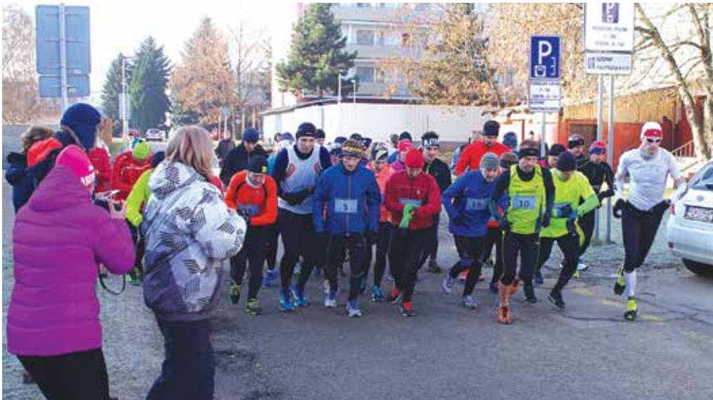
Na štart Vianočného behu v Púchove sa v sobotu 17. decembra postavilo niekoľko desiatok výkonnostných i rekreačných bežcov.