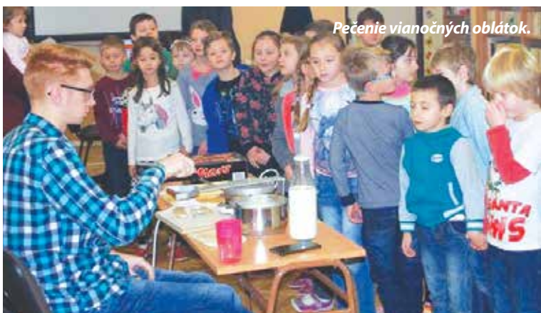
Pečenie vianočných oblatok.