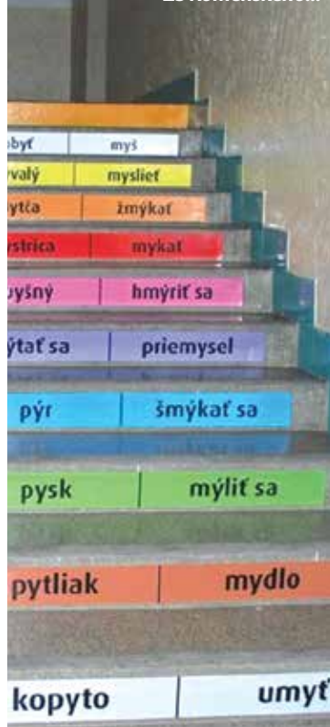
Po edukačných schodoch ZŠ Komenského...