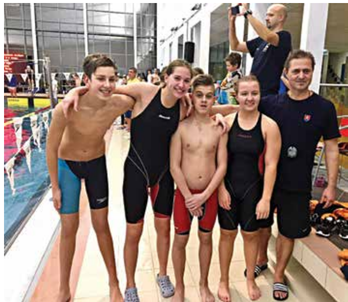
Päťica Púchovčanov, ktorí sa predstavili na majstrovstvách Slovenska staršieho žiactva.