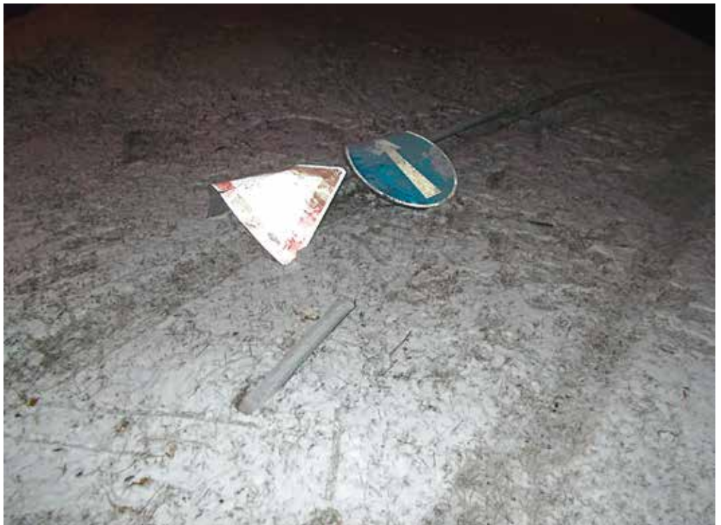
Dopravné značky na ostrovčeku „zrachnoval“ minulý týždeň neznámy vodič. Polícia po ňom pátra.

Hliadku mestskej polície oslovila žena, podľa ktorej je v časti Potôčky zaparkované osobné motorové vozidlo bez evidenčných čísel, podľa nej šlo pravdepodobne o vrak. Mestskí policajti na mieste zistili, že automobil nie je vrakom, keďže má platnú emisnú kontrolu a STK. Následne žena oznámila, že v časti Potôčky sa nachádza rôznyi železný odpad. Mestskí policajti po preverení oznámenia zistili, že pozemok, na ktorom je uložený železný odpad je súkromný, a teda nejde o priestupok.