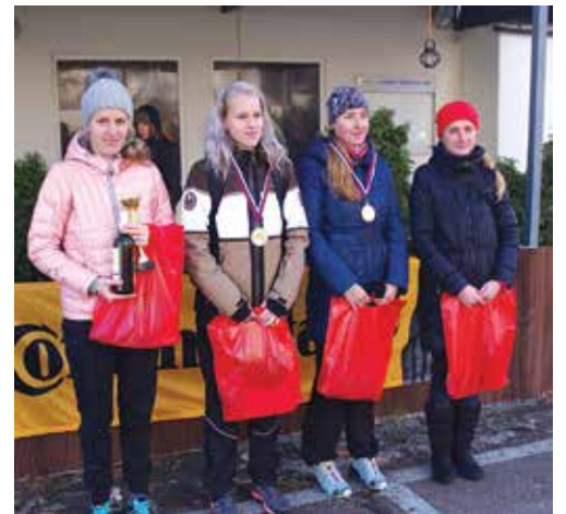
Kvarteto najrýchlejších v kategórii žien.