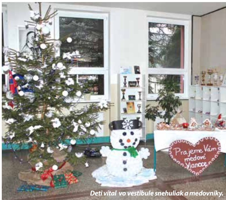
Deti vítajú vo vestibule snehuliak a medovníky.