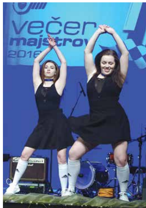
Večer majstrov SMF spestrilo vystúpenie dievčenskej skupiny DVUZE z Púchova.