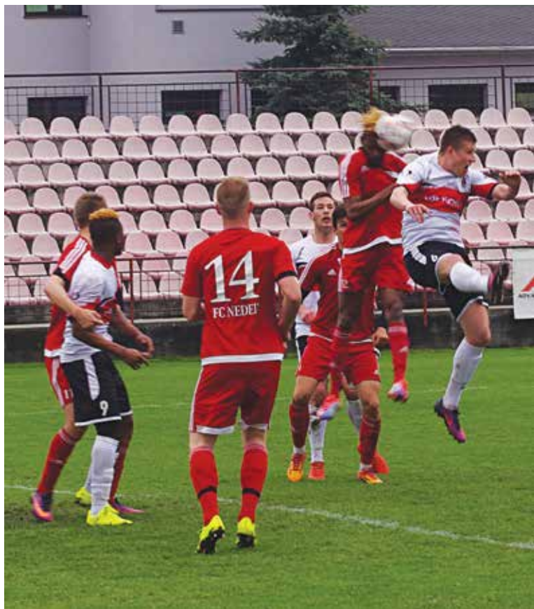
Púchovčania sa v nedeľu na trávniku rezervy Dunajskej Stredy strelecky presadiť nedokázali. Po minulotýždňovom víťazstve nad Nededom (na snímke), si brúsi zuby na plný bodový zásah už v sobotu v domácom stretnutí so Šalou.