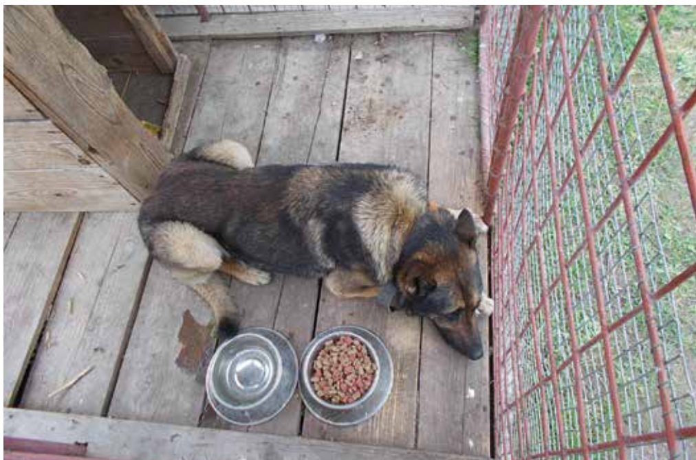
Prechádzka v sprievode mestského policajta tvrdohlavého nemeckého ovčiaka upokojila a v koterci na technických službách pokojne oddychoval. Menej spokojný bol už jeho majiteľ, ktorý musel za porušenie VZN zaplatiť pokutu.

Na oddelenie mestskej polície oznámila vedúca predajne na Nimnickej ceste, že jej pracovníci našli v predajni peňaženku s finančnou hotovosťou aj s dokladmi. Hliadka od predavačky prevzala peňaženku s dokladmi na meno ženy zo Zubáku. Hliadka prostredníctvom Obvodného oddelenia Policajného zboru v Púchove zistila telefónne číslo majiteľky peňaženky a asi o hodinu si ju prevzala na oddelení mestskej polície.