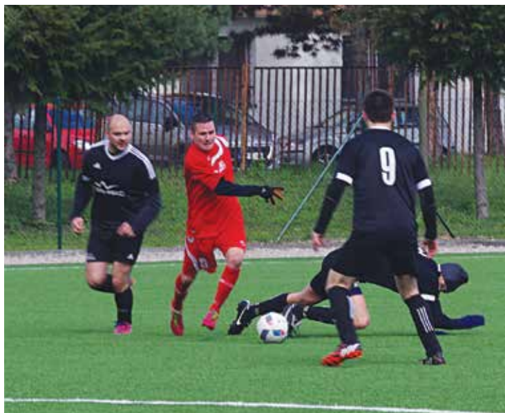
Na umelej trávě v Považskej Bystrici si častokrát ani traja Lysania (v čiernom) nedokázali poradiť s rýchlym Považskobystričanom.