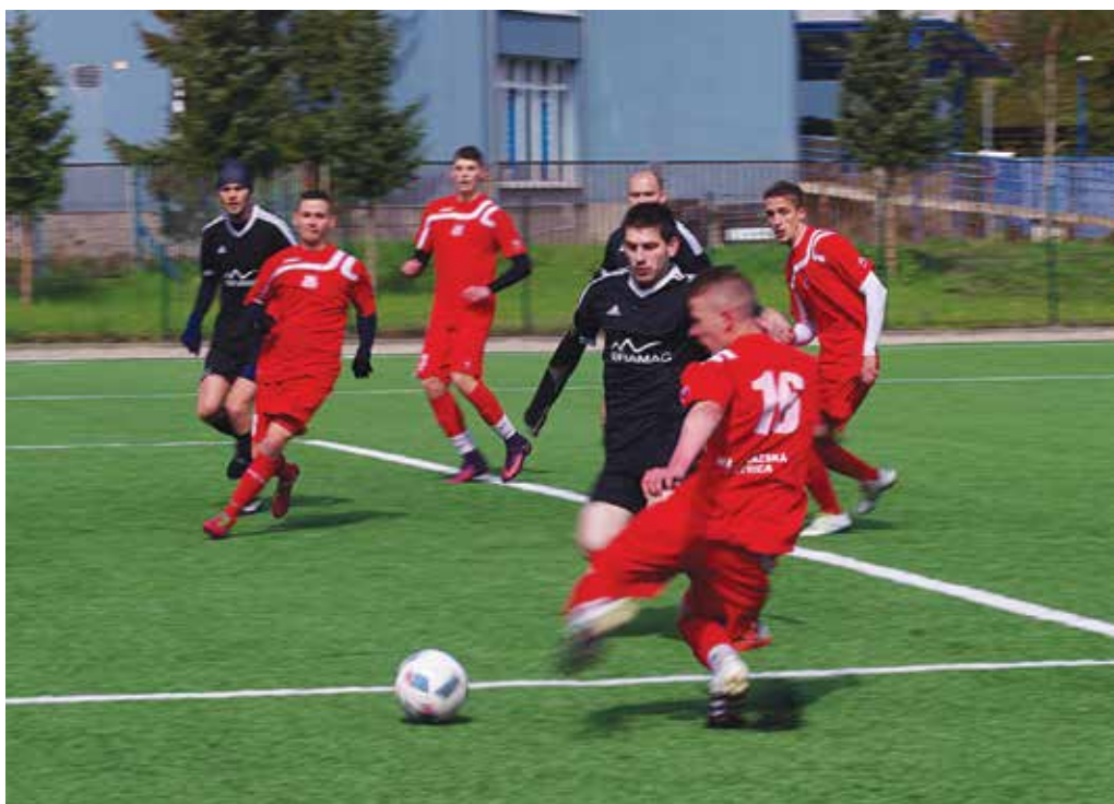
Až príliš veľa voľného priestoru nechávali futbalisti Lysej (v čiernych dresoch) v pokutovom území hráčom Považskej Bystrice. I preto sa pod Manínom zrodilo hladké víťazstvo lídra šiestej ligy.

Považskobystričania ako líder oblastnej ligy začal úlohu favorita naplňať už od úvodných minút. Už v piatej minúte sa dostal do stopercentnej šance Borovička, ale Fojtek v bránke Lysej ho vychytal. Podobne úspešný bol gólmán hostí aj o niekoľko minút neskôr, keď si poradil s nájazdom domáceho Valienta. V desiatej minúte Borovičkovu skvelú príhrávku neusmernil do siete Gáborík, no potom sa už začal gólostroj Považskej Bystrice. V 15. minúte otvoril skóre peknou strelou do šibenice Borovička – 1:0. V 25. minúte našiel Borovička Gáborík, ktorý do odkrytej bránky zvýšil na 2:0. Na 3:0 zvyšoval o tri minúty neskôr opäť Gáborík, ktorý využil zaváhanie hostujúcej obrany. Lysania nechávali domácim v pokutovom území až príliš veľa priestoru a len streleckej neschopnosti domácich mohli vďačiť za to, že už na prestávku neodchádzali s vyššou nádielkou. V druhom polčase pokračoval tlak domácich a s ním prišli aj góly. V 48. minúte zvýšil Bielik utešenou strelou na 4:0. Potom prišla aj šanca hostí, strelu M. Zlochu však domáci brankár kryl. V 60. minúte zvýšil Masaryk na 5:0 a o sedem minút neskôr premenil J. Valient penaltu za faul na Čiernika – 6:0. Desať minút pred koncom pridali Almásky siedmy gól, o dve minúty zvýšil na 8:0 Čiernik strelou od brvna a skazu Lysej dokončil dve