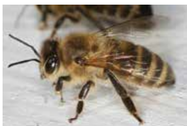
V súčasnosti sa na území Slovenska chová Včela kraňská – Apis mellifera carnica .

Med vzniká tak, že včela lietavka donesie nektár do úľa, odovzdá ho ďalšej včele, tzv. úlovej včele, tá nektár obohatí o zložky z hltanových žliaz a