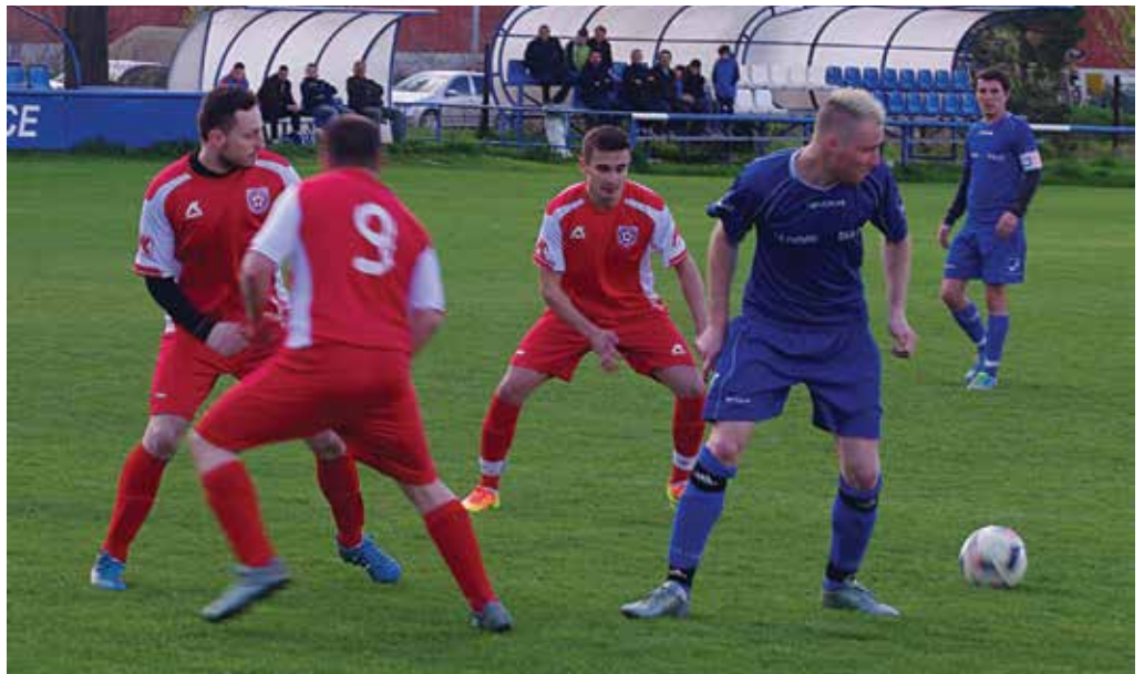
Po nemastnom - neslanom výkone proti oslabenému Dulovu si futbalisti Dolný Kočkoviec (v červených dresoch) napravili reputáciu a zdolali doma druhú Košecu.