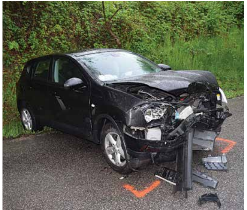
Ilustračná snímka: KR PZ Trenčín