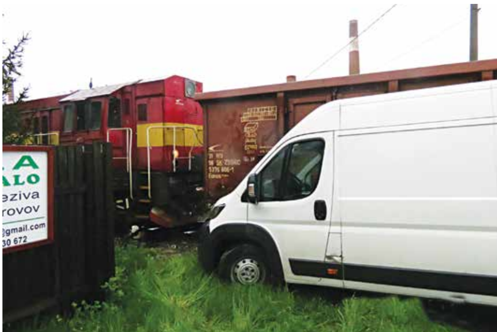
Aj na trati, kde sa vlaky vyskytujú len sporadicky, môže dôjsť k dopravnej nehode. Presvedčil sa o tom vodič Peugeotu, ktorý si v Lednických Rovniach nevsímal manipulačný vlak.