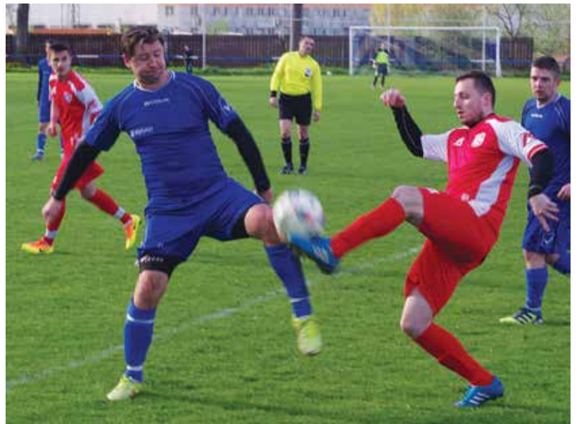
Dolnokočkovania (v červenom) v Podmaníne nesklamali, no domáci napokon ich stoatý odpór zlomili a vyhrali 4:1.

V derby Ilavského okresu sa ujali hostia vedenia už