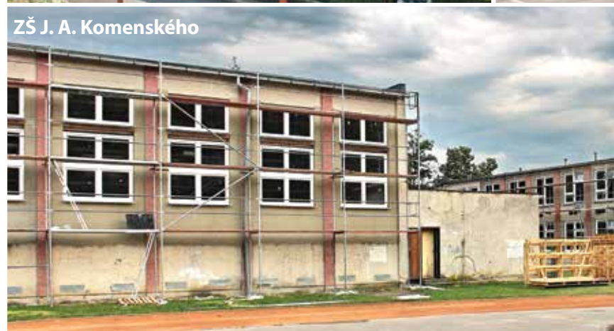
ZŠ J. A. Komenského