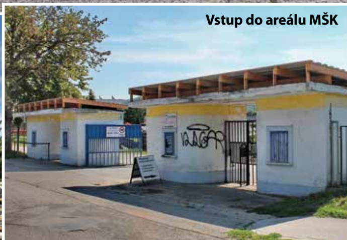
Vstup do areálu MŠK