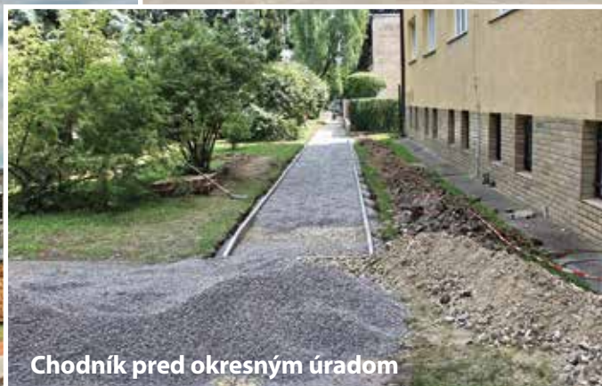
Chodník pred okresným úradom