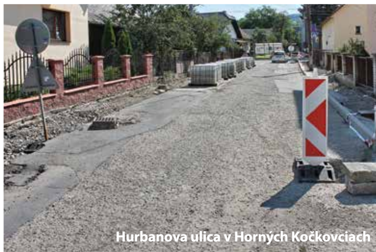
Hurbanova ulica v Horných Kočkovciach

Poslanci schválili na tento rok investičné akcie za viac ako 2 milióny eur. V júli začala rekonštrukcia Hurbanovej ulice v Horných Kočkovciach, ktorá zahŕňa okrem novej vozovky aj rekonštrukciu chodníka. Na troch zo štyroch mestských základných školách sa tento rok významne zainvestuje. Najväčšia akcia sa rozbehla na ZŠ Gorazdova, kde minulý mesiac vymenili okná a začalo zatepľovanie všetkých budov. Na ZŠ Komenského nadviazali na minuloročné práce na hlavnej budove a vymenili okná na školskom klube a telocvični. ZŠ s MŠ Slovanská obnovila striešku nad prechodovými chodbami a chystá sa na výmenu okien. Striešky vymenili aj na vstupe do areálu MŠK. Na požiarnej stanici boli zakúpené a nainštalované nové brány. Na viacerých uliciach sa začalo s rekonštrukciou chodníkov a rozširovaním spevnených plôch na parkovanie. -sf-