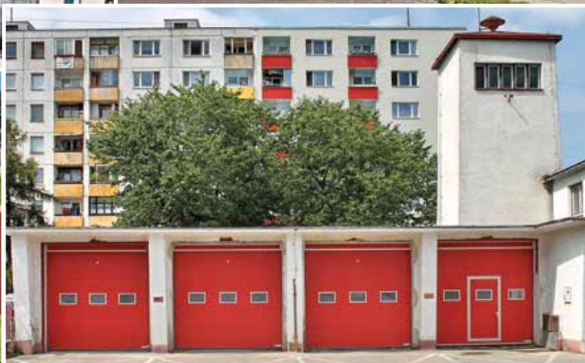
Garáže požiarnej zbrojnice DHZ