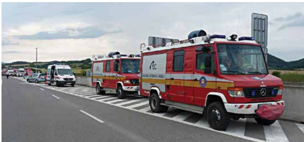
Pri dopravnej nehode na diaľnici D1 pri Beluši zasahoval aj záchranársky vrtuľník.