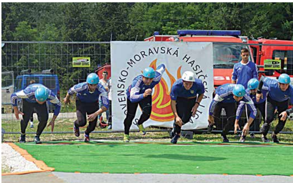
Muži z Nosíc si v Zbore vybehali peknú štvrtú priečku a držia sa na šiestom mieste SMHL.

Muži: 1. Brumov B – 13,67 s, 2. Nosice – 13,79 s, 3. Lidečko – 13,92 s, 4. Stupné – 14,11 s, 5. Podlužany