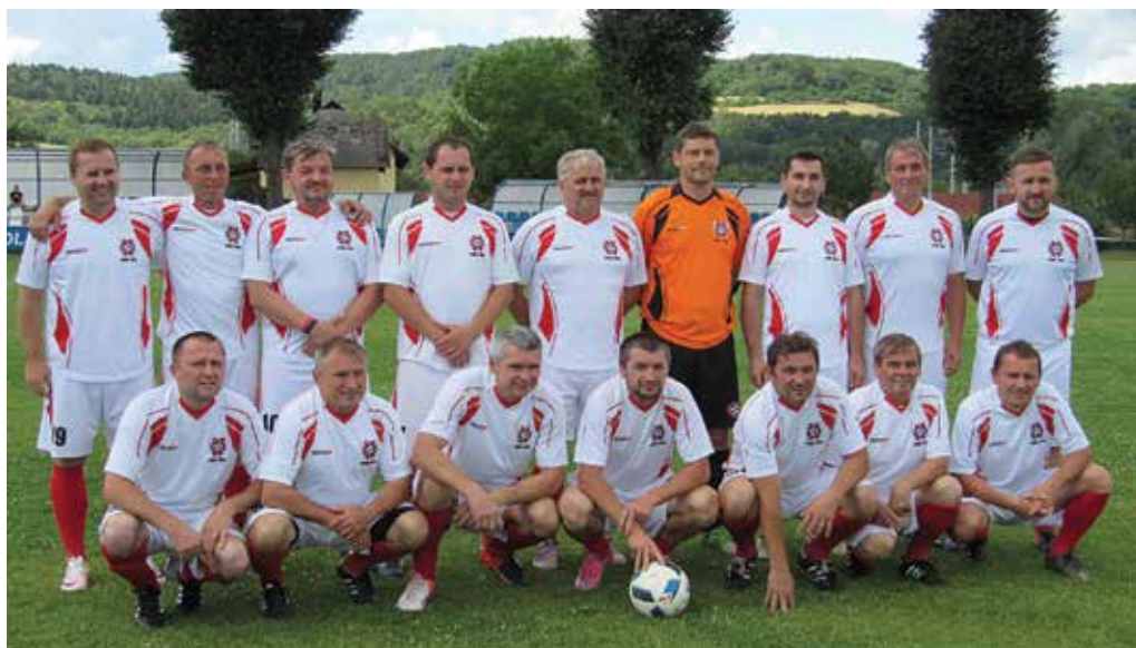
Starí páni Dolných Kočkoviec triumfovali v tradičnom domácom futbalovom turnaji.