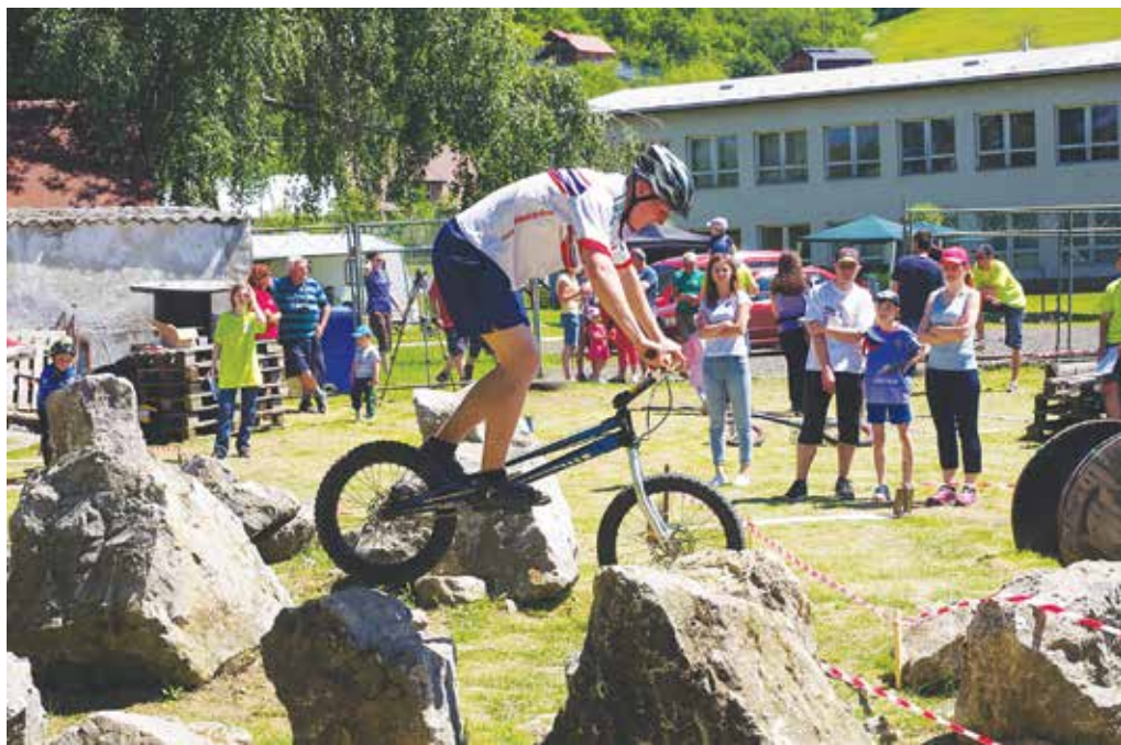
Cyklotrialový areál pri základnej škole v Záriečí privítal účastníkov Slovenského pohára zo Slovenska, Českej republiky a Poľska.