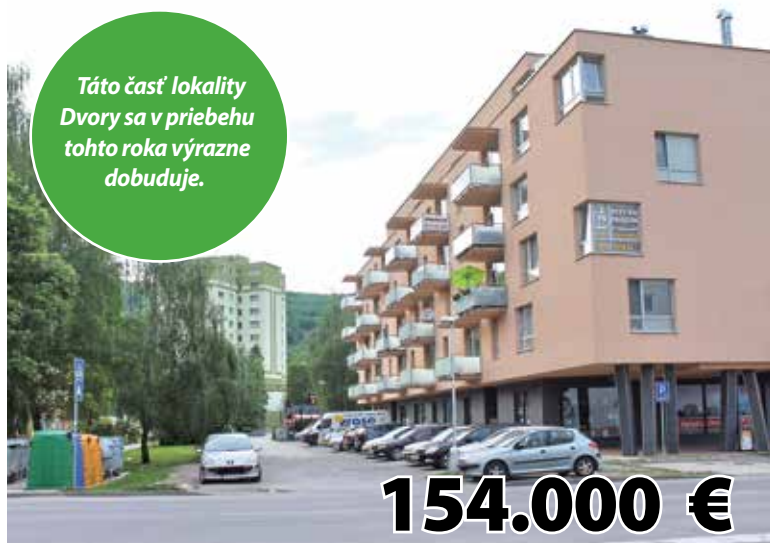
Dvory – dobudovanie cesty, chodníkov a parkovacích miest