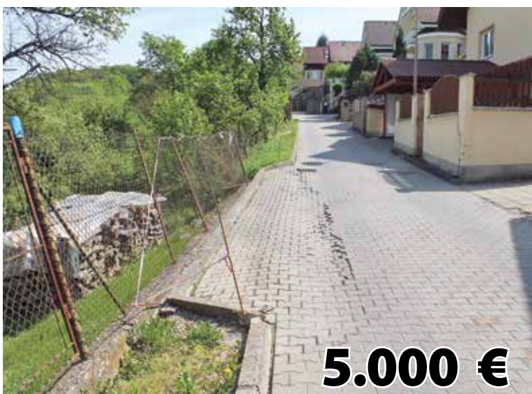
Riešenie havarijného stavu miestnej komunikácie na Astrovej ulici