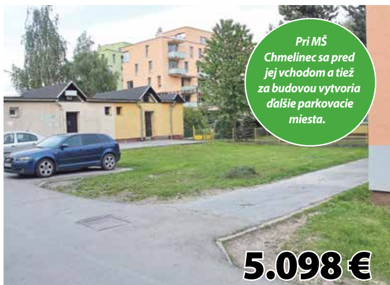
Rozšírenie parkovísk pred Materskou školou Chmelinec