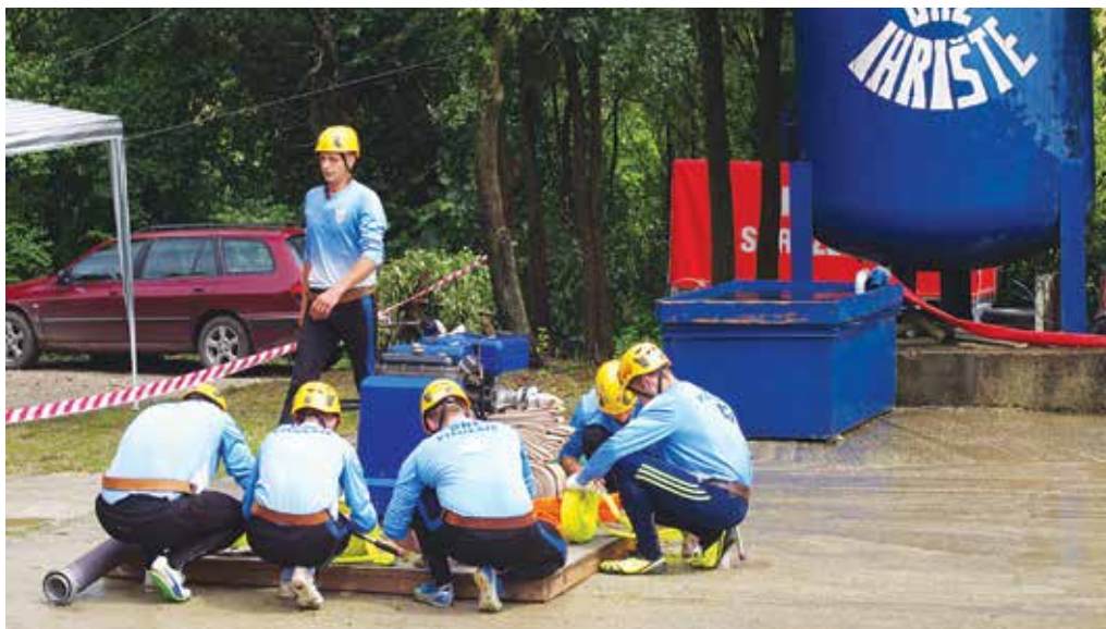
V sobotu odštartuje jubilejný 15. ročník Slovensko-moravskej hasičskej ligy. Po štyroch kolách sa koncom júna presunie do Púčovského okresu - do Ihrišťa.

na iné osoby. Patrik je vysoký asi 175 centimetrov, štíhlejšej postavy. Má hnedé rovné a zelenohnedé oči. Akékoľvek informácie, ktoré by smerovali k vypátraniu hľadaného muža môžu občania oznámiť na najbližší policajný útvar alebo na bezplatnú policajnú linku 158. KR PZ Trenčín