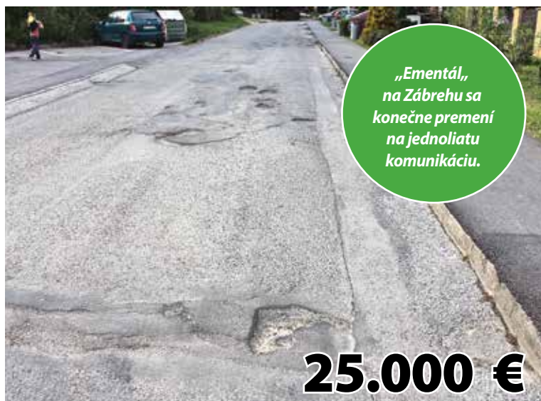
Oprava cesty v lokalite Zbojnícky vršok na Zábrehu