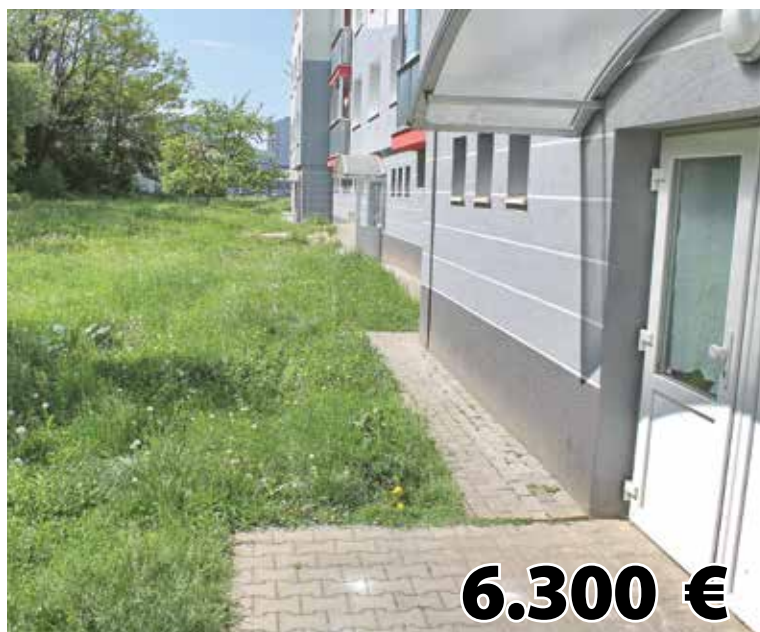
Vybudovanie chodníka na Okružnej ulici za obytným domom č. 1443