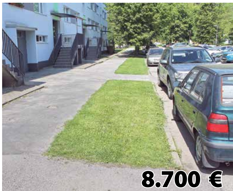
Rozšírenie parkovacích miest na Okružnej ulici č. 1425