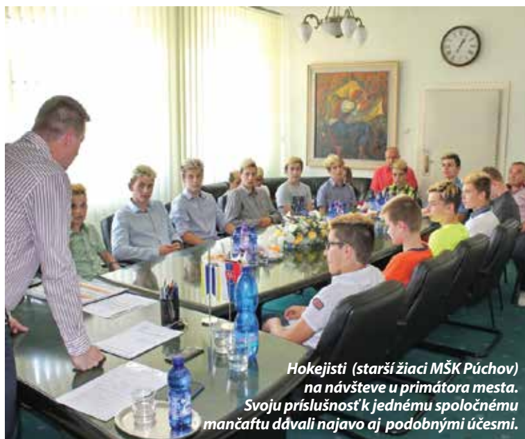
Hokejisti (starší žiaci MŠK Púchov) na návšteve u primátora mesta. Svoju príslušnosť k jednému spoločnému mančafu dávali najavo aj podobnými účesmi.

Primátor hráčom a realizačnému tímu poďakoval za dobrú reprezentáciu mesta a prisľúbil ďalšiu podporu hokeja zo strany mesta. -red-