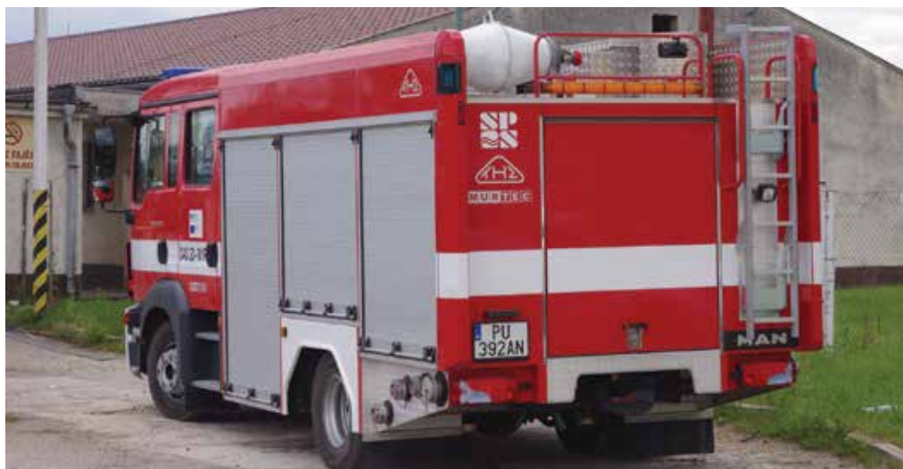
Púchovských hasičov v minulom týždni zamestnala poškodená prípojka plynu a požiar v Lednických Rovniach.

Na nadmerný hluk na Požiarnej ulici sa telefonicky sťažovali aj v noci o 22.30 hodine. Hluk mal podľa oznámenia vychádzať z jedného z barov, kde nemali mať zatvorené zadné dvere. Hliadka na mieste zistila priestupok proti verejnému poriadku, vyriešili ho napomenutím. Následne personál uzavrel dvere, cez ktoré sa šíril hluk.