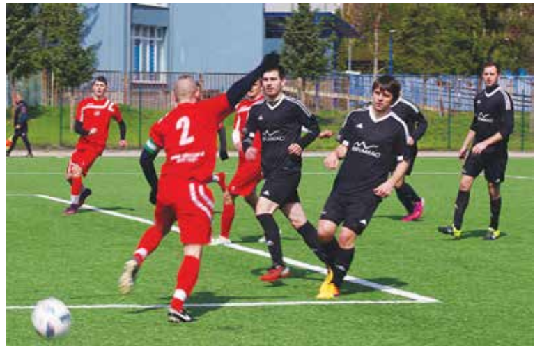
Futbalisti Lysej (v čiernych dresoch) sa postarali o najväčšiu senzáciu kola, keď dokázali zvíťaziť v Tuchyňi.