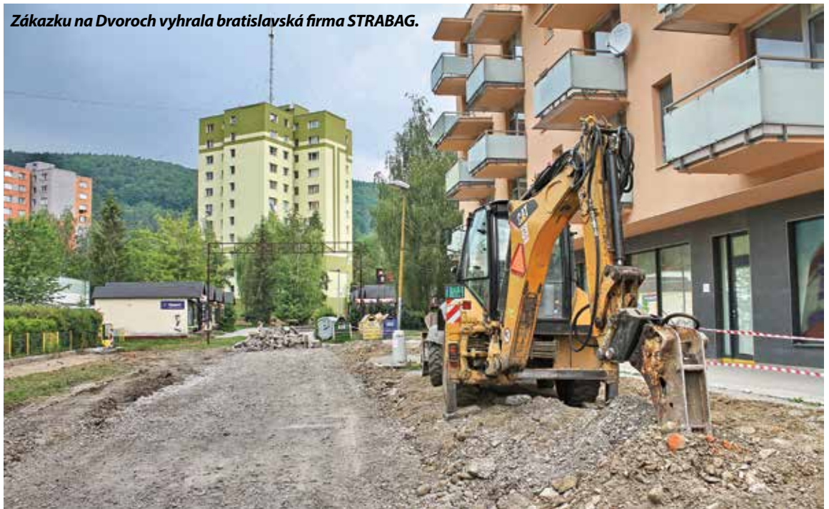
Zákazku na Dvoroch vyhrala bratislavská firma STRABAG.

Elektronickej súťaži sa zúčastnili štyri spoločnosti s nasledovnými ponúknutými cenami: