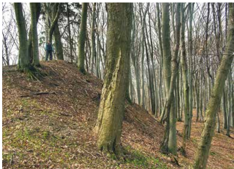
Výška valového opevnenia v porovnaní s dospelým človekom.