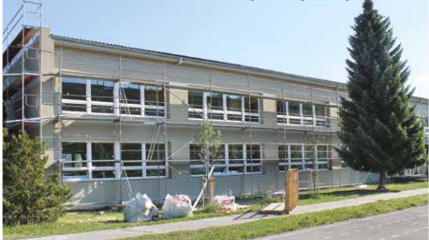
Rozsiahla rekonštrukcia ZŠ Gorazdova pokračuje zatepľovaním.