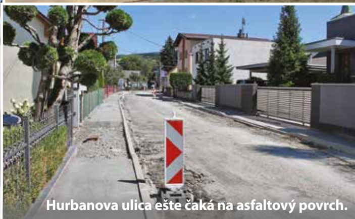
Hurbanova ulica ešte čaká na asfaltový povrch.