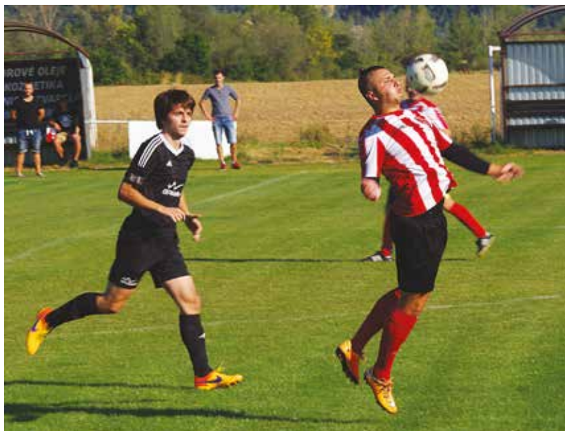
Situácia charakteristická pre prvý polčas stretnutia Kvašov - Lysá. Nováčik bol rýchlejší, šikovnejší i bojovnejší a väčšinou bol pri lopte skôr.

Skóre otvoril v ôsmej minúte Hofierka, na 2:0 zvýšoval v 22. minúte Hudec. Dvanásť minút pred koncom zvýšil na 3:0 Majerik a zaslúžené víťazstvo domácich spečatil ten istý hráč gólom z pokutového kopu osem minút pred koncom – 4:0.