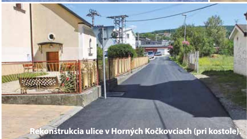
Rekonštrukcia ulice v Horných Kočkovciach (pri kostole).