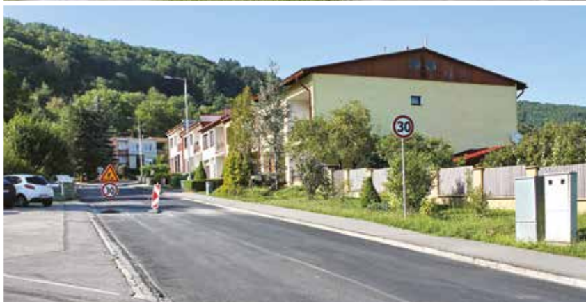
Odvodnená a vyasfaltovaná cesta na Zábrehu.