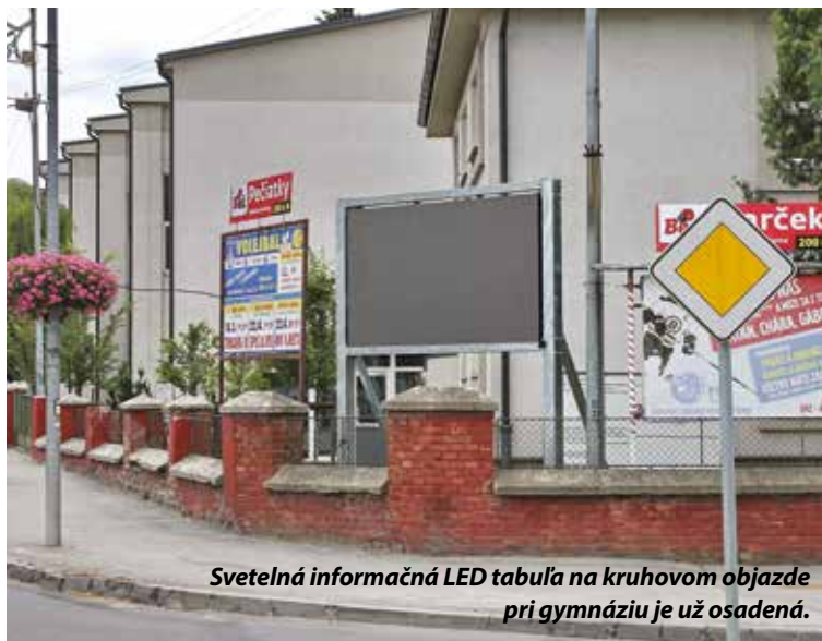
Svetelná informačná LED tabuľa na kruhovom objazde pri gymnáziu je už osadená.