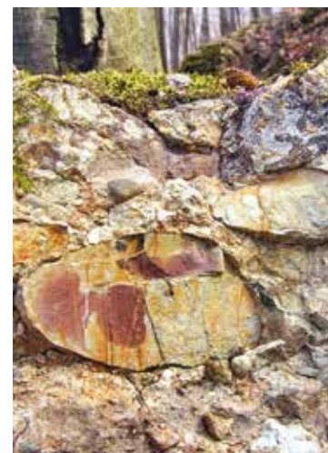
Druhohorné zlepené z obdobia kriedy, Hradisko nad Nosicami.