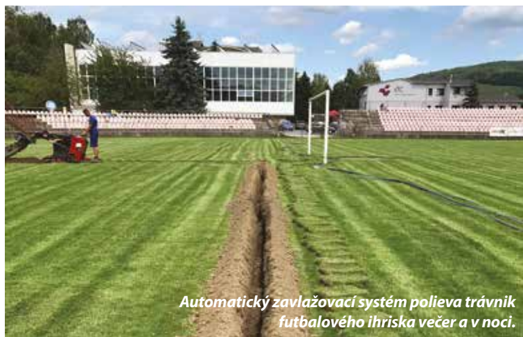
Automatický zavlažovací systém polieva trávnik futbalového ihriska večer a v noci.

Noviniek je niekoľko. Skutočne sa snažíme počas leta, kedy je športová prestávka ako pre futbal, hokej tak volejbal, spraviť v našom areáli čo najviac prác a noviniek. Samozrejme v množstve aké nám personálne a finančné možnosti dovoľujú. Na futba-