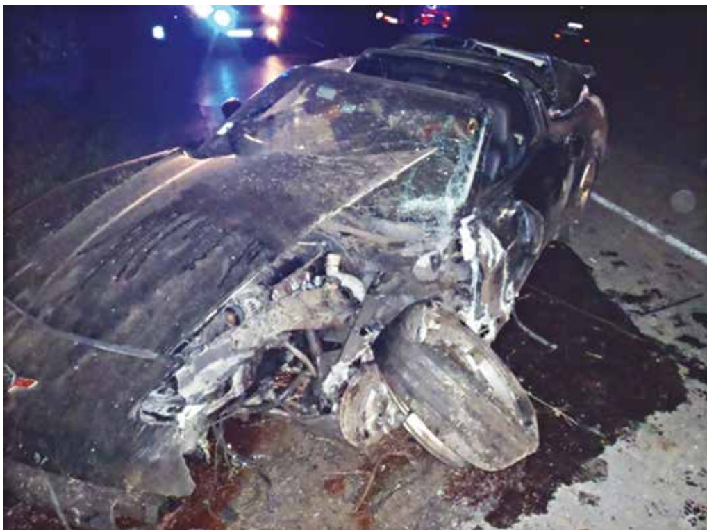
Pri dopravnej nehode v Nimnici sa zranil vodič osobného motorového vozidla.

Počas školského roka 2016/2017 vymeškala celkovo 179 vyučovacích hodín. Obvineným v prípade dokázania viny hrozí v zmysle zákona trest odňatia slobody až na dva roky. KR PZ Trenčín