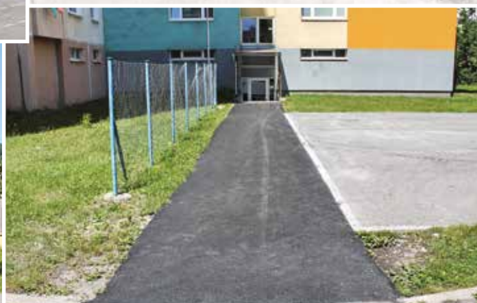
Spojovací chodník na ul. Komenskeho.