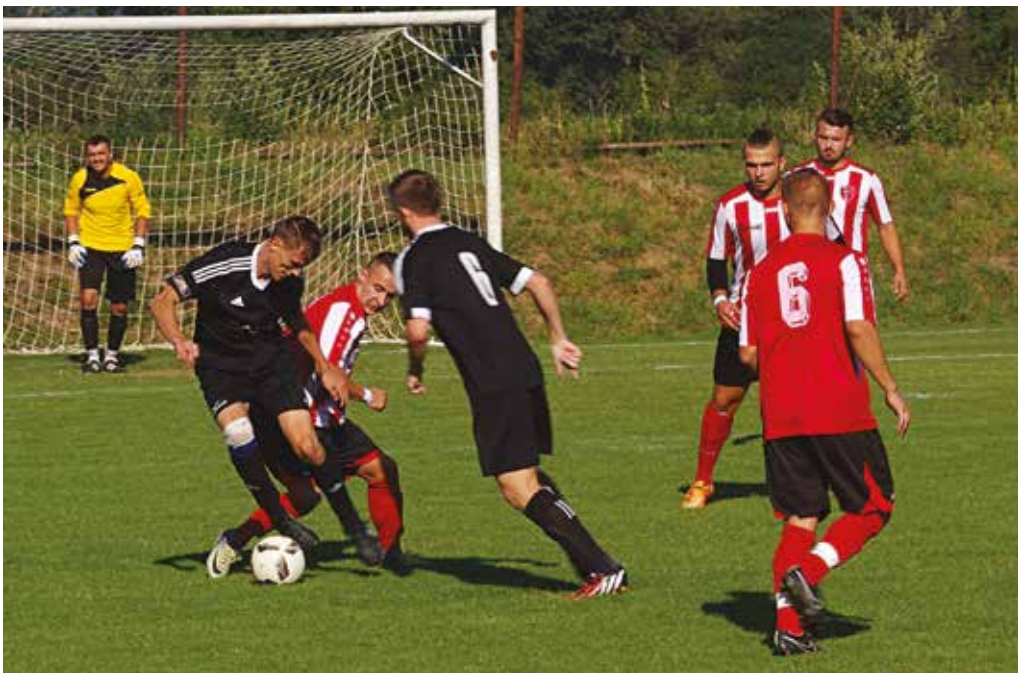
Futbalisti Lysej (v čiernych dresoch) sa v derby s nováčikom v prvom polčase dostali iba do jednej streleckej šance. V prvom polčase dominovali futbalisti Kvašova a za výkon v ňom si premiérové víťazstvo v šiestej lige zaslúžili.