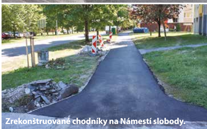
Zrekonštruované chodníky na Námestí slobody.