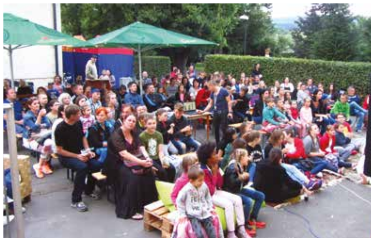
Počas leta sa veľkej obľube teší letné kino na terase kaviarne Podivný barón pri Župnom dome. Priaznivcov majú aj chillout a komorné koncerty alebo pravidelné cvičenia pod holým nebom v prílahlom parku.