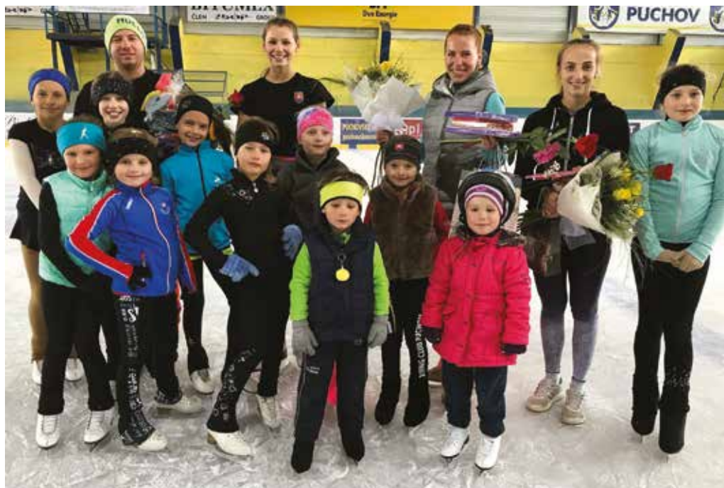
Krasokorčuliarske zručnosti, ktoré mladí Púchovčania získali počas letného sústredenia, by mali zžiťkovať už počas najbližšej sezóny. Na snímke účastníci ústredenia aj trénermi.