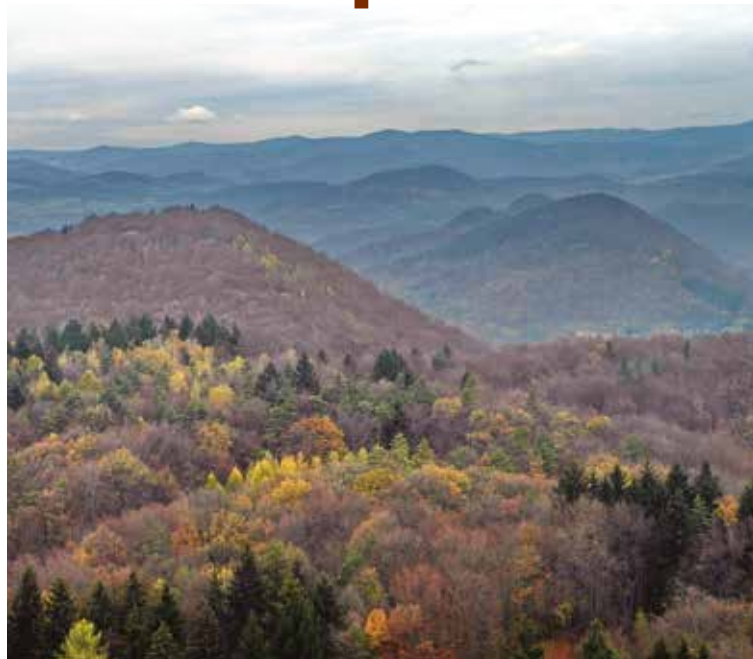
Pohľad na osídlenie púchovskej kultúry: Hradisko Nosice a hrádok Holíš v Nimnici.

Základom opevnenia je val, nasypaný z hlíny a kamienka na rozhraní vrcholovej plošiny a svahov kopca. Tesne pod ním vybudovali druhé valové opevnenie, na vrchole valu mohla stáť drevená palisáda. Detaily stavebnej techniky nepoznáme, musel by sa urobiť rez valom, vedeli použiť komorové, roštové, drevenohlinité konštrukcie, chránené čelnou kamennou plentou alebo nasucho kladeným múrom. Bez preverenia výskumom však vždy pôjde len o