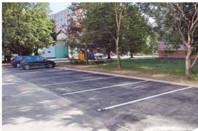
Na Pribinovej pribudla plocha na parkovanie.