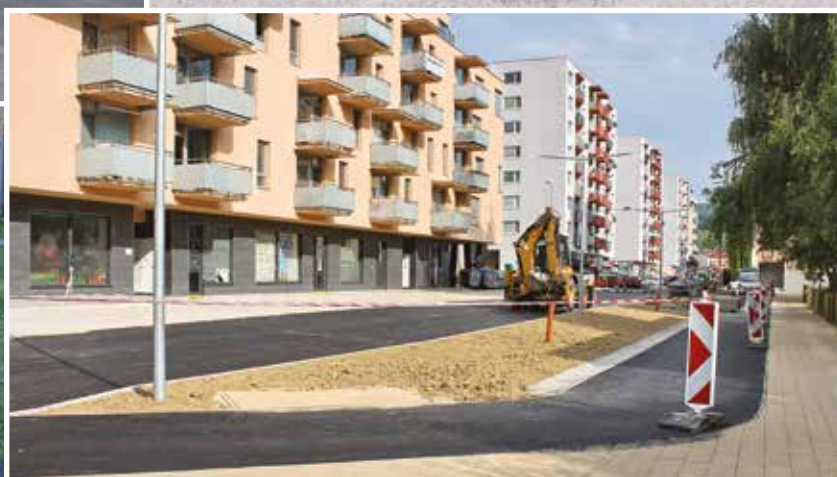
Dvory - po vydláždení chodníka bola vyasfaltovaná cesta.