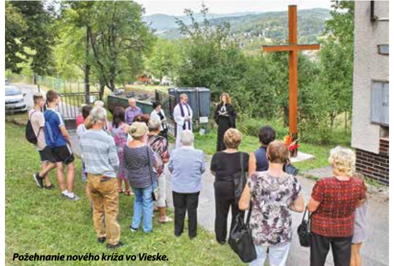
Požehnanie nového kríža vo Vieske.