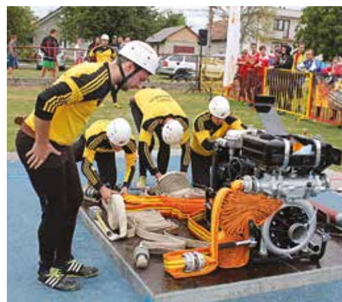
Muži Podhoria po domácom víťazstve v 12. kole urobili zrejme rozhodujúci krok k obhajobe minuloročného prvenstva v SMHL.

Ženy: 1. Dežerice - 137 bodov, 2. Ihrište – 129 bodov, 3. Nosice-žabky – 128 bodov, 4. Nedašova Lhota – 85 bodov, 5. Kocurany – 83 bodov, 6. Svinná – 76 bodov, 7. Ladce – 70 bodov, 8. Dulov – 69 bodov, 9. Dohňany – 65 bodov, 10. Kvašov – 58 bodov, 11. Horná Poruba – 52 bodov, 12. Lehota pod Vtáčnikom – 48 bodov.