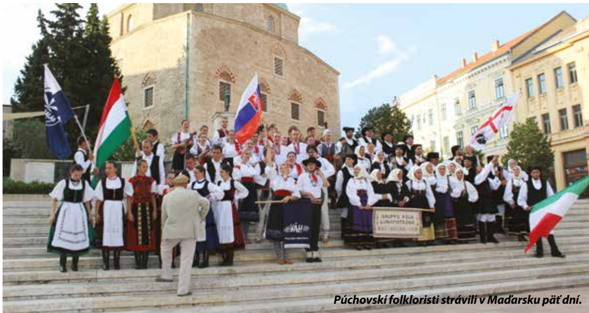
Púchovskí folkloristi strávili v Maďarsku päť dní.

Po mladších folkloristoch, ktorí v júni cestovali na festival do Španielska (čítaj na str. 14), vydal sa reprezentovať naše piesne a tance aj folklórny súbor Váh. Sedem tanečných párov a jedenásť muzikantov spolu s krojmi a hudobnými nástrojmi nabrali smer Pécs v Maďarsku horúceho 16. augusta poobede.