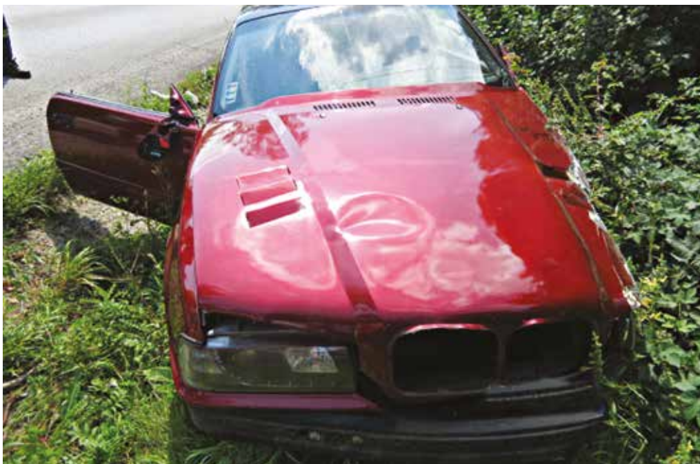
Nesprávne predbiehanie bolo príčinou dopravnej nehody na ceste medzi Udičou a Púchovom. Vyžiadala si našťastie iba ľahké zranenie.

Hliadku mestskej polície požiadala stála služba Obvodného oddelenia policajného zboru v Púchove o pomoc pri odchyte vlčička, ktorý mal vo dvore rodinného domu na Kukučínovej ulici roztrhať sliepky a kohúta. Mestskí policajti našli na mieste policajnú hliadku a zistili, že pes, ktorý sliepky roztrhal bol susedov. Majiteľ psa uzavrel do dvora rodinného domu. Prípad rieši obvodné oddelenie.