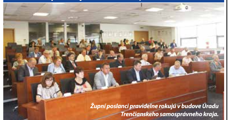
Župní poslanci pravidelne rokujú v budove Úradu Trenčianskeho samosprávneho kraja.

Cenník politickej inzercie Púchovských novín na str. 7