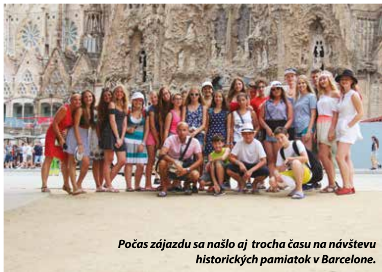
Počas zájazdu sa našlo aj trochu času na návštevu historických pamiatok v Barcelone.