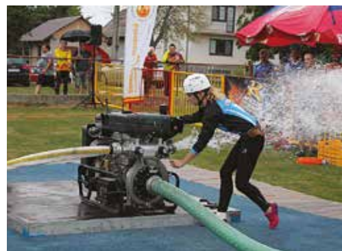
Ženy Dohňan príjemne prekvapili bronzovou priečkou v Podhorí.