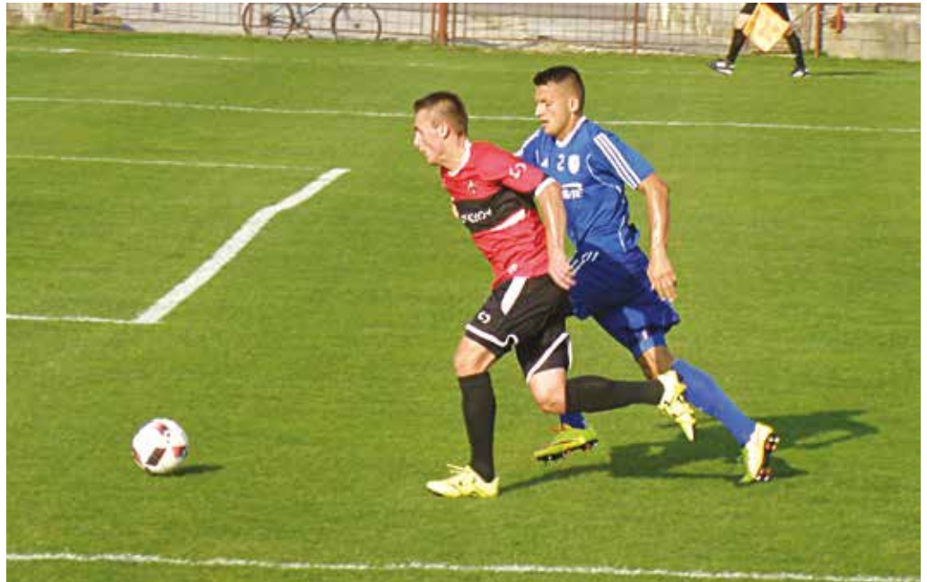
Futbalisti MŠK Púchov (v červených dresoch) nedokázali doma v okresnom derby vyzrieť na Belušu. Naopak, bod zachraňovali v úplnom závere stretnutia.

Streda B – Gabčíkovo 1:2, Nitra B – Lednické Rovne 3:1, Borčice – Zlaté Moravce 4:0, Nemšová/Horovce – Nové Zámky 1:2, Beluša – Veľké Ludince 2:1