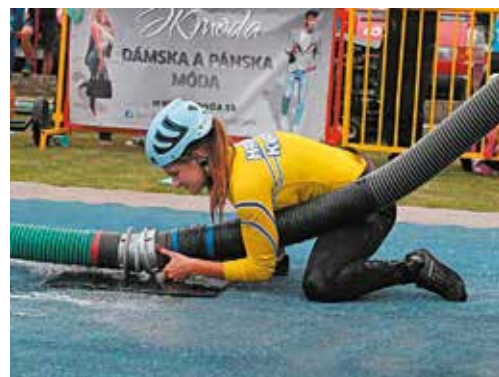
Dievčatá z Kvašova v Slovensko-moravskej hasičskej lige ešte len zbierajú skúsenosti. Rozhodne ju však oživil.