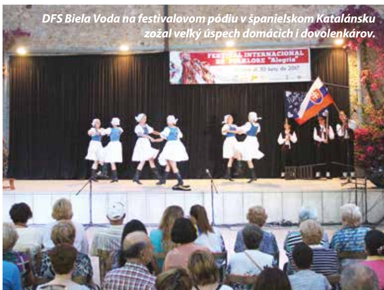
DFS Biela Voda na festivalovom pódium v španielskom Katalánsku zožal veľký úspech domácich i dovolenkárov.