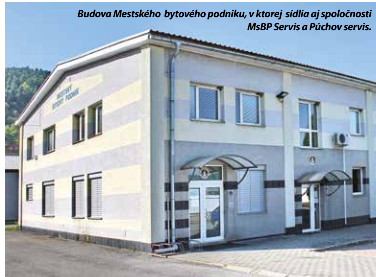
Budova Mestského bytového podniku, v ktorej sídli aj spoločnosť MsBP Servis a Púchov servis.

Spoločnosť MsBP Servis, s. r. o. je 100%-ná dcérska spoločnosť MESTSKÉHO BYTOVÉHO PODNIKU, s. r. o. založená v roku 2001. Poskytuje najmä opravy a údržbu energetických zariadení, bytov a nebytových priestorov, vedenie účtovníctva, maloobchodný predaj kúrenárskeho tovaru a správu