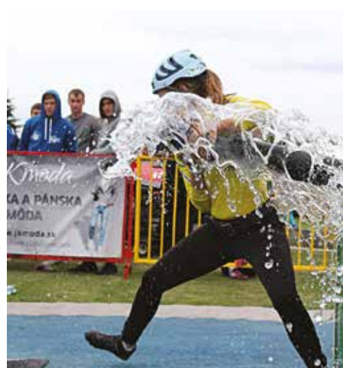
Slovensko-moravská hasičská liga má svoje čaro...