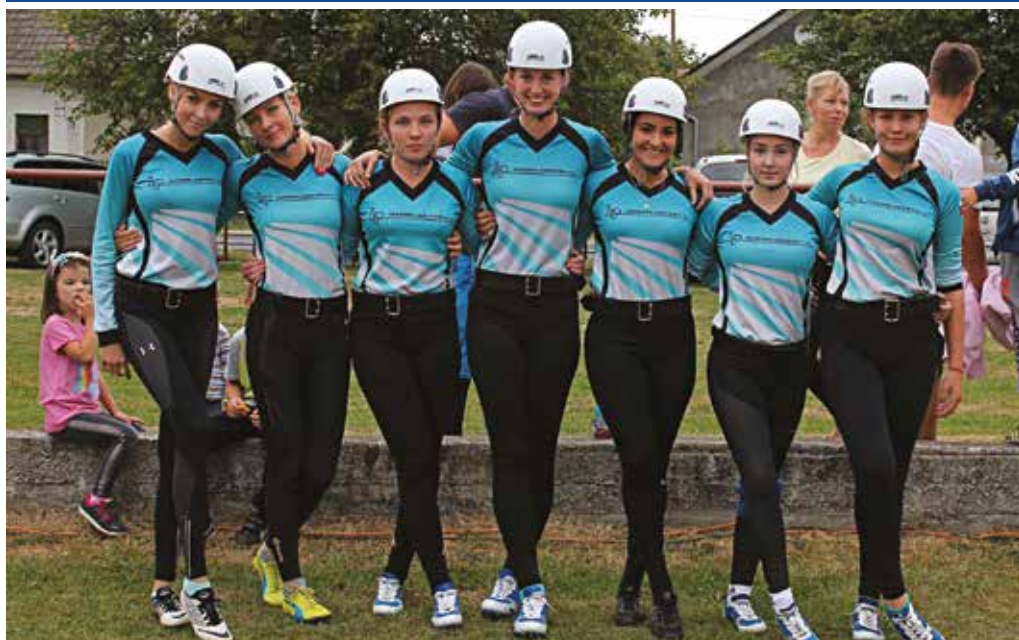
Dievčatá z Ihrišťa dokázali v 12. kole SMHL v Podhorí zvíťaziť a uchovali si tak nádej na celkové prvenstvo. Pred poslednými dvomi kolami strácali na vedúce Dežerice sedem bodov.