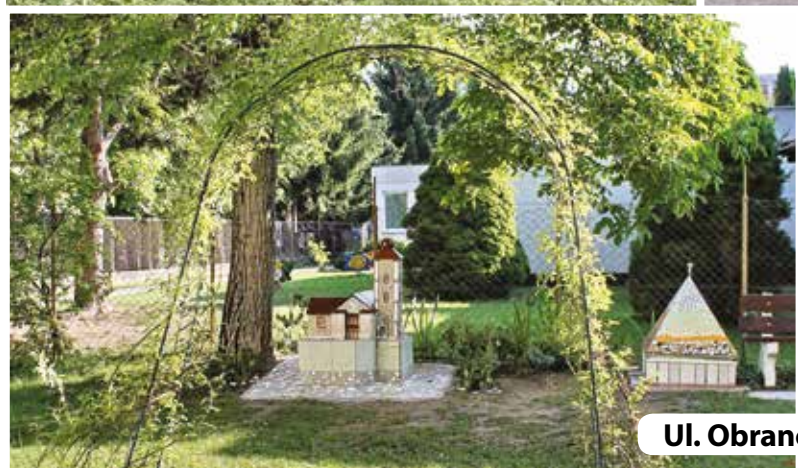
Ul. Obrancov mieru