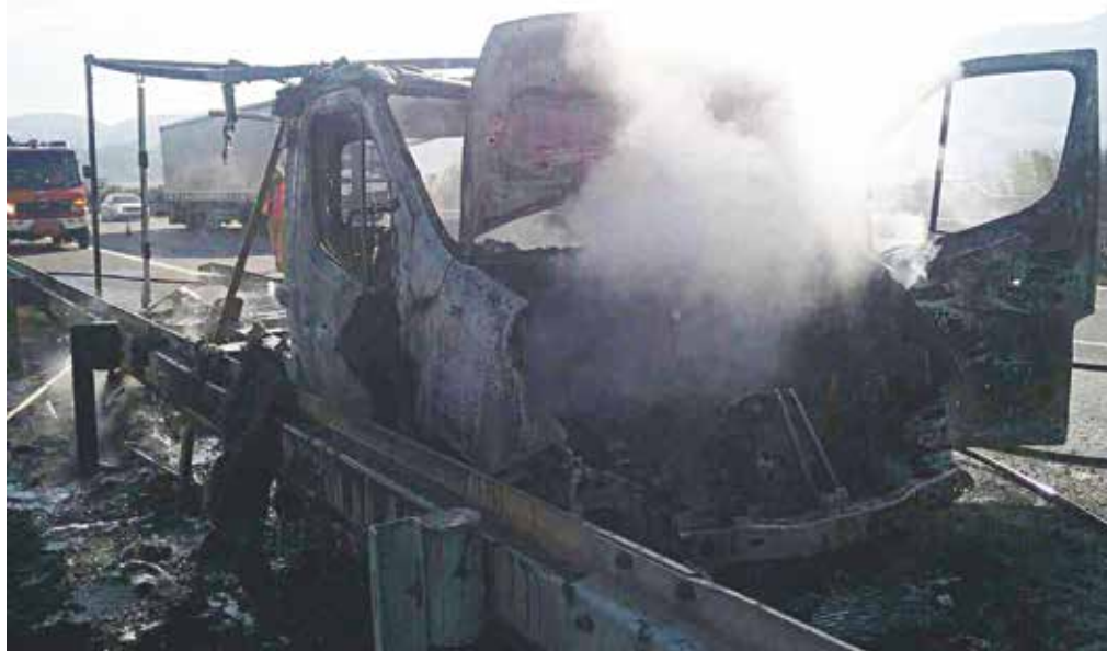
Pohľad na horiacu dodávku bol hrôzostrašný. Našťastie sa nikto nezranil.

Krátko pred polnocou privolali príslušníci mestskej polície zdravotných záchranárov k mužovi, pri ktorom bolo podozrenie na epileptický záchvat. Muža z Púchova si o desať minút po zavolaní prevzala posádka lekárskej záchrannej služby. Ošetrujúca lekárka vzápätí skonštatovala, že to nie je epileptický záchvat, ale obyčajná opitost'. Znečistenie verejného priestranstva zvratkami vyhodnotili mestskí policajti ako priestupok a potrestali ho tentokrát napomenutím.