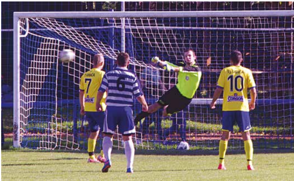
V tomto prípade ešte brankár Dolných Kočkoviec Garaj loptu pred útočníkmi Udiče poslal do bezpečia, no v 53. minúte bol na pokutový kop bezmocný. Dolné Kočkovce tak s Udičou iba remizovali.

Nováčik z Kvašova pokračuje v spanilej jazde a všetky body si odviezol aj z horúcej pôdy v Tuchyni, kde si súper po víťazstvách tak často nechodia. Kvašovčania sa opäť prezentovali svojou typickou technickou hrou založenou na rýchlosti a výbornej kondícii hráčov. Nováčik išiel do vedenia už v 11. minúte, kedy Dohňanského v domácej bránke prekonal