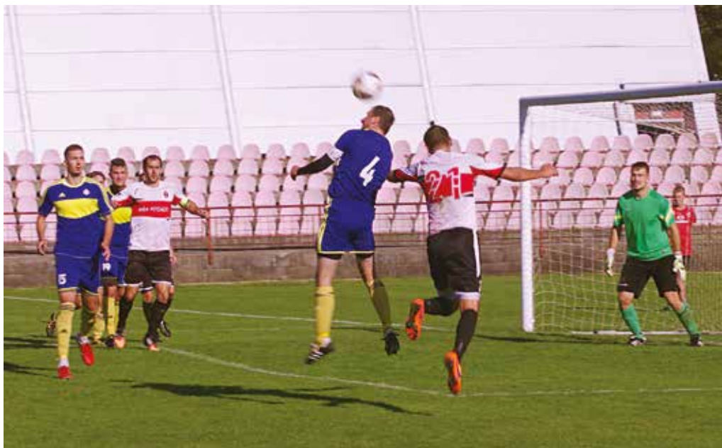
Púchovčania (v bielych dresoch) si v nedeľu proti rezerve Zlatých Moraviec napravili streleckú chuť a nastrieliari súperovi päť gólov.