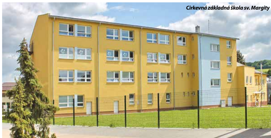
Cirkevná základná škola sv. Margity

Školy s najlepšimi výsledkami navštevujú žiaci, ktorí dosahujú výborné výsledky v celonárodných testoch, sú úspešní v olympiádach a medzinárodných projektoch. Naopak školy s najhoršími výsledkami dosahujú nízku úspešnosť v celonárodných testoch. Olympiád ani medzinárodných projektov sa nezúčastňujú a ich absolventi končia