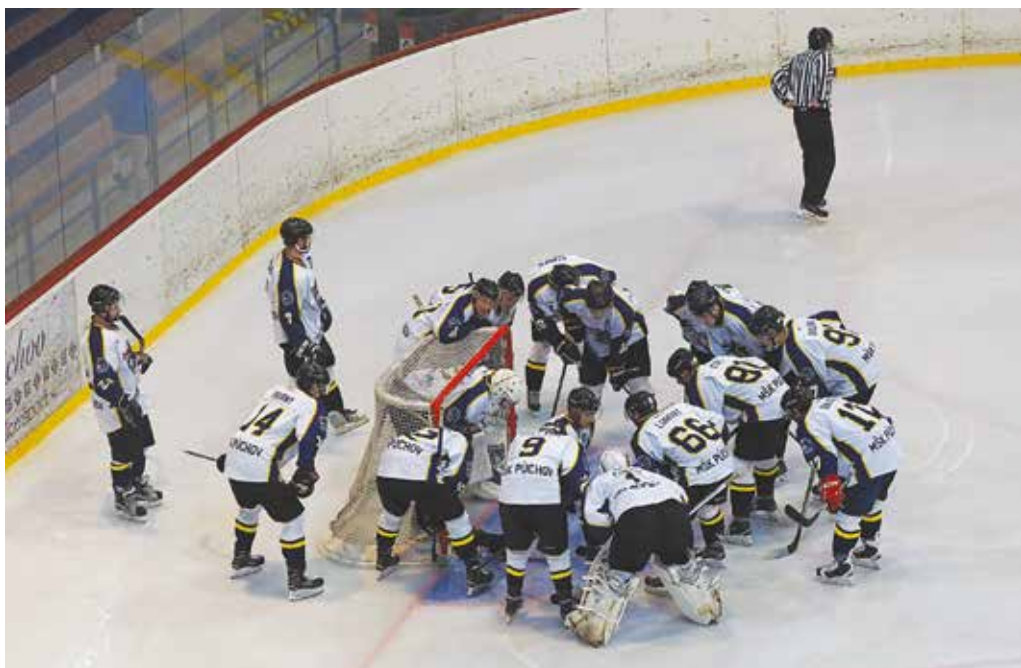
Muži MŠK Púchov sú aj po piatom kole bez straty bodu.