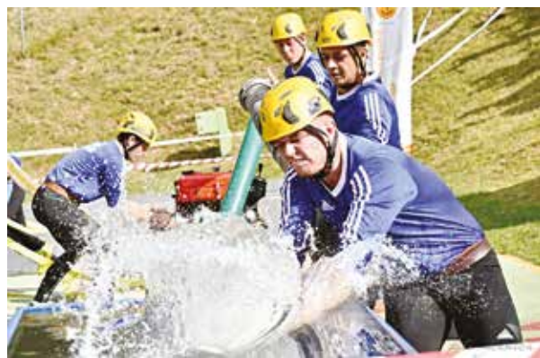
Muži DHZ Visolaje patrili k najpríjemnejším prekvapeniam SMHL.